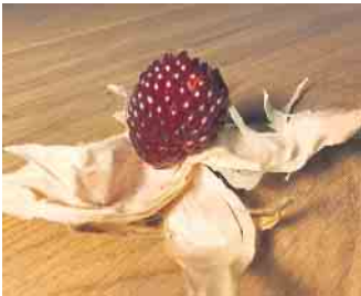
Erdbeermais: Eine beliebte Sorte in der Ausleihe

anzupassen und natürlich: Alle Gartenbegeisterte glücklich zu machen. Weitere Informationen unter: Tel.: 02206 2143 oder Naturschule@Lohmar.de