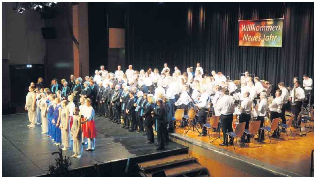
Begrüßung des neuen Jahres mit einem vielfältigen Programm

Eröffnet wurde das Konzert fulminant mit Musik aus dem Musicalfilm „The Greatest Showman“ durch die Blasorchester aus Neuhonrath und Lohmar, die sich erneut zu einem Gemeinschaftsorchester zusammengeschlossen hatten. Im weiteren Verlauf des Konzertes konnten die Besucher:innen immer wieder in die vielfältige Welt des Blasorchesters eintauchen mit Stücken wie „Perpetuum mobile“ von Johann Strauss oder „80er Kult (TOUR)“. Bereichert wurde das Konzert auch durch die Musik- und Kunstschule Lohmar und ihren Gitarrenschüler:innen, die in unterschiedlichen Zusammenstellungen bekannte Melodien von Popsongs zum Besten gaben. Und