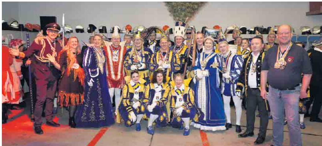
Tollitäten aus Birk, Siegburg und Overath

Alles in allem war es wieder ein super Abend mit toller Stimmung, der Lust auf eine Fortsetzung macht. Zum Abschluss bleibt nur noch eins zu sagen: Vielen Dank an alle Vereine und Tollitäten die dabei waren!