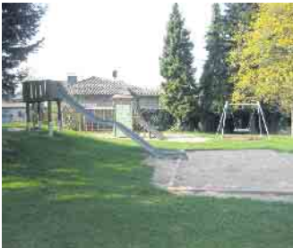
Die alten Spielgeräte werden schon bald Platz für die Neugestaltung machen.

ze, der Spielplatz wird dann für wenige Wochen nicht bespielbar sein. Die Arbeiten zur Gestaltung des Geländes und die Montagearbeiten sind für die fünfte Kalenderwoche vorgesehen, so dass die Kinder im Ortsteil schon sehr bald „ihren“ neuen Spielplatz bespielen können.