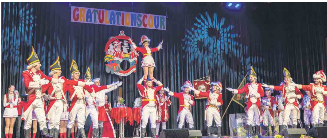
Das KaZi-Funkencorps „Rut-Wiess“ zeigt sein Können.