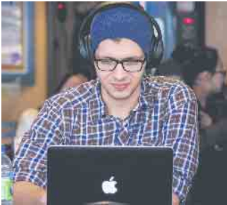
Bei der Lehrstellensuche spielt das Internet eine große Rolle.

Auch Tage der offenen Tür oder andere Events werden häufig über Online-Kanäle angekündigt und bieten die Chance, den Lehrbetrieb von innen kennenzulernen und sich mit anderen Lehrlingen auszutauschen. (www/aubi-plus)