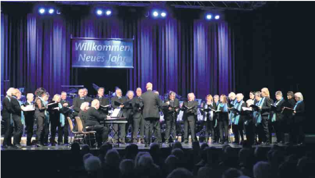
Singgemeinschaft Birk beim Lohmarer Neujahrskonzert.

„Die Singgemeinschaft Birk bringt den Gesang in das Neujahrskonzert“, so formulierte es Moderator Johannes Wingenfeld am Sonntag, 15. Januar in der Jabachhalle. Nach vier Jahren Pause konnte endlich wieder die Neuauflage