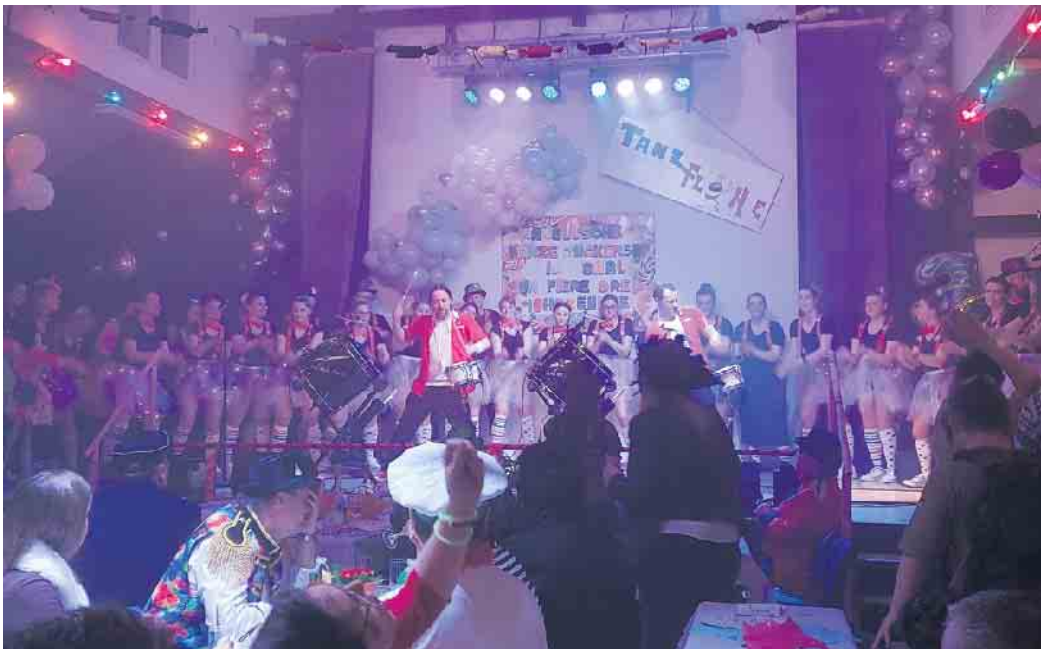
Das Finale mit „the real safri“