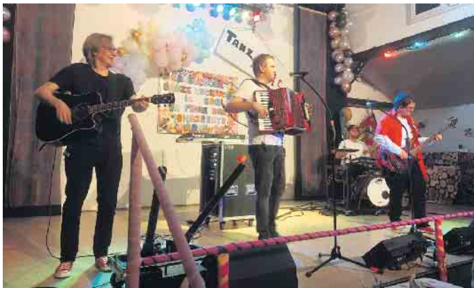
De Drömmelköppe auf der Bühne