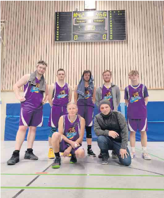
Herren 1 nach dem Erfolg