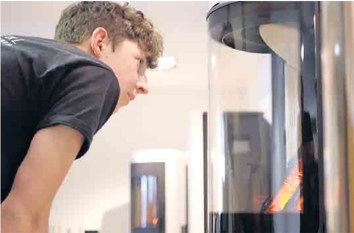
Die Ausbildung zum Ofen- und Luftheizungsbauer bietet ausgezeichnete Zukunftsperspektiven.

individuell nach Kundenwünschen errichten. Mit etwas Berufserfahrung kann man seinen Meister machen, Fach- und Führungsaufgaben übernehmen und im Betrieb aufsteigen. Oder man wagt mit dem Meistertitel die Selbstständigkeit. Eine Weiterbildung als Techniker in der Fachrichtung Heizungs-, Lüftungs-, Klimatechnik ist ebenso möglich. Und ein nachfolgendes Bachelor-Studium im Studienfach Versorgungstechnik eröffnet weitere Karrierechancen. Einen #ofenhelden Infotalk findet man kostenfrei unter https://wir-sind.ofenhelden.info . Ofenbauer informieren hier über ihren abwechslungsreichen Beruf. Wer ihn kennenlernen möchte, sollte sich nach einem ein- oder mehrwöchigen Praktikum bei einem Ofenbauerbetrieb in der Nähe erkundigen, unter www.ofenhelden.info gibt es dazu mehr Informationen. (DJD)