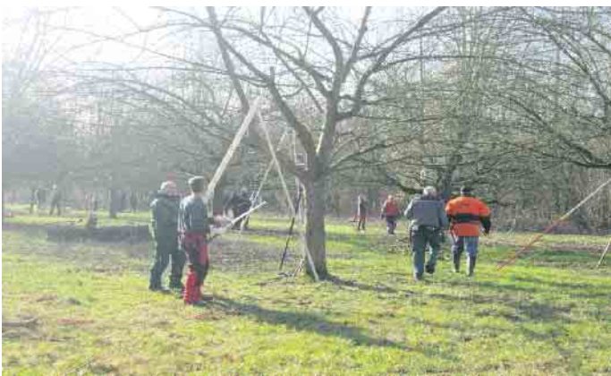
Obstbaumschnitt auf einer Streuobstwiese

schiedlichen Schnitt-Arten gesund erhält. Gerne können auch Fragen zu den eigenen Bäumen im Garten gestellt werden, z.B. zu Baumkrankheiten, nachlassende Fruchtqualität, Mehrsorten-Baum, oder fehlender Fruchtansatz. Zwischenzeitlich werden sich die Teilnehmer einen Obstbaum in der Nähe anschauen und ggf. wird Herr Przygoda eine Schnittmethode vorführen. Abschließend kann er bei einem heißen Eintopf auf individuelle Fragen eingehen. Auf witterungsangepasste Kleidung für den Praxis-Teil wird hingewiesen. Treffpunkt ist um 10 Uhr beim Café Zeitlos am Ev. Altenheim in Wahlscheid, Heiligenstock 27. Der Kurs ist kostenlos.