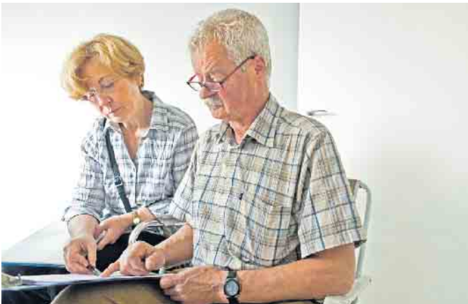
Angebote von Bauunternehmen für den Bau der eigenen vier Wände sollte man genau unter die Lupe nehmen, gegebenenfalls mit sachverständiger Unterstützung.

Werbeprospekte des Baupartners enthalten nur allgemeine Informationen und taugen daher nicht als Grundlage für ein Hausangebot. „Bauherren sollten auf komplette Unterlagen bestehen“, lautet der Rat von Erik Stange. Dazu gehöre eine umfassende, gesetzeskonforme Bau- und Leistungsbeschreibung, der Vertrag mit Zahlungsplan und die Grundrisse mit Angaben zur Wohnfläche