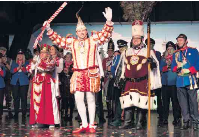
Das diesjährige Lohmarer Dreigestirn

KAZI Lohmar mit Funkenkorps „Rut-Wiess“ von 1948 e.V., das Lohmarer Dreigestirn mit Prinz Bork I., Jungfrau Maximiliane und Bauer Sven, die Showgirls aus Krahwinkel-Breidt und die Ehrengarde Birk rundeten den Abend ab. Anschließend wurde zu Musik von