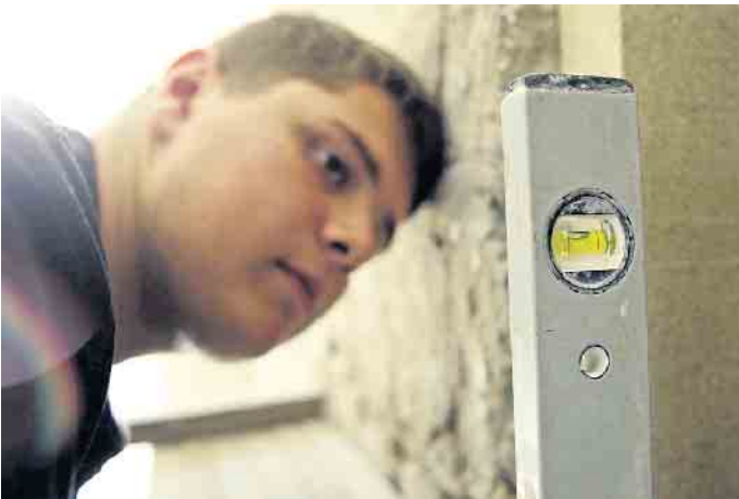
Bei der Ausbildung zum Ofen- und Luftheizungsbauer lernt man vielfältige Tätigkeiten kennen.

steigen nach dem Abi ein. Die Ausbildung dauert in der Regel drei Jahre im dualen System, pro Halbjahr stehen sechs Wochen Berufsschule und eine Woche überbetriebliche Ausbildung auf dem Programm. Eine Verkürzung der Ausbildung ist möglich. Nach der Gesellenprüfung stehen viele Türen offen: Ofen- und Luftheizungsbauer arbeiten sowohl für Industriebetriebe, die Öfen in Serie herstellen, als auch in Kleinbetrieben, die Kachelöfen