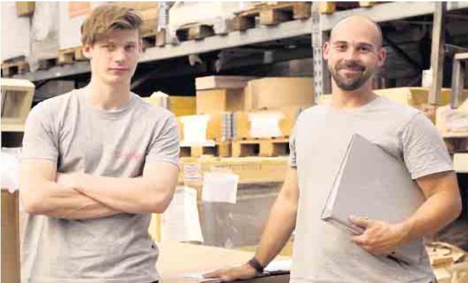
Viele Nachwuchskräfte kommen über ein Praktikum zu ihrem Beruf als Ofen- und Luftheizungsbauer.

steigen nach dem Abi ein. Die Ausbildung dauert in der Regel drei Jahre im dualen System, pro Halbjahr stehen sechs Wochen Berufsschule und eine Woche überbetriebliche Ausbildung auf dem Programm. Eine Verkürzung der Ausbildung ist möglich. Nach der Gesellenprüfung stehen viele Türen offen: Ofen- und Luftheizungsbauer arbeiten sowohl für Industriebetriebe, die Öfen in Serie herstellen, als auch in Kleinbetrieben, die Kachelöfen