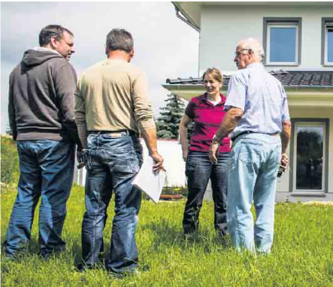
Bei der Suche nach einem geeigneten Baupartner kann auch die Besichtigung bereits errichteter Referenzobjekte dieses Anbieters helfen.

und zur genauen Bemaßung. Auch ein detailliert aufgeschlüsselter Preis darf nicht fehlen. Gegebenenfalls muss er zudem gewünschte Sonderleistungen oder Gutschriften für Eigenleistungen enthalten, die nach Lohn- und Materialanteil aufgeschlüsselt sind. (djd)