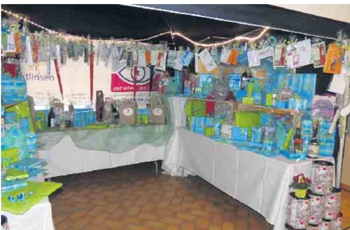
Tolle Auswahl an Preisen.

Gewinne in Empfang nehmen können. „Saach hür ens“ Lohmar e.V. bedankt sich auf diese Weise schon jetzt bei allen Gönnern und Sponsoren für die großzügigen Spenden und wünscht den Besucher*innen der Sitzung viel Spaß bei einem wieder einmal tollen Programm mit Stars des rheinischen Karnevals, Lohmarer Vereinen, dem Lohmarer Dreigestirn und dem eigenen Nachwuchs. Obwohl die ehemalige Mundartgruppe der MKS Lohmar im letzten Jahr aufgelöst wurde, werden dennoch aus dieser Gruppe zwei Redebeiträge ebenso auf der Bühne stehen wie einige tolle Beiträge, die man in Lohmar bislang noch nicht gesehen hat.