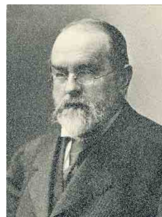
Josef Gabriel Rheinberger

Der Eintritt ist frei, Spenden werden erbeten. Herzliche Einladung!