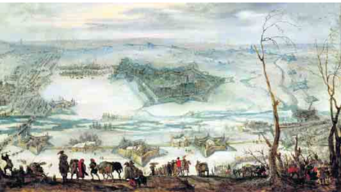
„Die Belagerung der Festung Jülich 1621/22“ des flämischen Künstlers Pieter Snayers aus dem Bestand des Museums Jülich.

Der Geschichtsverein lädt zum Vortrag „Weltreich und Provinz. Die Spanier im Jülicher Land 1560-1660“