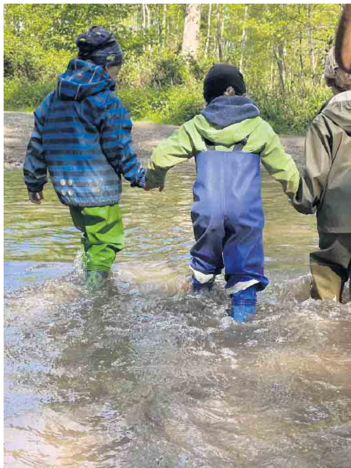
In Pfützen tanzen und im Regen lachen