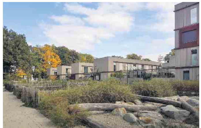
Das Bild zeigt eine ökologische Mustersiedlung in München mit ressourceneffizienten Gebäudetypen, die künftig auch in Gewerbegebieten im Rheinischen Revier errichtet werden könnten.

Eine Website wird über den Projektfortschritt informieren und interessierten Kommunen später Zugang zu einer Datenbank gewähren. Für das kommende Jahr sind unter anderem zwei Stakeholder-Workshops und ein „runder Tisch“ für Akteure aus dem gesamten Rheinischen Revier geplant.