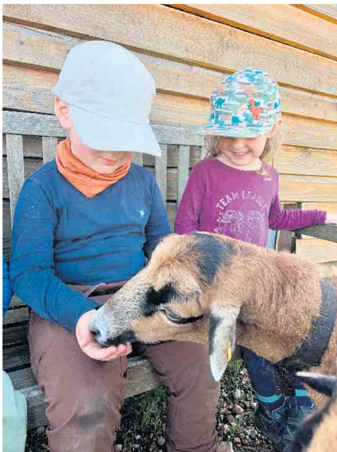
Kinder der Einrichtung bei der Versorgung unserer Schafe

Kindliche Faszination: Wenn Träume auf zarten Samen fliegen