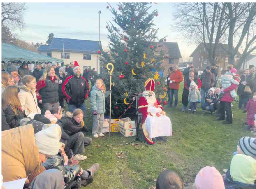
Nikolaus zu Besuch bei den Burgnarren

Bei schönem, trockenem Wetter kam auch der Nikolaus zu Besuch