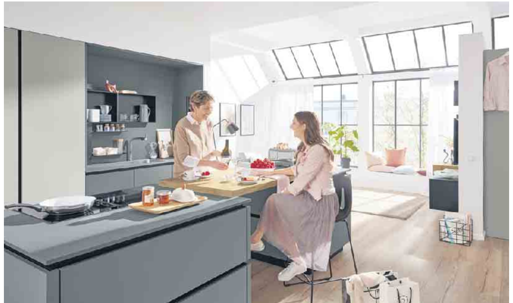
Ein dezentes Farbkonzept und strapazierfähige, ultramatte Oberflächen sorgen hier für Wohlfühlatmosphäre. Die markante Arbeitsplatte verbindet die beiden Kochinseln und fungiert zusätzlich als schicke Esstheke.

Je nach Haushaltsgröße, individuellem Lebensstil und den persönlichen Ernährungs- und Kochgewohnheiten kommen dafür kleinere bis opulentere Lösungen infrage. Das kann beispielsweise ein Essplatz direkt an der attraktiven Kücheninsel sein - in Form einer klei-