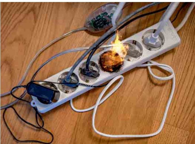
Brennende Steckerleiste durch Kurzschluss

triebnahme unbedingt offiziell abgenommen werden.“ Nur die Hälfte der Eigenheime richtig mit Rauchmeldern ausgestattet: Besonders besorgniserregend in diesem Zusammenhang: Trotz bundesweiter Rauchmelderpflicht und nachgewiesener Wirksamkeit ist nur die Hälfte der Eigenheime in Deutschland ausreichend mit Rauchmeldern ausgestattet. Die Initiative „Rauchmelder retten Leben“ appelliert daher an alle Eigentümer, sich und die eigene Familie zu Hause ausreichend mit Rauchmeldern zu schützen und auf alternative, nicht vom Schornsteinfeger abgenommene, Heizmethoden jeglicher Art zu verzichten. Denn vielen Menschen ist nicht bewusst, dass Brandrauch schon nach zwei Minuten zu einer tödlichen Rauchgasvergiftung führen kann. (Initiative „Rauchmelder retten Leben“)