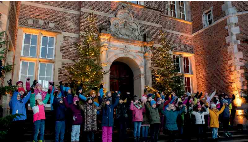
Kinderchor der Martinusschule Schlich.

Adventskonzert des Kinderchores der Martinusschule auf Schloss Merode