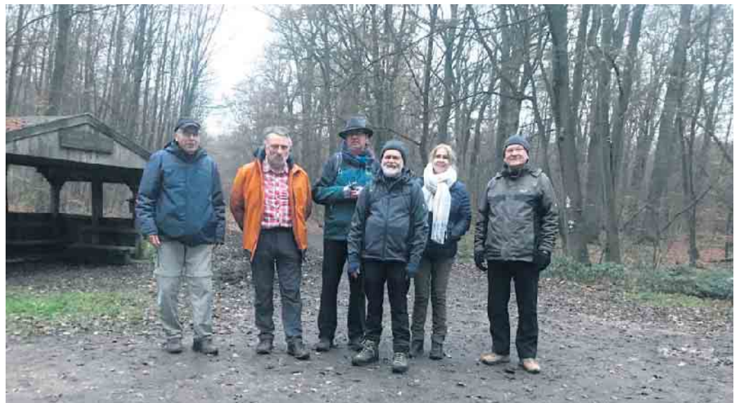
Wanderrund um Frechen