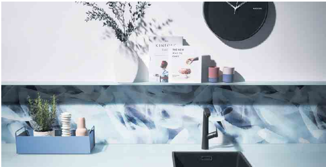
Mit Glas lassen sich sehr individuelle Lifestyles realisieren - beispielsweise diese Komposition in zartem Gletscherblau, bei der das Motiv der Glas-Rückwand ideal mit dem Farbton der Glas-Arbeitsplatte harmonisiert.