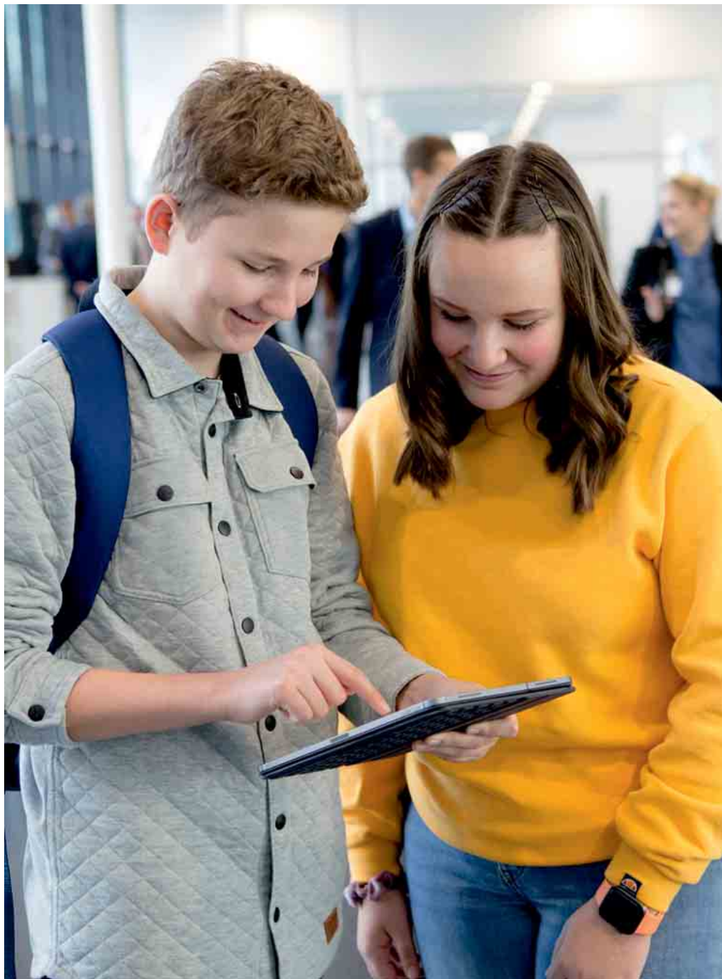
Deutschland sicher im Netz e.V. ruft Schülerinnen und Schüler der Klassen 7 bis 12 dazu auf, sich an dem Wettbewerb myDigitalWorld 2022 zu beteiligen.

Kreative eigene Ideen, die das Internet sicherer machen, können Schüler:innen außerdem unter dem Stichwort „Mein Beitrag für mehr Sicherheit im Netz“ abgeben. Neben Sach- und Geldpreisen gibt es eine Klassenfahrt nach Berlin zu gewinnen. Einsendeschluss ist der 30. April 2023, mehr Infor-