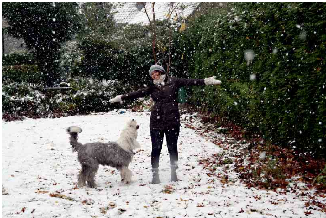
Austauschschüler aus aller Welt möchten den Winter in Deutschland entdecken.

Gastfamilien lernen eine neue Kultur in den eigenen vier Wänden kennen und bereichern ihr Familienleben um ein internationales Mitglied auf Zeit. Besonde-