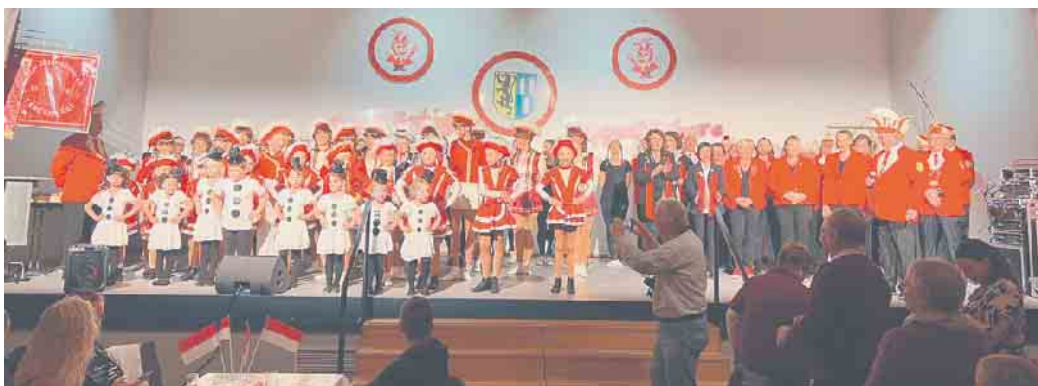
Garden/Mariechen/Mitglieder der KG Löstige Döppesbäckere