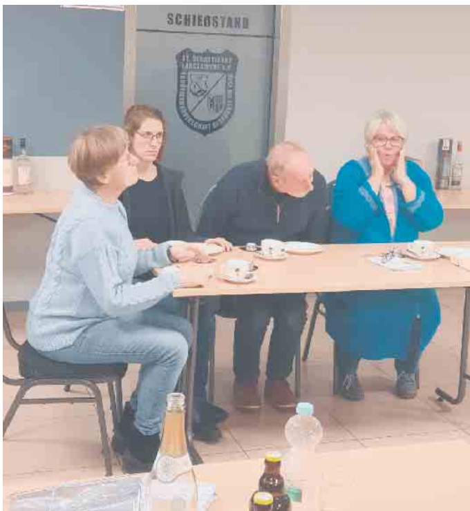
Kleiner Einblick in die Proben.

der St. Sebastianus Schützenbruderschaft Langerwehe