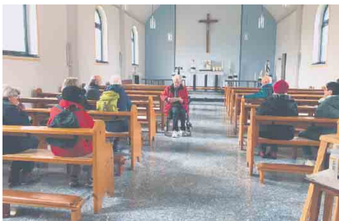
Die Kapelle der hl. Bernadette in Obergiech