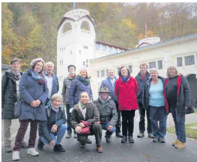
Vor dem Jugendstilkraftwerk

Wir sind auf die Entwicklung der Abtei Mariawald gespannt. Schade, wenn diese spirituelle Oase der Ruhe verloren ginge. Aber Trappistenbier darf ruhig ausgetrenkt werden.