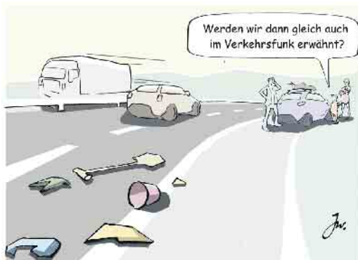
Kaum zu glauben, was so alles auf den Fahrbahnen herumliegt.

besten, man überprüft bei Pausen unterwegs, dass die Ladung noch stabil verankert und verschnürt ist. (mid/ak-o)