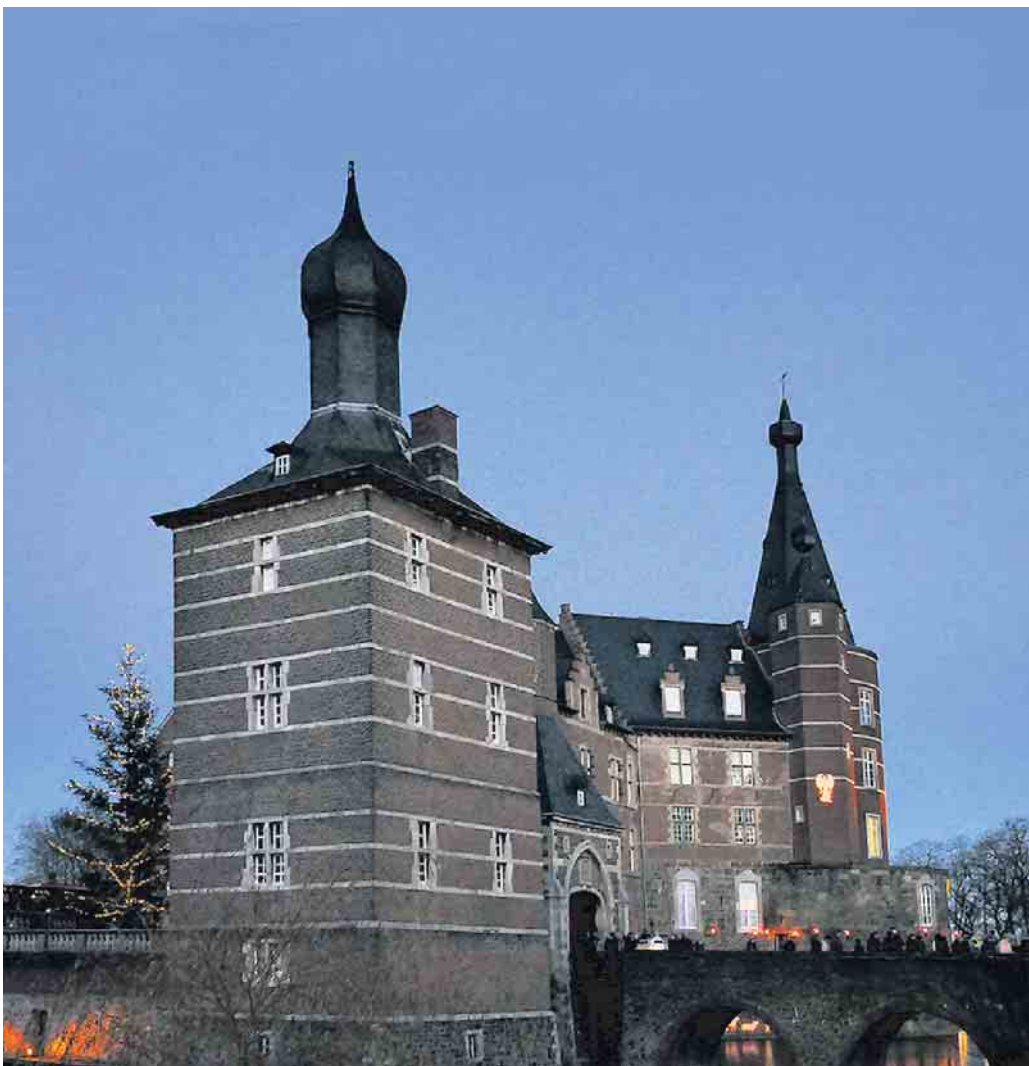
Weihnachtsmarkt Schloss Merode.