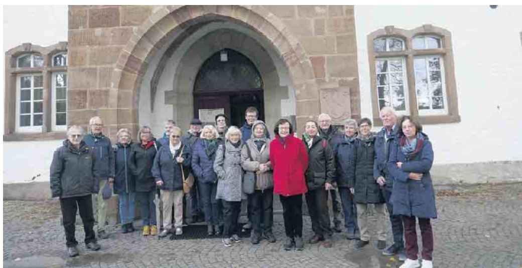
Vor der Klosterpforte

In den ungeheizten Gemäuern zog die Kälte langsam in die Füße. Daher war die Erbsensuppe ein echter Aufwärmer. Einige Unermüdliche hatten erst noch den Abstecher zum Friedhof gemacht. Zuvor hatten wir die Holzbahre gesehen, auf der die Toten zu Gra-