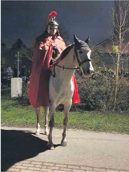
St. Martin zu Pferd

Auch in diesem Jahr war es dem Martinsausschuss der Schützenbruderschaft Sankt Sebastianus und Sankt Prankratus Inden/Altdorf wieder möglich den Martinzug durch die Gemeinde Inden/Altdorf durchzuführen. Dieser fand am Mittwoch, 9. November statt.