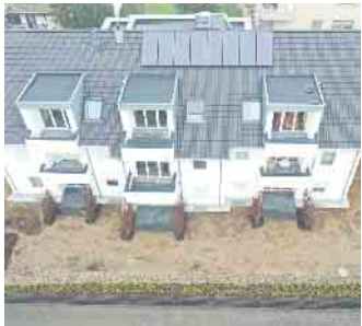
Das Dachdeckerhandwerk, der richtige Ansprechpartner für die Solaranlage auf dem Dach.

Coronakrise gekommen sei: kaum Kurzarbeit und wenige Entlassungen. Auch dies ein Pluspunkt, der für eine Dachdecker-Ausbildung spricht: Dachdecker sind immer gefragt. Mehr Infos unter www.dachdeckerdeinberuf.de (akz-o)