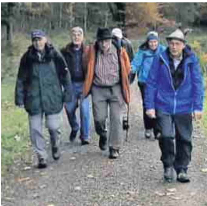
29. Oktober vom Brandenburger Tor zum Manesstein