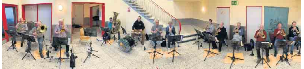
Probe für das Weihnachtskonzert

Langerwehe / Heistern. Die Bovenberger Musikanten halten wie in jedem Jahr ihr Benefiz-Weihnachtskonzert am 15. Dezember ab 19 Uhr in der Alten Schule in Heistern. Die Lokalität hat sich geändert. Es hat sich auf den Musikproben und bei internen Vereinsfesten die voluminöse Akustik im alten ehemaligen Schulgebäude sehr bewährt. Die Musikanten werden ihr allseits bekanntes Weihnachtsrepertoire von alten traditionellen Weihnachtsklängen und auch modernen Weihnachtsliedern aufführen. Zum Mitsingen stehen Liederbücher bereit. Die Proben laufen schon auf Hochtouren. Weitere Überraschungsprogrammpunkte sowie eine Verlosung von Weih-