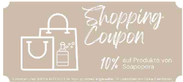
Shopping Coupon Soapopera