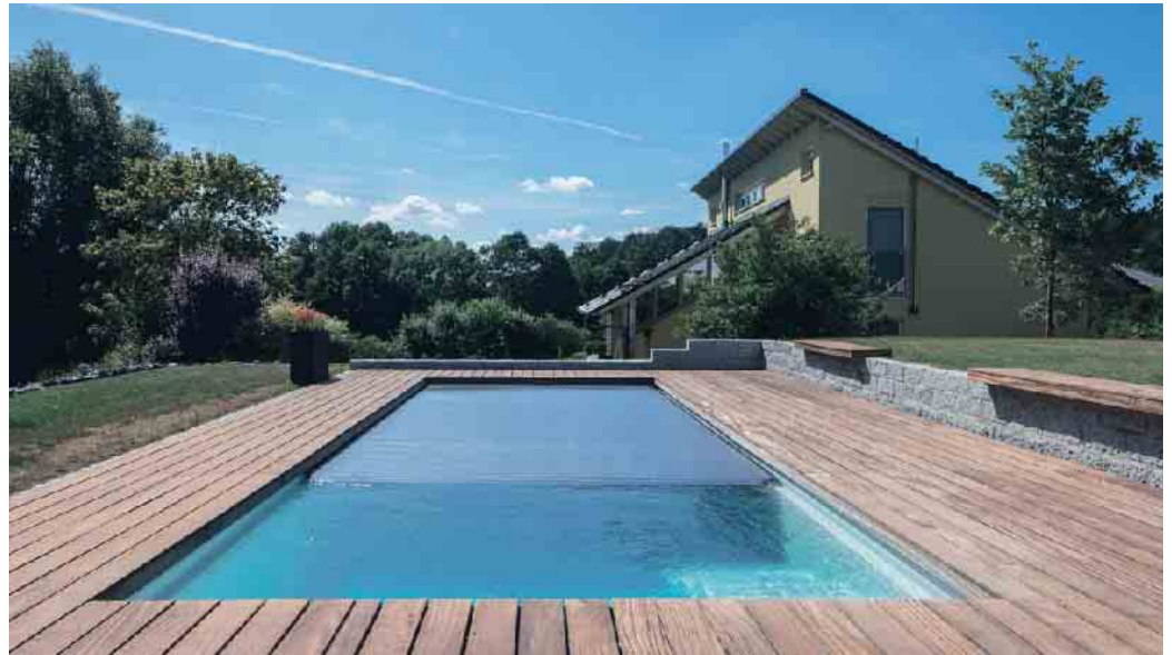
Poolabdeckung in Form eines Rollladens.

Bei einem Pool vom Fachbetrieb mit einer durchdachten Aufbereitungsanlage kann das Wasser mehrere Jahre im Becken bleiben. Filter, Pumpe und Pflegemittel sorgen dafür, dass ein Wasserkreislauf entsteht und das Wasser so gereinigt wird, dass es stets hygienisch einwandfrei ist.