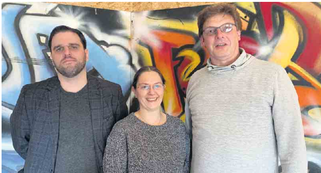
Neuer geschäftsführender Vorstand der JiL

lenweg 50, zu den Öffnungszeiten vorbei - wir freuen uns drauf! Ihr Vorstand Jugend in Langerwehe e.V.