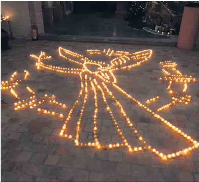
Lichterbild 2022 „Friedensengel“

ne Sprossen und eine weiße Lilie hervorbrachte. Die Kirche wird am Samstag und Sonntag, 2. und 3. Dezember in der Zeit von 10.30 Uhr bis 19 Uhr geöffnet sein. Am Samstagabend laden wir um 18 Uhr alle, insbesondere die Kinder und ihre Familien, herzlich zu einem „Adventsfenster“ am Lichterbild ein. Wir werden diesen Abend mit Geschichten und Liedern adventlich ausklingen lassen und als Zeichen unserer Verbundenheit ein Stehlicht aus dem Lichterbild mit nach Hause nehmen. Mit dem Erwerb eines Stehlichtes unterstützen Sie uns in unserem Bemühen, die Alte Kirche zu erhalten. Für den Verein zur Erhaltung der Alten Kirche: Guido Hänel-Schega