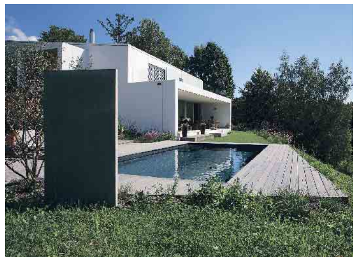
Im Pool vom Profi kann das Wasser über mehrere Jahre bleiben.

Poolexperten, die sich mit nachhaltigem Wasserspaß auskennen, findet man beim bsw unter www.bsw-web.de . (akz-o)