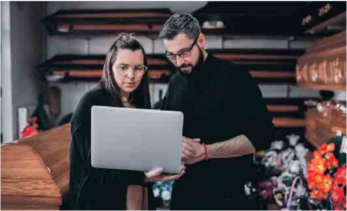
Alles digital bei der Bestattungsplanung? Wie helfen digitale Services bei einer Bestattung - und wann ist der Mensch das bessere Gegenüber?