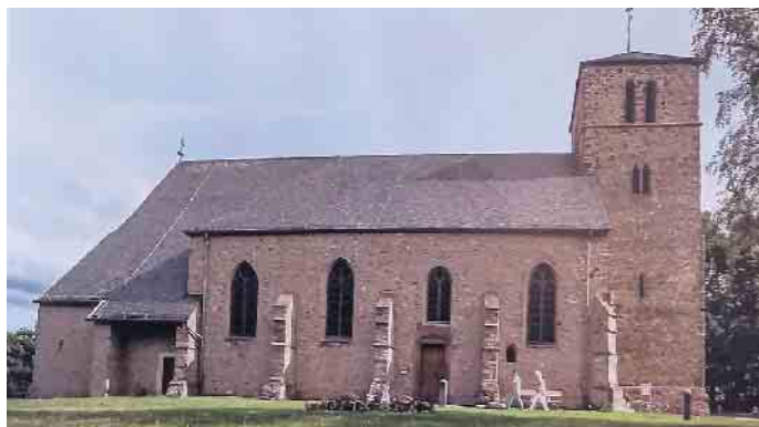
Alte Kirche auf dem Rymelsberg

den 17. Dezember um 17 Uhr, wieder zu einem Weihnachtssingen in die Alte Kirche auf dem Rymelsberg ein.