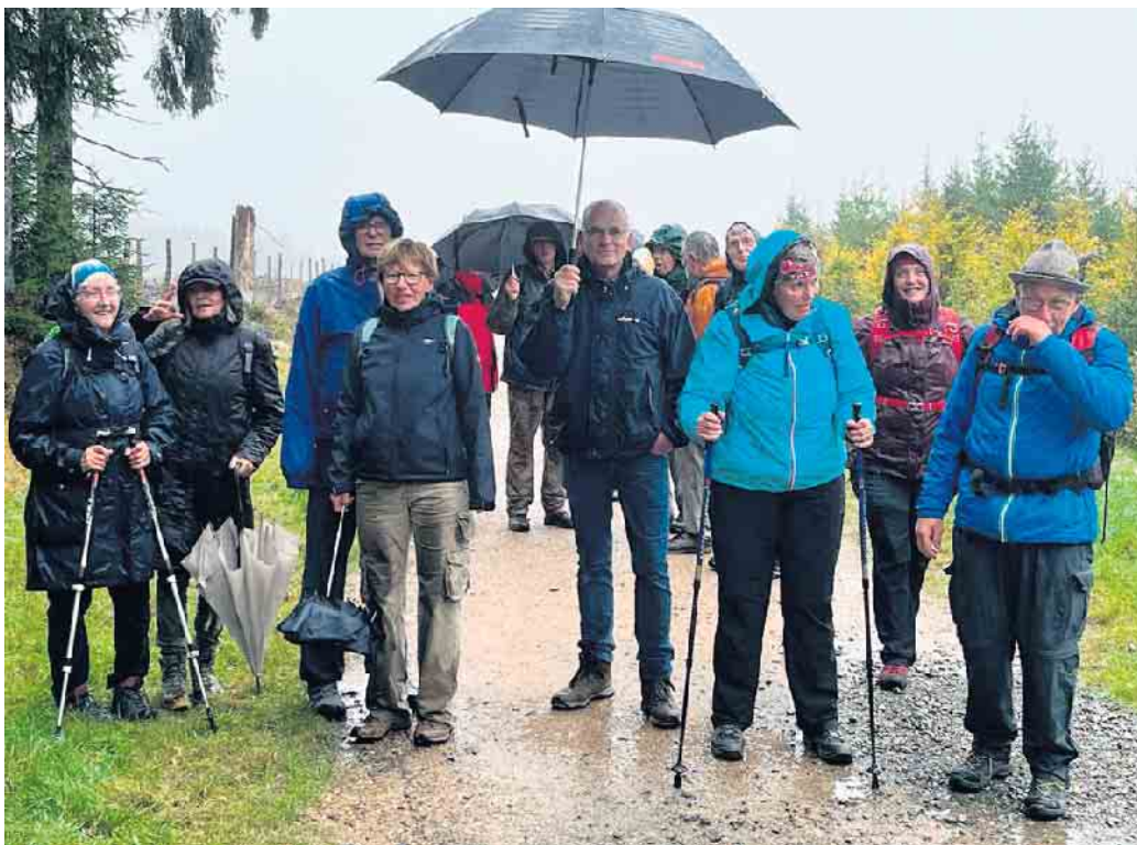
22. Oktober Vennwanderung Baraque Michel