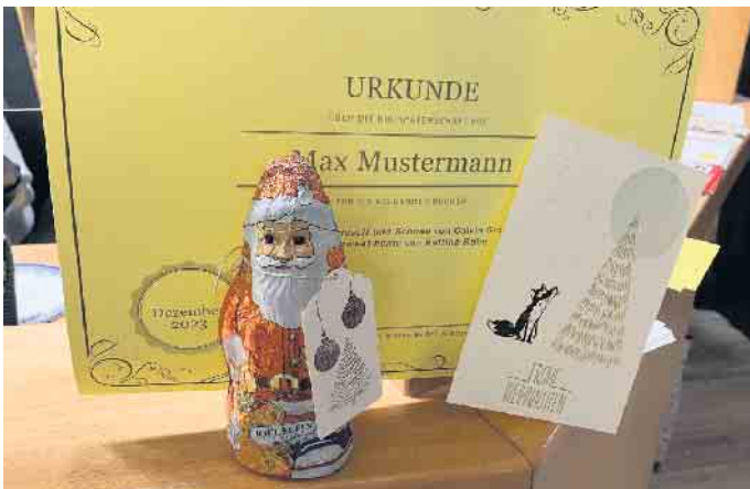
Eine Buchpatenschaft unterstützt die Arbeit der Bücherei und ist ein schönes Geschenk.

haben“. Buchpaten erhalten eine Patenschaftsurkunde. Ein Stempel auf der Innenseite des Einbandes zeigt, dass hier eine Patenschaft die Anschaffung ermöglicht hat. Außerdem werden die Buchpaten auf unserer Buchpatenliste im Internet und in der Bücherei namentlich aufgeführt (freiwillig). Die Patenschaft gilt für ein Jahr ab Buchanschaffung. In diesem Jahr bieten wir zudem ein Weihnachtsgeschenkpaket an. Für 3 Euro zusätzlich zum Spendenbetrag der Buchpatenschaft erhalten Sie neben der Urkunde noch eine Schokofigur mit handgefertigten Geschenkan-