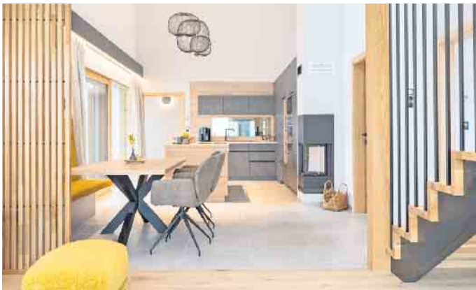
Unterschiedlich zonierte Bereiche und kurze Wege zwischen Küche, Essen und Wohnen unterstützen einen reibungslosen Familienalltag.