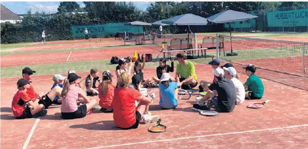
Morgendliche Besprechung des Trainingstages