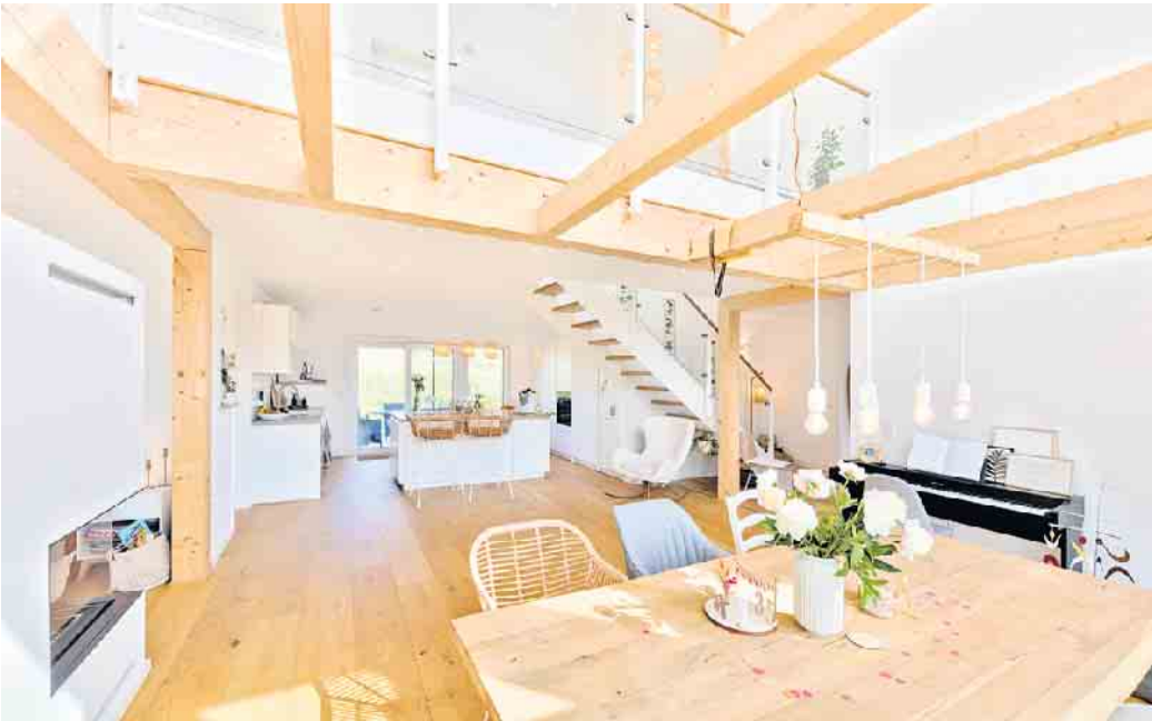
Große Glasflächen und Blickbeziehungen zwischen Küche und Essbereich schaffen hier ein helles und einladendes Raumgefühl.

Beratung - Lieferung - Service + Montage vom Fachbetrieb - Besuchen Sie die Ausstellungen!