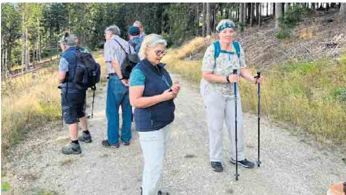
Wanderung am 17. August ins Bibertal

Schmiedestr. Gastwanderer sind herzlich willkommen Zusätzlicher Hinweis: Montag, 22. September bis Samstag, 4. Oktober, findet die Ausflugs- und Wandertour nach Marienbad/Tschechien statt. Anmeldung war erforderlich. Weitere Infos bei Norbert und Nora Merks (02421-490050) der Vorstand, i.V. W.Vrölz