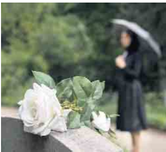
Raum, Erinnerungen lebendig zu halten.

Der September gilt für viele als Übergangsmonat. Mit dem Ende des Sommers und den kürzer werdenden Tagen verändert sich nicht nur die Natur, auch viele Menschen empfinden in dieser Zeit eine besondere Stimmung. Für Trauernde kann diese Phase besonders intensiv sein, da der Herbstanfang Gefühle von Abschied und Vergänglichkeit verstärkt.