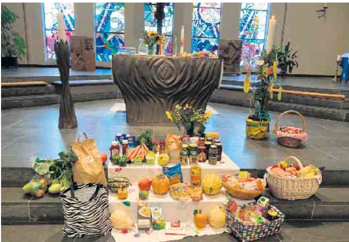
Der Erntedankaltar mit den Lebensmittelspenden.

Lebensmittel als Spende für die Langerweher Tafel gebeten. Alle spüren an den gestiegenen Lebensmittelpreisen, wie wichtig und wertvoll unsere Nahrung ist. Besonders leiden die darunter, die wenig Geld haben. Den Tafeln fehlen die Spendengelder und Lebensmittelspenden, um das ausgleichen zu können. Mit den Lebensmittelspenden im Gottesdienst wird ein kleiner Beitrag zur Unterstützung geleistet und in Erinnerung gehalten, wie wichtig Solidarität im Alltag ist und Menschen stärken kann.