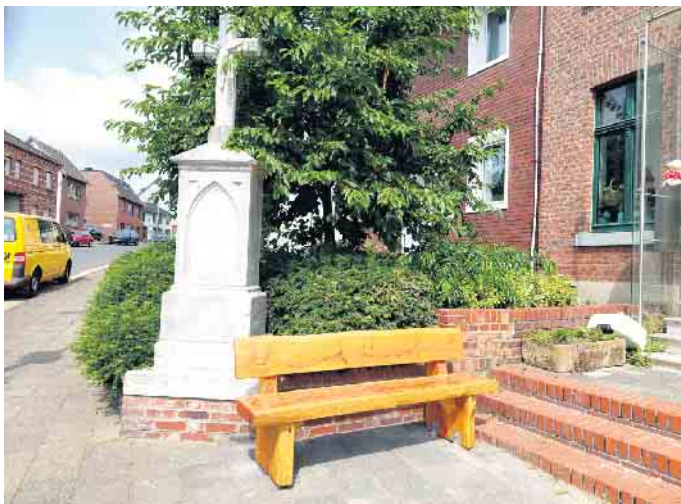
Bank am Uhles (Horst Deselaers)

19 Bänke im Ortsbereich Langerwehe aufgestellt