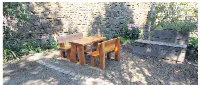
Sitzgarnitur für Kinder im Jakobusgarten (Horst Deselaers)

Über einige Standorte und edlen Spendern von Bänken und Kreuz habe ich berichtet. Im letzten Jahr wurden 6 weitere Holzbänke und ein Tisch gestiftet und aufgestellt. Diese möchte ich kurz vorstellen. Eine morsche Bank am Merbericher Weg wurde gegen eine neue Bank ausgetauscht und von Iris und Timo Löfgen gesponsert. Ein guter Ruheplatz auf dem Weg zur Halde Nierchen. Weiter verwittert war eine Bank an der Überführung in der Bahnhofstraße . Diese wurde durch eine Bank aus Douglasie ersetzt. Die edlen Spender sind Adea - Rund ums Haus bzw. Familie Alagic, die auch noch eine Bank am Uhles vor dem Kreuz am ehem. „Kasteieboom“ gestiftet haben. Beide Ruhebänke werden gerne für eine Verschnaufpause in den Steigungen genutzt.