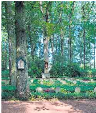
Ehrenfriedhof nach der Instandsetzung

in ehrenamtlicher Weise. Die in die Jahre gekommene Umzäunung des Ehrenfriedhofs musste erneuert werden. Hiermit waren zehn Helfer (teilweise über 80-jährige Mitglieder) vier Tage beschäftigt, diese instandzusetzen und der Ruhestätte wieder zu neuem Glanz zu verhelfen. Eine schweißtreibende und schwere Tätigkeit, dem ein herzlicher Dank gebührt. Danke an alle Helfer.