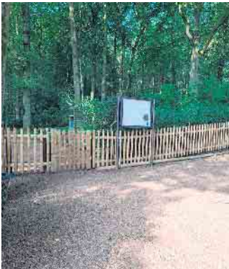
Neuer Zaun am Marienbildchen

In der Gemeinde Langerwehe dürfte der Ehrenfriedhof „Marienbildchen“ im Meroder Wald ein Begriff sein. Hier auf dem Waldfriedhof ruhen insgesamt 228 gefallene deutsche Soldaten, die am Nordrand des einstigen Kampfgebietes Hürtgenwald ihr Leben ließen. Seit 2003 obliegt die Pflege und Instandsetzung dieser Stätte der Ortgruppe Schlich des Eifelvereins