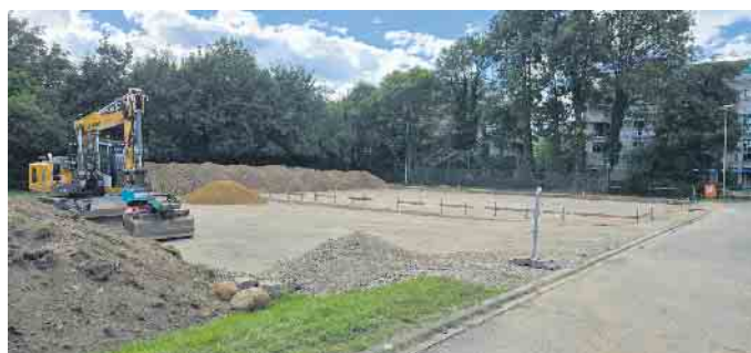
Vorbereitung der Schweinewiese für die neue Flüchtlingsunterkunft, Foto: Timo Löfgen

Nachdem am 14.12.2023 bzw. 6.3.2024 die Errichtung einer Flüchtlingsunterkunft auf einem Teil der Schweinewiese als Lösung zur Unterbringung der noch aufzunehmenden Flüchtlinge im Rat mehrheitlich von den Fraktionen beschlossen wurde, stand erst am 6.6.2024 die Beschlussfassung über die Zulässigkeit eines diesbezüglichen Bürgerbegehrens auf der Tagesordnung des Rates. Dieses Begehren musste wegen formaler Mängel als unzulässig zurückgewiesen werden. Wir