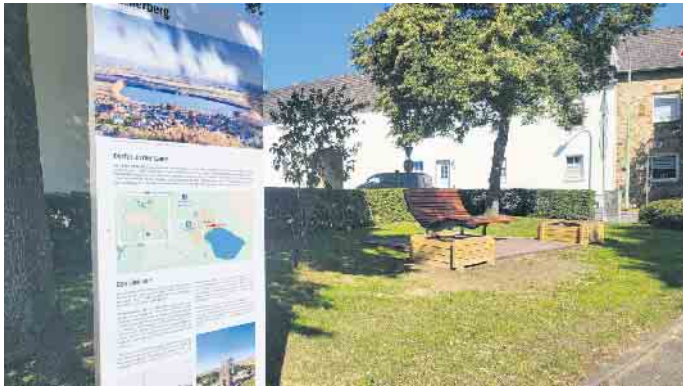
Lucherberg.