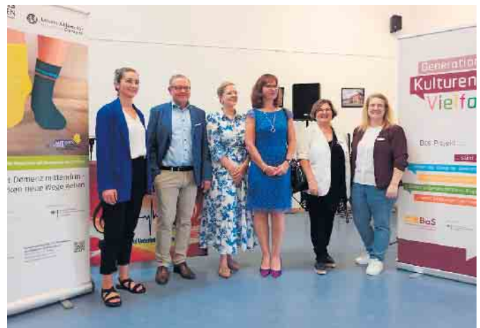
Koordinationsstelle „Pro Seniorinnen und Senioren im Kreis Düren“