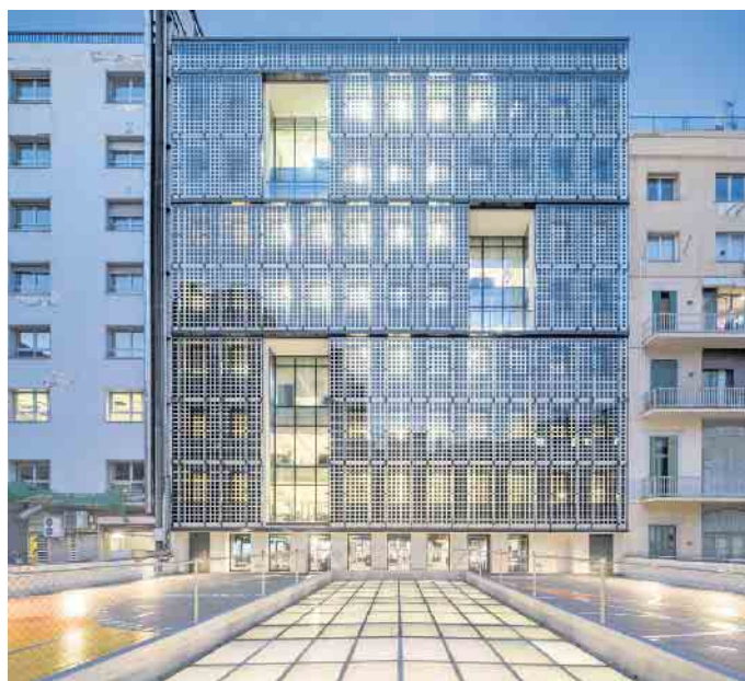
Gut für Klimabilanz und Energieausbeute: Eine vorgehängte BIPV-Lösung an der Fassade einer Gewerbeimmobilie.

Neben den individuellen Pluspunkten für Besitzer und Nutzer im Gebäude bringt die gebäudeintegrierte Photovoltaik wichtige Vorteile für das Stromsystem. Seit Beginn des Jahrtausends wurden Solaranlagen in Deutschland zur Optimierung der gesetzlich festgelegten Einspeisevergütung fast immer in Südausrichtung montiert. Das beschert uns nun regelmäßig eine geballte Ladung Solarstrom am Mittag und frühen Nachmittag, während zu Spitzenzeiten des Stromverbrauchs am frühen Abend der Solarstrom fehlt. Das Problem lindert die BIPV. Denn in den Morgen- und Abendstunden kann die BIPV im Vergleich zu einem su?dorientierten, geneigten PV-Dach für eine bessere Stromausbeute sorgen. Zudem lässt sich im Winter ein höherer Ertrag an der Su?dfassade erzielen. Angesichts des starken Wachstums am Wär-