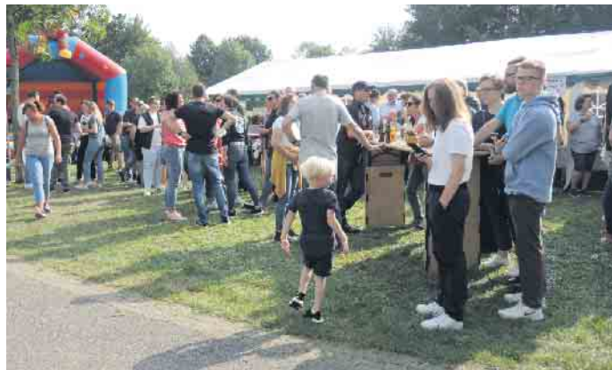
Event für Jung und Alt

diesem Tag wird ebenfalls der Vogelschuss um die Schützenkönigswürde 2024 ausgetragen. Für das leibliche Wohl wird wieder bestens gesorgt sein. Zur Kaffeezeit werden wieder tolle Kuchen und Torten angeboten. Am Grillstand werden verschiedene Salate und Grillgut für Sie bereitgehalten. Für die Kinder haben wir wie immer eine Hüpfburg, verschiedene Aktivitäten sowie einen Sandkasten am Start. Die Schützenbruderschaft freut sich auf Ihr