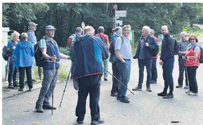
30.07. Obermaubach - Zerkall