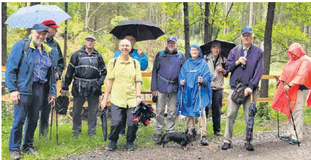
23.07. Petergensfehl, Roetgen