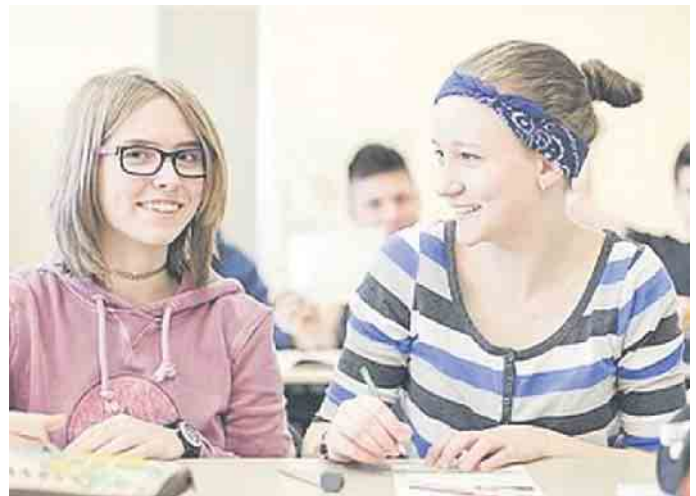
Egal ob schulische oder duale Ausbildung - Unterricht im Klassenzimmer gehört dazu.