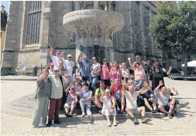
Die „Bovis“ vor der St. Georgs Kirche in Nördlingen