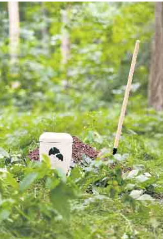
Waldbegräbnis in ihr Angebot aufnehmen. So funktioniert der virtuelle Spaziergang

Eine Online-Suche in einem Bestattungswald vermittelt durch digitale Aufnahmen einen Eindruck des Baumes und zeigt neben Größe und Wuchsform auch seine genaue Lage an. So erfährt man beispielsweise, wie weit der Grabplatz vom Parkplatz entfernt ist. Hilfreich ist es auch, wenn virtuelle Panoramatouren der näheren Umgebung angeschaut werden können. Dadurch lernt man deren Schönheiten und Besonderheiten als Ort der letzten Ruhe kennen. Für eine Urnenbestattung im Wald gibt es unterschiedliche Gräber an verschiedenen Baumarten. Je nach Wunsch sucht man einen oder mehrere Einzelplätze an einem gemeinschaftlich genutzten