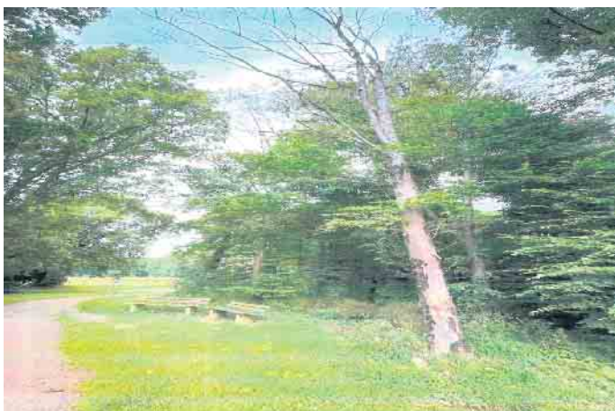
Rußrindenkrankheit am Rymelsberg