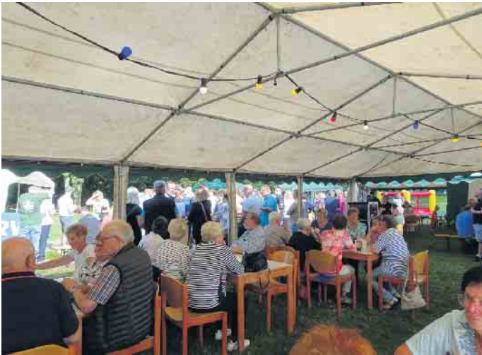
Event für Jung und Alt

ausgeschossen. Es winken attraktive Geldpreise in allen Wettbewerben! Für die Kinder ist ebenfalls gesorgt. Sie können sich im Sandkasten und auf den Hüpfburgen vergnügen. Höhepunkt ist das Schießen um die Königswürde 2025. Weiterhin werden die Schießen um die Schülerprinzen- (12 bis 16 Jahre) und Jungschützenprin-