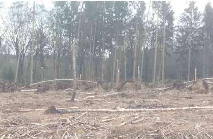
Laufenburg Wald am 17. Februar 2020

Bild davon machen oder Antworten auf ihre Fragen bekommen, was wo und warum zur Erhaltung, Stärkung und Erneuerung des Waldes getan werden muss bzw. Schon umgesetzt wurde. Wir treffen uns am Samstag, 24. August, um 10 Uhr, am Parkplatz „Drei Eichen“ L25.