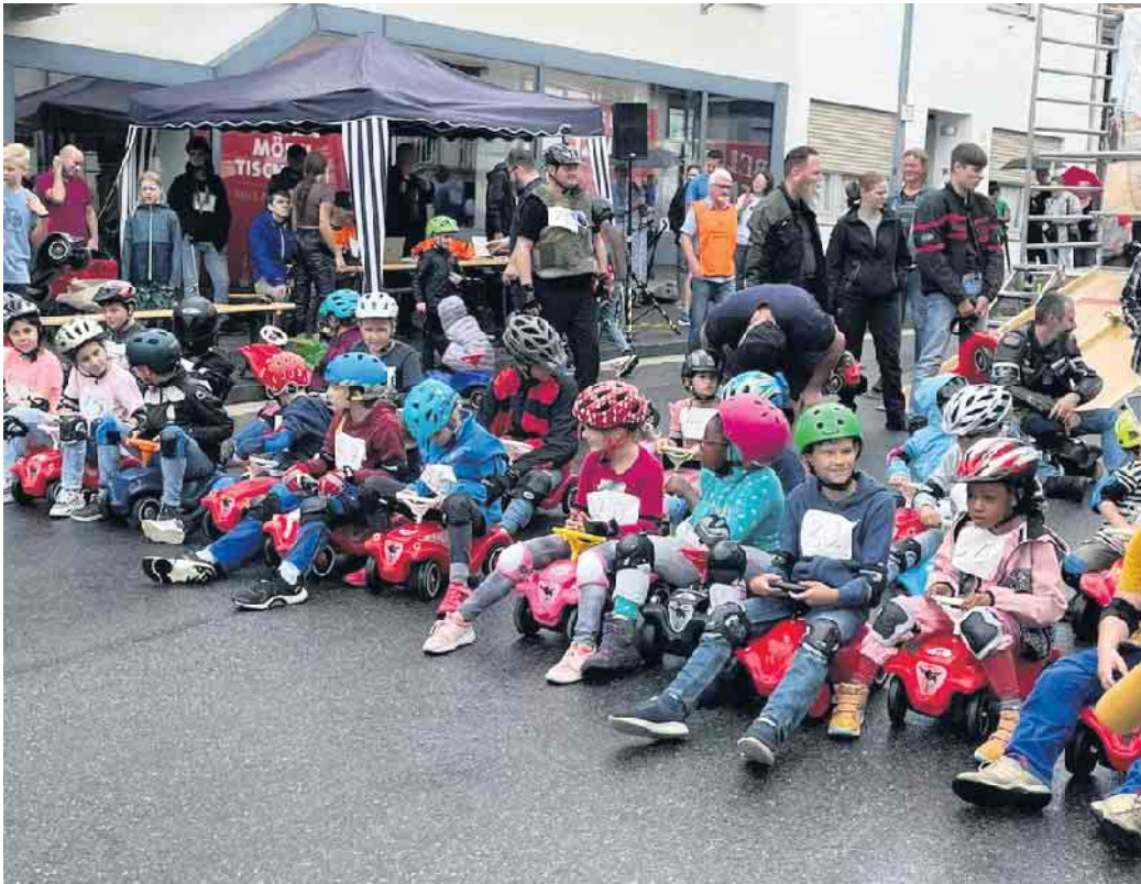
Alle warten auf den Startbeginn