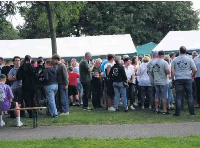
Gute Laune bei kühlen Getränken

Am 7. September ist es wieder soweit. Die Schützenbruderschaft veranstaltet ihr 15. Schieß-Event auf dem Driesch ab 14 Uhr mit dem Ausschießen von Bürgerpreisen. Es werden Preise in den Kategorien Junioren (14 bis 23 Jahre); Senioren (24 bis 99 Jahre), Mannschaften (je vier Personen) und Supercup (Pokal der Sieger)