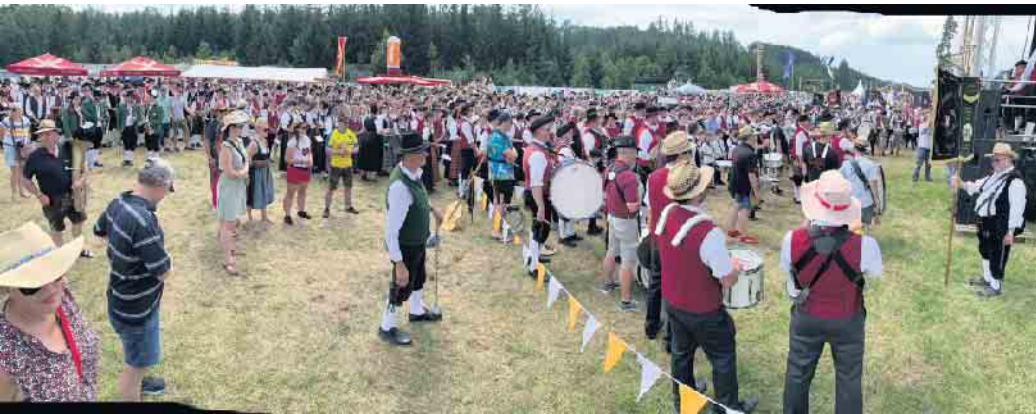
1.500 Freunde der Blasmusik musizieren gemeinsam