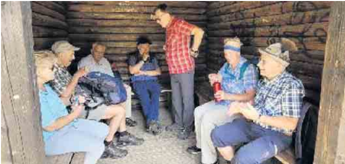
21. Juli: Rund um die Kalltalsperre