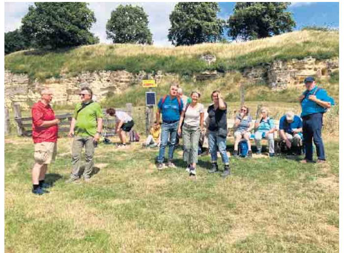
rund ums Kasteel Limburg am 16. Juli