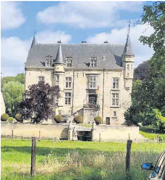
Kasteel Limburg am 16. Juli