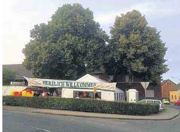
Der Marktplatz in Lucherberg