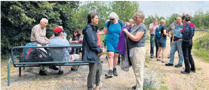
durch den Morschenicher Wald am 02. Juli

ten, 12 km lbW, WF: Evi und Heinz-Peter Esser Gastwanderer sind herzlich willkommen. Treffpunkt zu den Wanderungen: Schützenplatz in Schlich, Schmiedestr. der Vorstand, i.V. W.Vrölz