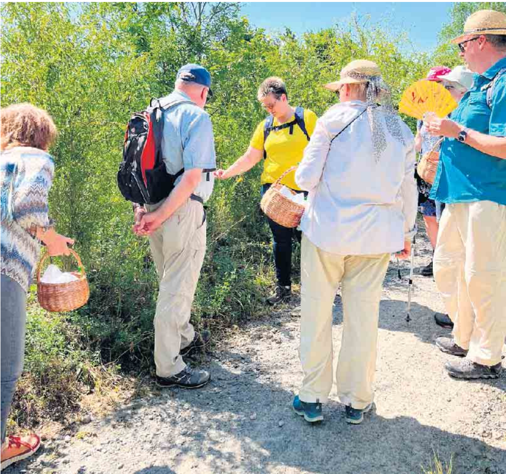
Kräuterwanderung mit der Kräuterhexe am 25. Juni