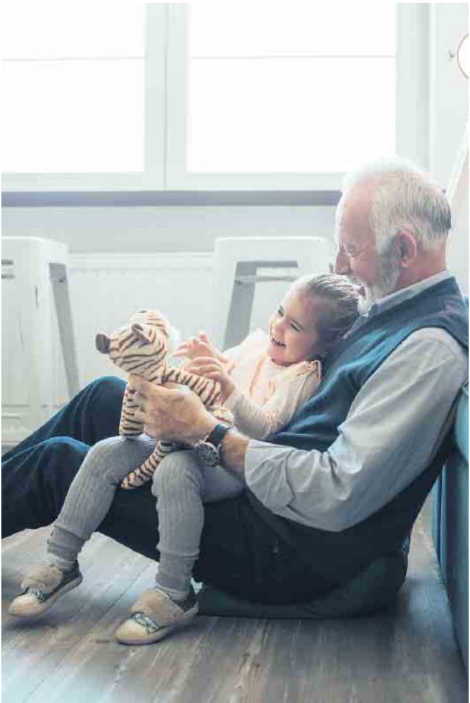
Die Gesellschaft wird immer individueller, das schlägt sich auch in den neuen Formen der Bestattungskultur nieder.

tenden Corona-Bestimmungen können sich Interessierte auch ein Bild von der Manufaktur in der Schweiz machen. (djd)