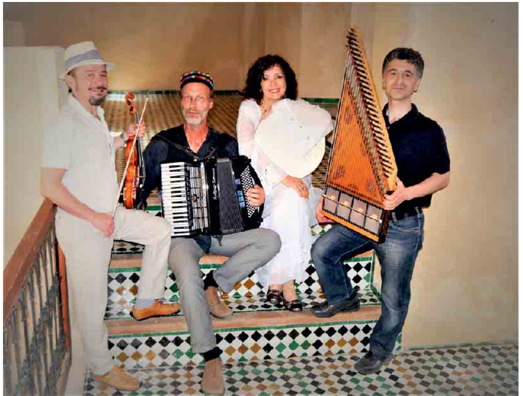
Kol Colé.

Die Konzerte des Ensembles Kol Colé führen die Fantasie der Zuhörer in verschiedene, versteckte Ecken der Welt und in vergangene Zeiten, ins jüdische Shtetl, in die ländliche Ukraine und ins mittelalterliche Andalusien. Das Programm drückt die ständige Suche der Musiker aus, mit ihrer Musik in dem Spannungsfeld zwischen jüdischen, muslimischen und christlichen Elementen ein harmonisches Miteinander zu finden.