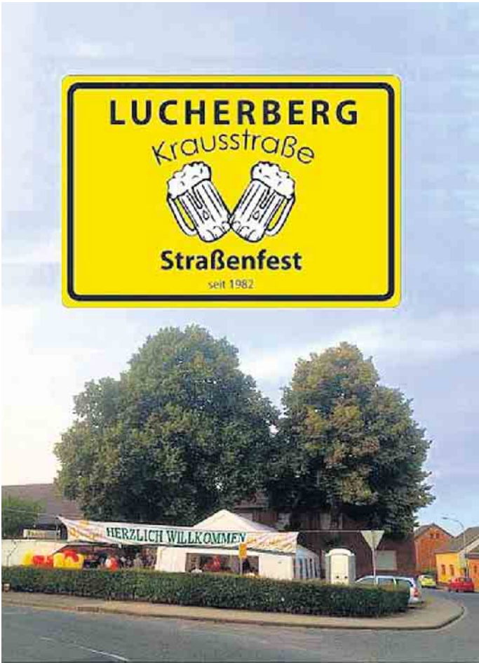
Der Marktplatz in Lucherberg

gewohnt zur Verfügung. Wie bereits in den letzten Jahren bieten wir unseren älteren Besuchern und Gäste in allen Angelegenheiten eine besondere Unterstützung an. Für unsere kleineren Gäste steht eine Hüpfburg zu Verfügung. Wir würden uns freuen, zahlreiche Gäste, zu sehr zivilen Preisen begrüßen und verwöhnen zu dürfen. Wenn jetzt noch genügend Hunger und Durst mitgebracht werden, steht einem wunderschönen Straßenfest am 12. bis 13. August auf dem Marktplatz in Lucherberg nichts mehr im Wege. Einladungsflyer werden eine Woche vor unserem Straßenfest in jedem Haushalt in Lucherberg verteilt. Die „Krausis“