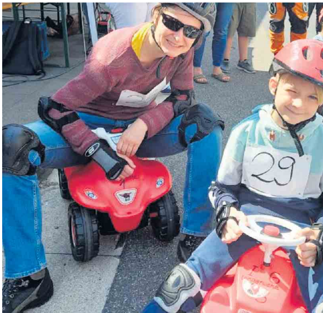
Zwei der 58 Teilnehmer 2022