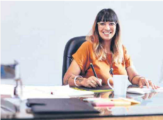
Eine Umschulung in einen anderen Beruf bringt Chancen, aber auch Herausforderungen mit sich.

halten beim Institut für Berufliche Bildung (IBB) beispielsweise ab dem nächsten Kursstart alle Umschülerinnen und Umschüler sozialpädagogische Begleitung. Workshops zu Themen wie Selbst- und Zeitmanagement, Gruppenarbeit und Gruppendynamik, Work-Life-Balance und Zukunftsplanung stehen fest auf dem Stundenplan. Erfahrene Mitarbeiter unterstützen außerdem in individuellen Gesprächen bei Bedarf dabei, beispielsweise Motivationstiefs zu überwinden oder Prüfungsängste zu bewältigen. „Manchmal geraten Teilnehmer auch während der Umschulung in eine persönliche Krise, etwa durch eine Trennung vom Partner, eine Erkrankung oder finanzielle Probleme. In solchen