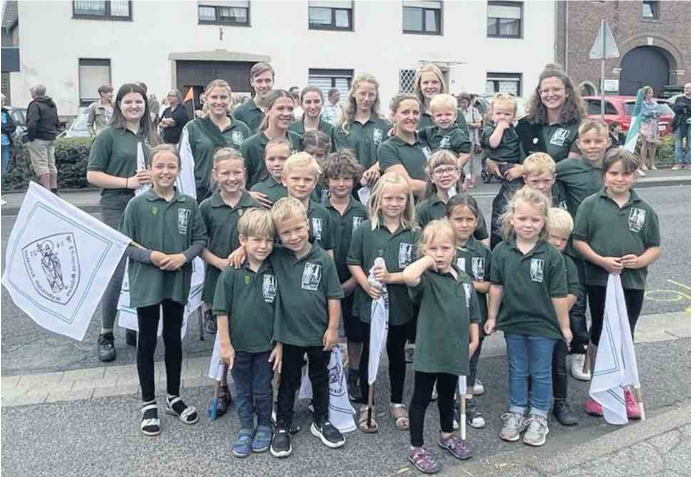
Die Lamersdorfer Jungschützen beim Jubiläumsschützenfest

Lamersdorf. Mit Stolz und Zufriedenheit blicken die Lamersdorfer St. Cornelius Schützen auf ihr Jubiläums- und Kreisschützenfest zurück. Die jahrelange Vorbereitung hat sich ausgezahlt, denn alle Veranstaltungen waren sehr gut besucht. Begonnen hat das Jubiläum zum