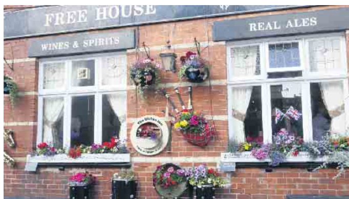
Exmouth in Bloom

entlang zum Badeort Teignmouth, der aber Exmouth trotz schöner Ecken nicht das Wasser reichen kann. Neben den bekannten Sehenswürdigkeiten war in unserer Partnerstadt Neues und Buntes hinzugekommen. Auf dem Dinosaur Trail tauchten etliche Urzeitriesen in Beeten auf. Der Mail Trail überraschte mit roten Briefkästen, denen man liebevoll gehäkelte Figuren zum Thema „Meer“ aufgesetzt hatte. Eine ehrenamtliche Benefizaktion für das lokale Hospiz. Und überall fantasievoller Blumenschmuck: Exmouth in Bloom! Einziger Wermutstropfen eines schönen Besuchs war die lange