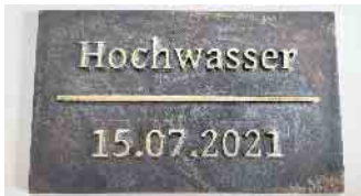
Hochwassermarke des WVER

Der Wasserverband Eifel-Rur hat Hochwassermarken anfertigen lassen. Diese können von Betroffenen aus dem gesamten Verbandsgebiet (Einzugsgebiet der Rur in Deutschland) beantragt werden.