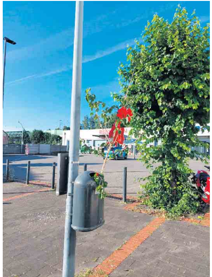
Vandalismus an Bäumen

Liebe Mitbürger*innen, in der letzten Zeit werden leider immer wieder Fälle von Vandalismus an mich herangetragen. In einigen Ortsteilen wurden die Köpfe von „StreetBuddys“ abgebrochen und nun wurden bereits zum zweiten Mal die Kronen von neu gepflanzten Bäumen mutwillig abgerissen, so dass die Bäume leider absterben werden. Dies ist auf dem Gelände des Kindergartens Pier und an der Hauptstraße gegenüber dem Töpferbrunnen passiert. Die Taten sind nicht nur absolut sinnlos und lösen starken Frust aus, sondern es sind auch strafbare Handlungen. Die Versuche, unseren Ort lebenswerter zu machen mit Maßnahmen zur Verbesserung der Sicherheit im Straßenverkehr und zur Begrünung des Ortes, werden hiermit zunichte gemacht.