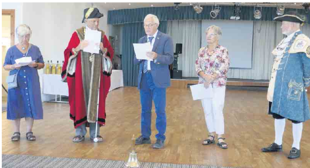
Beim Austausch der Grußworte

An einem anderen Tag fuhr uns der Zug an der malerischen Küste