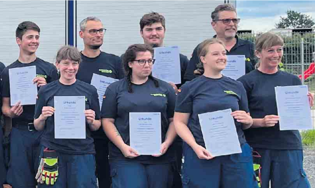
Unsere neuen einsatzfähigen Helferinnen und Helfer

Männer und Frauen in unserer Grundausbildungsgruppe gleichstark (nicht nur zahlenmäßig)