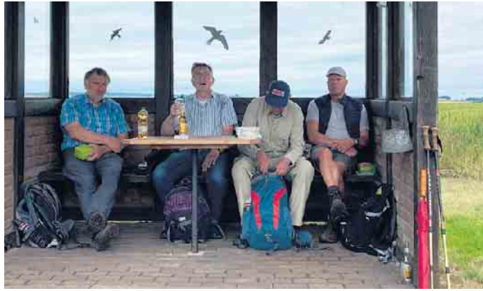
15. Juni Braugerstenweg in Vlaten