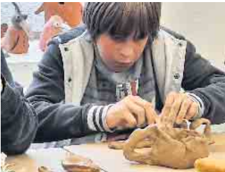
Spaß für große und kleine Kinder