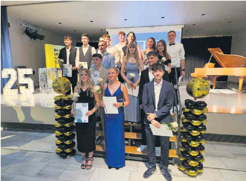
FOS Abschluss 2025

Der Bildungsgang „Fachoberschule Polizei“ richtet sich an Jugendliche mit Realschulabschluss und bietet einen gezielten Einstieg in die Polizeilaufbahn in Nordrhein-Westfalen. Über zwei Jahre hinweg verbinden die Schülerinnen und Schüler schulische und praktische Inhalte: Während sie am Berufskolleg unter anderem in Deutsch, Englisch, Mathematik sowie in Recht und Staatslehre unterrichtet werden, absolvieren sie umfassende Praktika bei der Polizei. Dabei begleiten sie Streifenteams bei Einsätzen, unterstützen Ermittlungen in Kriminal- und Verkehrskommissariaten und