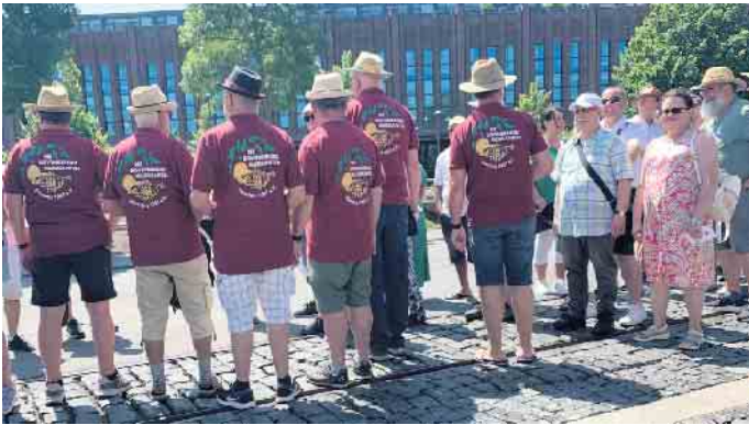
Warten vor dem Einlass