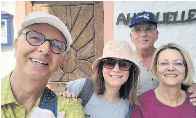
22. Juni Tageswanderung wo die Ahr entspringt

Treffpunkt zu den Wanderungen: Schützenplatz in Schlich, Schmiedestr. Gastwanderer sind herzlich willkommen der Vorstand, i.A. W.Vrölz