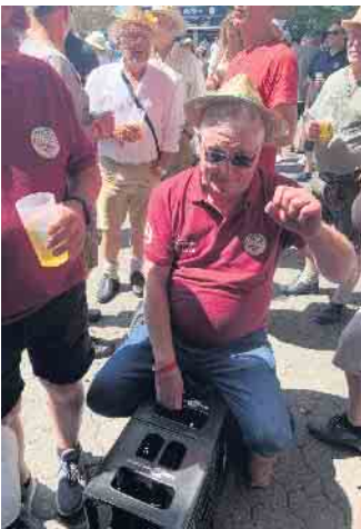
Die sengende Hitze machte uns nichts aus.

tags von 18 bis 20 Uhr in der alten Schule in Heistern. Mehr Infos auch unter: https://www.bovenbergermusikanten.de