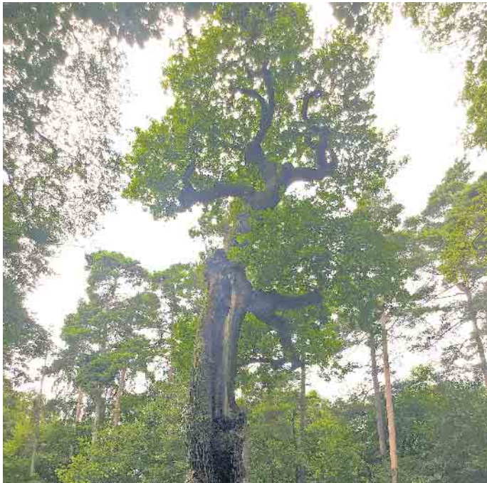
Bereits geschädigte Bäume können mit biologischen Vitalkuren neue Lebenskraft gewinnen und noch lange durch ihre Schönheit erfreuen.

Vitale Kraft spendet die Behandlung aber nicht nur älteren Pflanzen, als Anwachshilfe bei Neuanpflanzungen oder Umpflanzungen leistet sie ebenfalls gute Dienste. Sie gibt Gehölzen optimale Startbedingungen und trägt so dazu bei, dass sich auch folgende Generationen an kräftigen, gesunden Bäumen erfreuen und von ihrem volkswirtschaftlichen Wert profitieren können. Und den taxiert der NABU für die 100-jährige Eiche auf mehr als 250.000 Euro - zum Beispiel für die Erhaltung der Bodenfruchtbarkeit, die Stabilisierung des Wasserhaushalts oder Schutzfunktionen gegen Wind, Lärm, Hitze oder Erosion. Die Bäume tun also einiges für uns Menschen - Zeit, dass wir ihnen etwas zurückgeben. (djd)