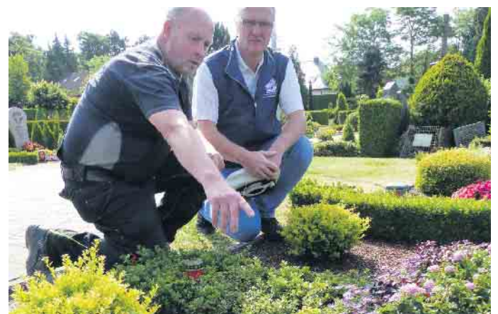
Während der Begutachtung tauschen sich Grabkontrolleur und Friedhofsgärtner u.a. intensiv über neueste Pflanzentrends und Lösungen beim Schädlingsbefall aus.