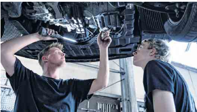
Beim Klimaanlagen-Check prüft der Kfz-Mechaniker alle Teile der Anlage und ihre Funktionen.

Der Zentralverband Deutsches Kfz-Gewerbe weist auf Probleme hin, die durch eine mangelhafte Wartung entstehen können. Ein niedriger Stand des Kältemittels etwa kann die Leistung beeinträchtigen und zu Schäden am Kompressor der Klima-