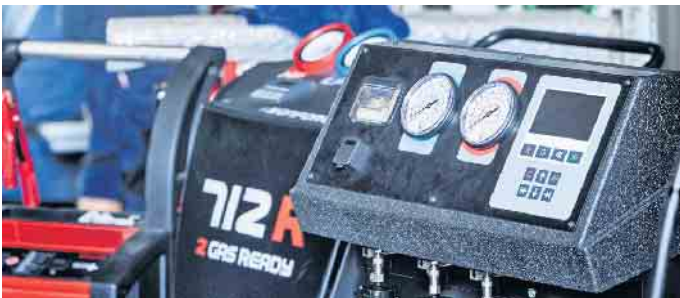
Mechaniker mit Sachkundenachweis für die Klimaanlagenwartung und professionelle Klimatestgeräte stellen sicher, dass bei der Überprüfung der Fahrzeugklimatisierung nichts übersehen wird.

zu lassen, statt sofort loszufahren. Um zu Fahrtbeginn eine schnelle Abkühlung zu erzielen, ist die Umlufteinstellung gut geeignet. So wird nicht stetig warme Luft von außen zugeführt. Nach spätestens fünf Minuten sollte man jedoch auf Normalbetrieb umstellen, da sonst der Sauerstoffgehalt im Fahrzeuginnenraum sinkt. Die Fenster zu öffnen, mag angenehm sein, doch dabei sorgt die warme Außenluftzufuhr ebenfalls dafür, dass die Klimaanlage mehr als nötig arbeiten muss. Auch eine zu starke Abkühlung ist zu vermeiden. Experten empfehlen Außentemperatur minus sechs Grad sowie nicht unter 21 oder 22 Grad, da zu niedrige Temperaturen den Kreislauf belasten und Erkältungen nach sich ziehen können. Als Vorbeugung gegen Gerüche sollte die Klimatisierung zudem ein paar Minuten vor Fahrtende ausgeschaltet werden. So kann Kondenswasser verdunsten und der Gefahr der Ansiedlung von geruchsbildenden oder allergenen Keimen wird vorgebeugt. (DJD)