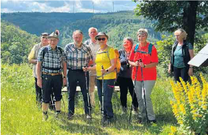
Wanderung am 23. Juni zur Mestrenger Mühle