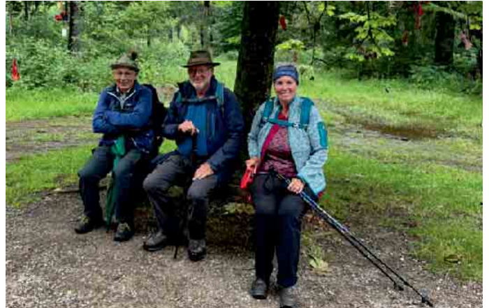
30. Juni: Komm mit Wanderung Raffelsbrand

PKW, Halbtageswanderung Ob-ermaubach - Untermaubach, 7 Kilometer lbW, WF: Toni und