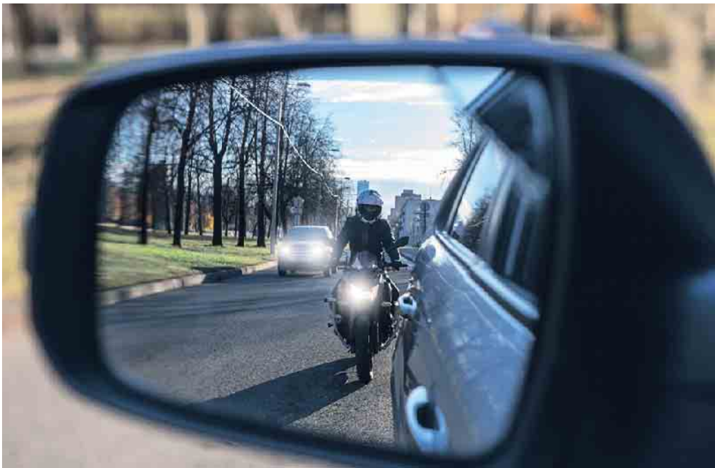
An Motorrädern muss tagsüber stets das Licht eingeschaltet sein, um es im Straßenverkehr besser sichtbar zu machen.

Gut gesehen zu werden, hilft bei der sicheren Teilnahme am Straßenverkehr. Das gilt auch im Sommer, selbst wenn dieser viel Sonnenschein und lange Tageslichtphasen bietet. Denn zum Beispiel ungünstiger Sonnenstand (Gegenlicht), Regen, Nebel und andere Phänomene können die Wahrnehmung von Autofahrern und anderen Verkehrsteilnehmern auch im Hellen beeinträchtigen. Besonders in solchen Situationen hilft es, wenn Fußgänger und andere Fahrzeuge durch starke Farben, hohe Kontraste oder Licht besser wahrzunehmen sind. Seit Februar 2011 müssen alle neuen Personenwagen, die in Deutschland zugelassen werden, mit Tagfahrlicht ausgestattet sein. Für Lastwagen gilt diese Re-