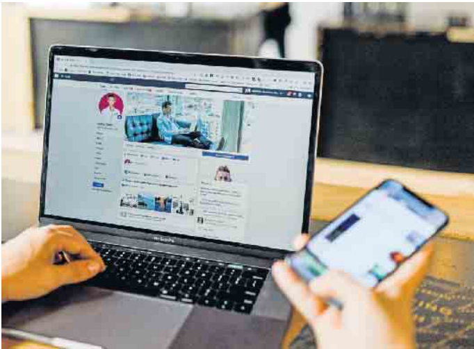
In der virtuellen Welt überzeugen: Stellensuchende sollten ihre Onlineprofile regelmäßig überprüfen und stets aktuell halten.

auch hier sollten Bewerber seriös auftreten. Bilder, Beiträge, Kommentare und alles, was dem eigenen Ruf schaden könnte, sollte man tunlichst löschen - selbst wenn es sich buchstäblich um Jugendsünden handelt. Auf Facebook zum Beispiel kann man einschränken, wer einen auf Fotos markieren darf. Dadurch lassen sich unangenehme Überraschungen vermeiden. Unter adeccogroup.de etwa gibt es viele weitere Tipps für das digitale Eigenmarketing und die Jobsuche. Noch ein Tipp, der auf alle sozialen Plattformen zutrifft: Ein systematisches Aufräumen der eigenen Kontaktliste schafft Klarheit und sorgt dafür, dass man selbst relevantere Beiträge angezeigt bekommt. (djd)