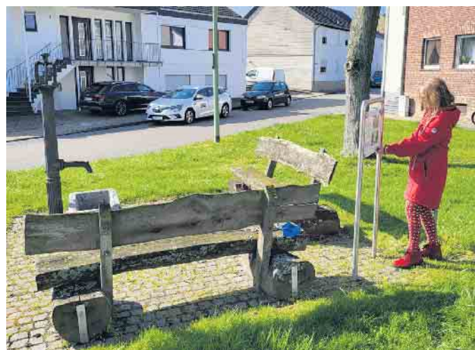
Die neue Info-Tafel gibt Auskunft über die Dorfgeschichte.