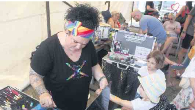
An diesem Tag lockten zahlreiche Highlights wie das Kinderschminken, wo sich nicht selten sogar eine lange Schlange zum Anstellen bildete.