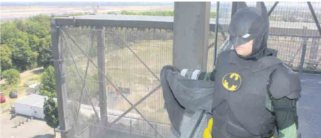
Batman erhaschte aus luftiger Höhe einen Blick auf das Veranstaltungs­ge­lände.