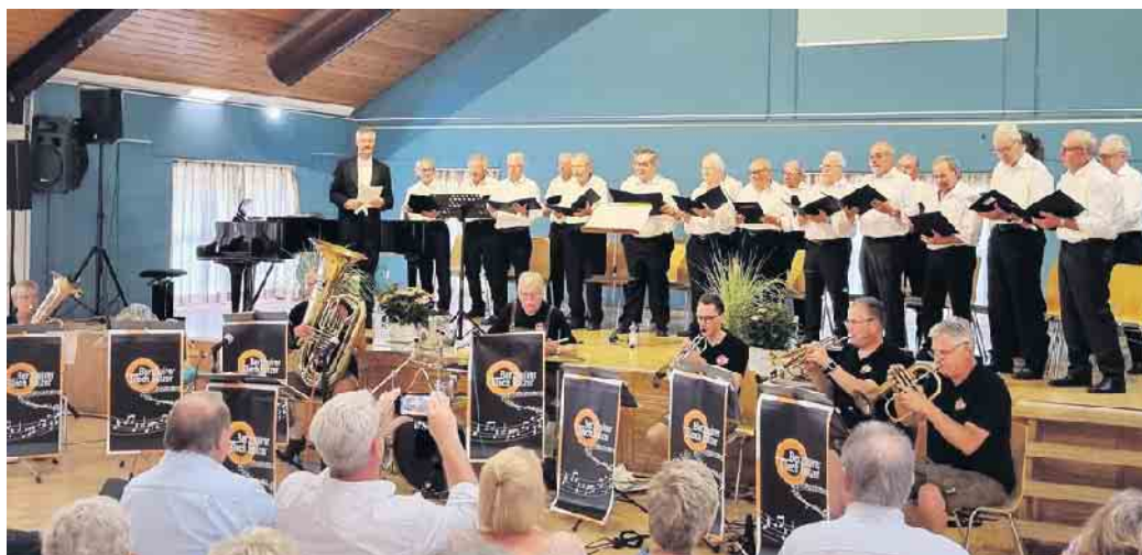
Finale Berzbuirer Blech Bläser und MGv 1863 Altdorf e.V.