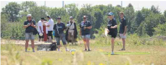
Impression vom laufenden Spielbetrieb beim Charity Cup