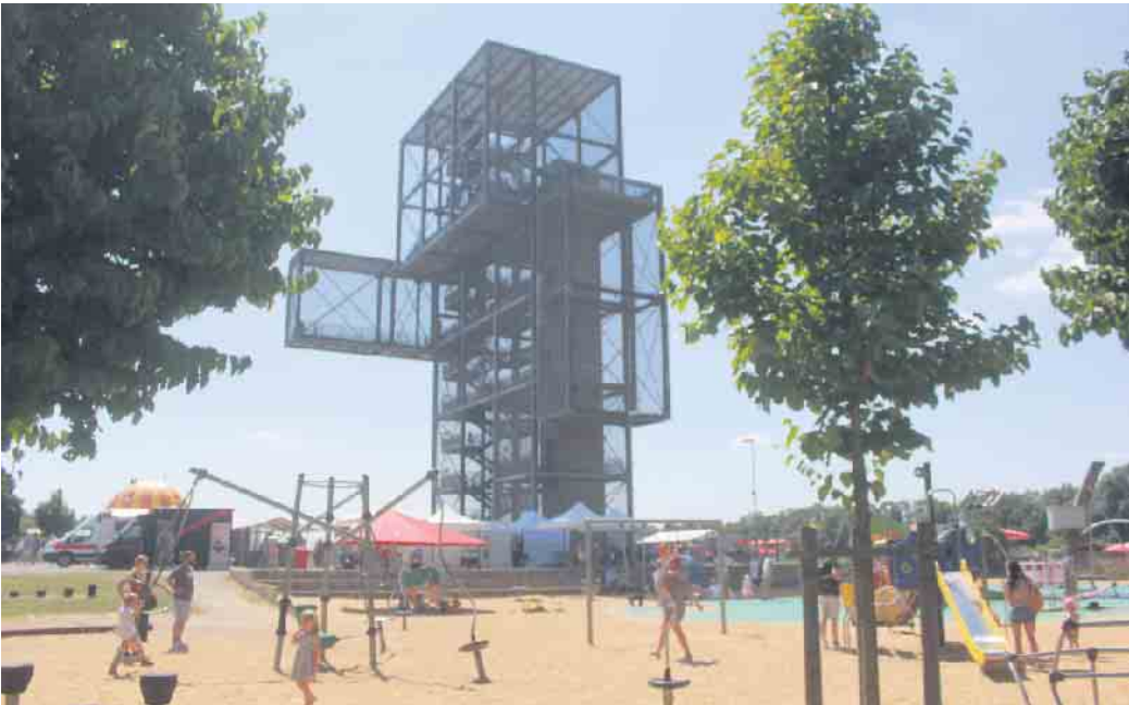
Am 25. Juni veranstalteten die Gemeinde Inden und ihre Pächter einen Familientag am Indemann mit Musik und vielen tollen Attraktionen für Jung und Alt.