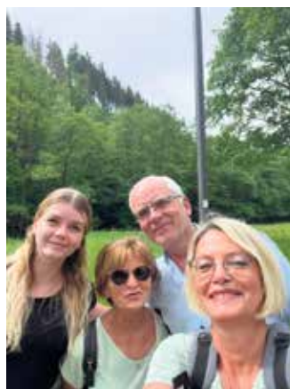
Eifelblick in Einruhr

Gastwanderer sind herzlich willkommen der Vorstand, i.V. W.Vrölz