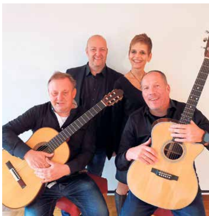
Die Gruppe „BriSamt“ gastiert im Töpfereimuseum