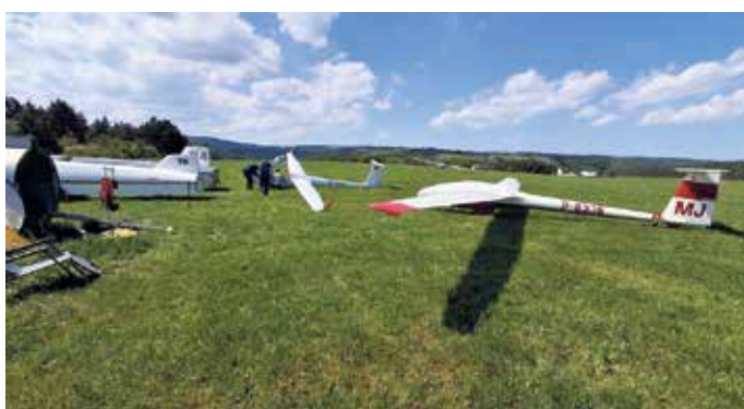
Am Segelflugplatz in Bergstein