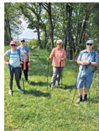
Rund um Bergstein