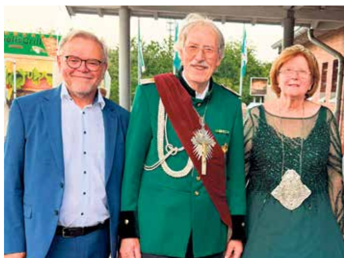
Kaiserpaar Dick mit Ortsvorsteher