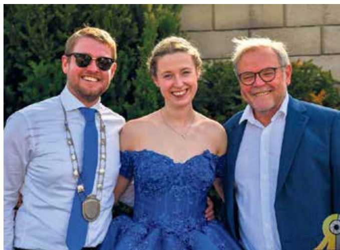
Maikönigspaar mit Ortsvorsteher