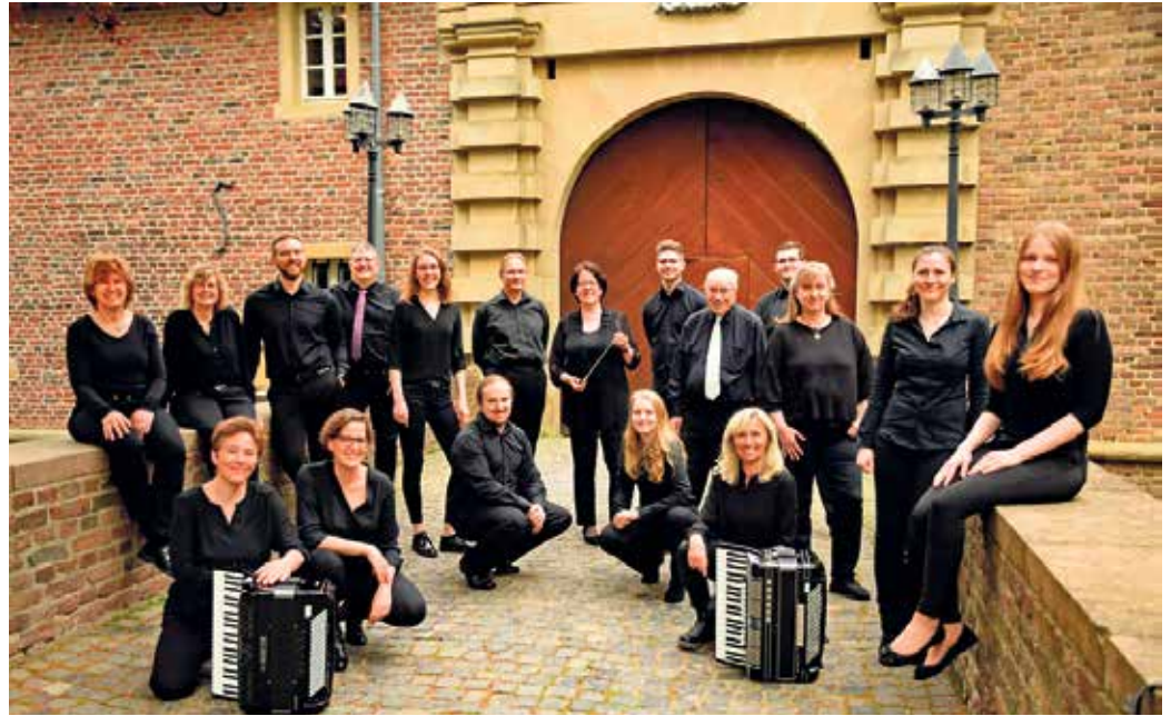
1. Dürener Akkordeonorchester