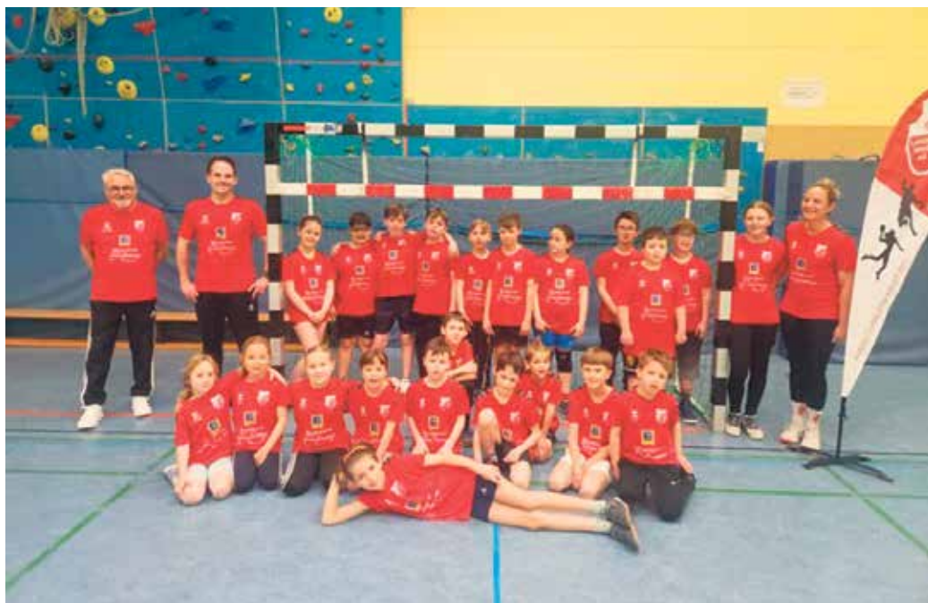
Ostercamp 2026.

Ein Camp dieser Größe funktioniert nur mit einem starken Team im Hintergrund.