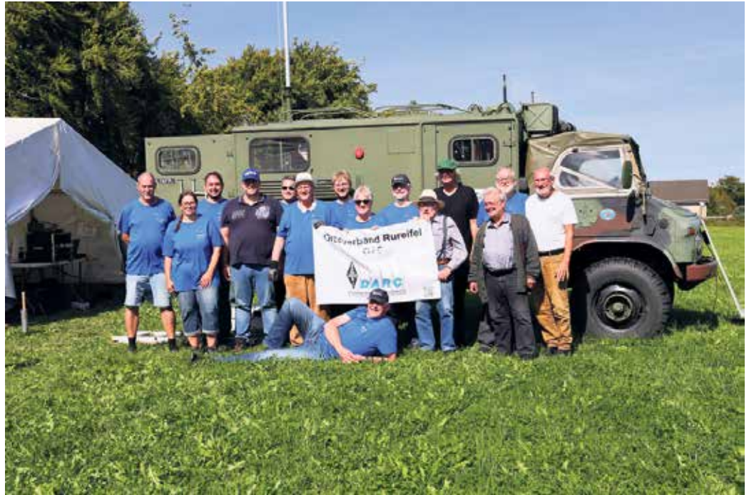
Völkerverständigung per Funkkontakt ist unser gesetzlicher Auftrag.

Die Nachrichten sind voll mit Ereignissen, wo der Frieden gefährdet oder zerstört ist. Höchste Zeit also, sich zu erinnern, dass vor über 100 Jahren die Funkamateure ein Zeichen der Völkerverständigung gesetzt haben und sich in der IARU, der International Amateur Radio Union, zusammengeschlossen haben. Funkamateure entdeckten als erste Anfang des 20. Jahrhunderts, dass die Kurzwellen weltweite Kommunikation ermöglichen konnten. Im Wettlauf um die Nutzung dieser kürzeren Wellenlängen drohte dem Amateurfunk eine Verdrängung durch kommerzielle Dienste. Nur zwei Jahre nach der Gründung der IARU erhielt der Amateurfunk auf der International Radiotelegraph Conference (IRC) die noch heute anerkannten Frequenzzuteilungen von 160, 80, 40, 20 und 10 Metern. Seit ihrer Gründung hat die IARU unermüdlich daran gearbeitet, die Frequenzzuteilungen für den Amateurfunk zu verteidigen und zu erweitern. Von den 25 Ländern, die die IARU 1925 gründeten, ist die IARU auf 160 Mitgliedsgesellschaften in drei Regionen angewachsen. IARU-Region 1 umfasst Europa, Afrika, den Nahen Osten und Nordasien. Region 2 deckt Amerika ab und Region 3 besteht aus Australien, Neuseeland, den pazifischen Inselstaaten und dem größten Teil Asiens. Die Internationale Fernmeldeunion (ITU) hat die IARU als Interessenvertretung des Amateurfunks anerkannt. Der DARC e.V. ist der größte Verband von Funkamateuren in Deutschland und die drittgrößte Amateurfunkvereinigung weltweit. Mit über 31.000