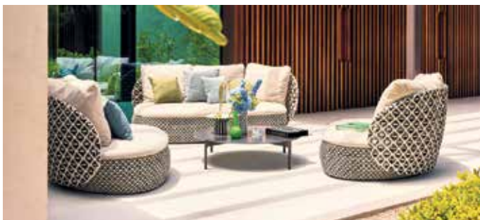
Viel Flexibilität: Das modulare, organisch geformte Loungemöbel besteht aus verschiedenen Modulen, die sowohl für sich alleine stehen als auch zu größeren Sitzlandschaften verbunden werden können.

system. Bei den Materialien reicht die Auswahl etwa von gebürstetem Edelstahl über recyceltes Teakholz bis hin zu Keramik, Naturstein und modernen Verbundwerkstoffen. Verband der Deutschen Möbelindustrie e.V. Bad Honnef