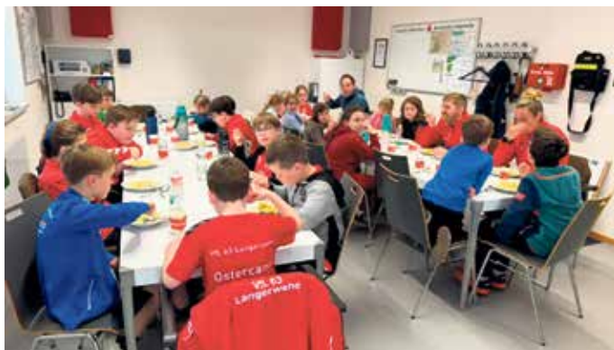
Mittagsessen beim Ostercamp

ANZEIGEN · PROSPEKTEVERTEILUNG DRUCKE · WEB-AUFTRITTE · FILM