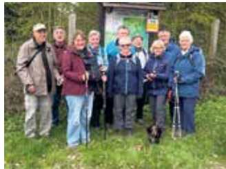
"Komm mit"-Wanderung Omerbach

Gastwanderer sind herzlichst willkommen der Vorstand, i.V. W.Vrölz