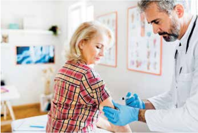
Grippeimpfung verpasst? Bis in den Frühling hinein lohnt es sich noch, sie nachzuholen.

Besser spät impfen als gar nicht: Die Grippezeit dauert oft bis Mitte Mai