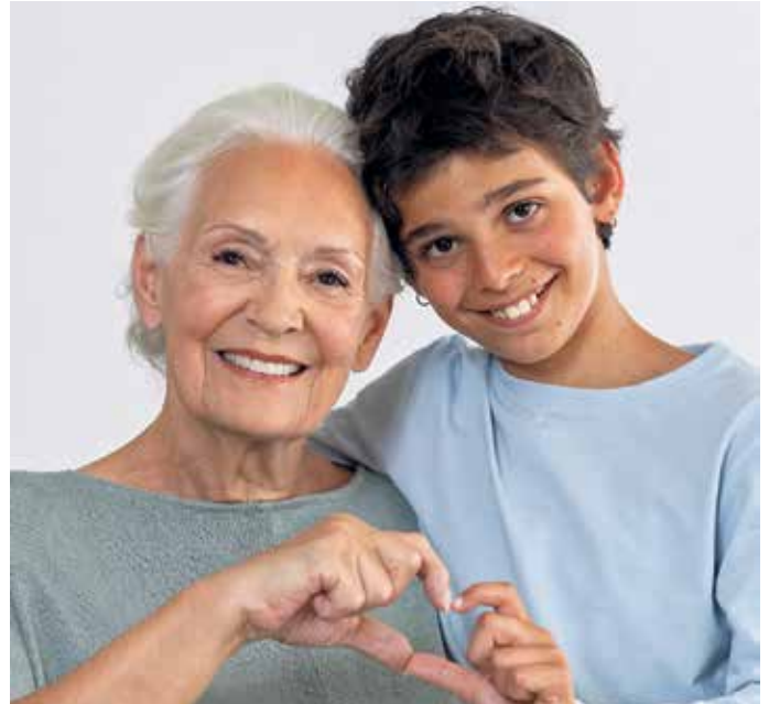
Eine Grippeimpfung schützt auch vor Herzinfarkt - und macht den Weg frei für unbeschwertem Kontakt mit Enkelkindern, Familie und Freunden.

nicht zu spät: Die Grippezeit dauert meist erst im Januar richtig Fahrt auf und dauert dann drei bis vier Monate - also oft bis Mitte Mai. Deshalb ist jede