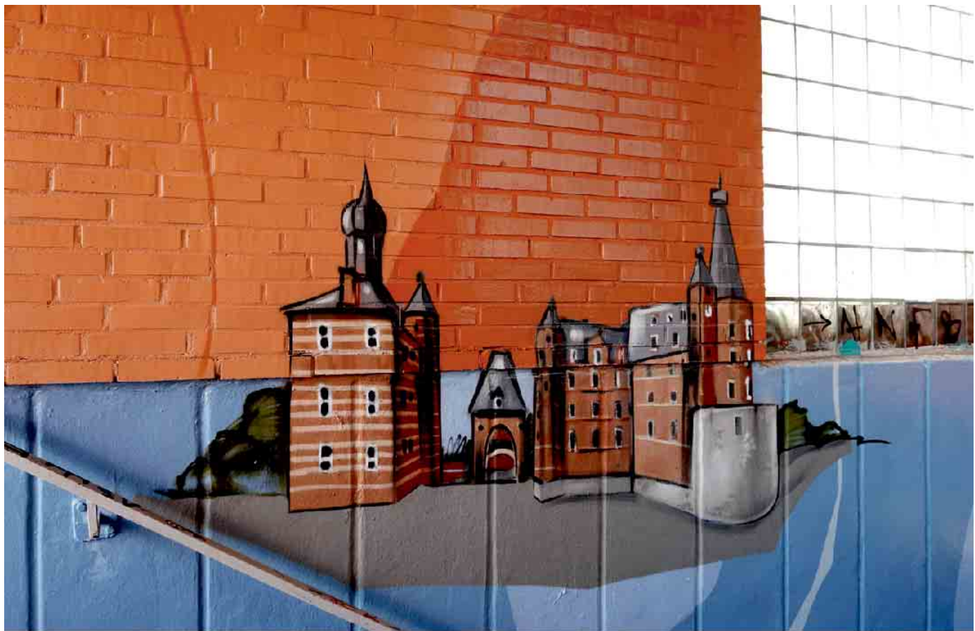
Endlich ist die Unterführung am Bahnhof mit Motiven aus der Region neu gestaltet.