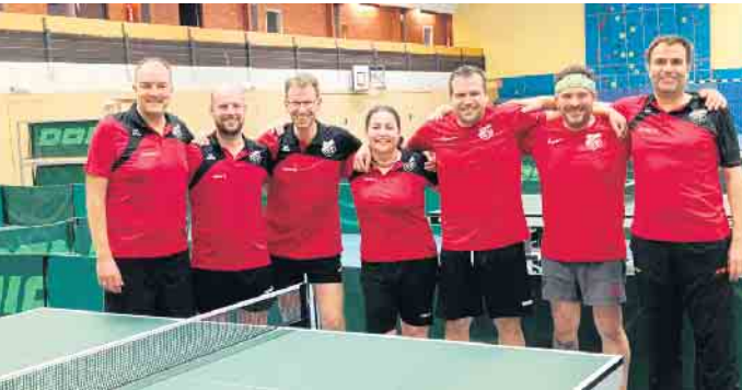
1. Platz und Meister der 2. Bezirksliga

sich sehen lassen. Bereits im vorletzten Spiel gegen Weisweiler-Wenau hätte ein Unentschieden für den Aufstieg gereicht. In der besten Aufstellung gewann man am Ende mit 9:2 und entschied das letzte Meisterschaftsspiel gegen Lucherberg sogar mit 9:0. Garant für den Erfolg waren neben den individuellen Einzelleistungen die Doppel. So hatte man in der Rückrunde mit 26:2 eine überragende Bilanz aufzuzeigen. Die nächste Saison startet im Spätsommer, dann ist das erklärte Ziel erst einmal der Klassenerhalt. „Erste Bezirksliga, wir kommen.“