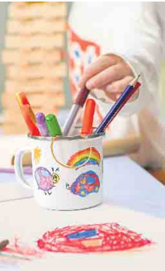
Eine Zeichnung der Kids schmückt den neuen Lieblingsbecher aus Emaille.

An kühlen Frühjahrsabenden spendet eine Kuscheldecke wohlige Wärme oder dient Kindern zum Bauen einer gemütlichen Höhle. Noch mehr positive Emotionen weckt das Lieblingsstück, wenn es mit einer fröhlichen Kinderzeichnung bedruckt wurde. Die Fleecedecke lässt sich vollflächig gestalten und ist etwa bei Cewe in drei Größen als originelles Osterpräsent erhältlich. Dazu einfach das Bild der Wahl einscannen und hochladen. Auf dieselbe Weise lässt sich auch ein Emaille-Becher im stylischen Vintage-Look in ein Unikat verwandeln. Zudem bietet das lange Osterwochenende endlich wieder Zeit zum Spielen im Familienkreis. Kleine Puzzlefans dürften sich daher über ein individuelles Fotogeschenk freuen. Die 40 extragroßen, stabilen