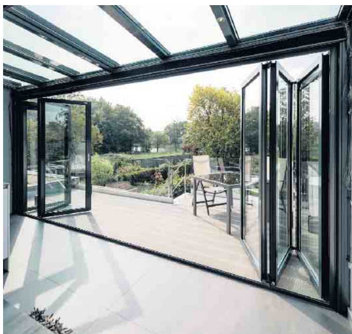
Mit einem Wintergarten gehen Innenbereich und Garten fließend ineinander über.

zimmers, als Homeoffice oder auch als Wellnessbereich. Die vollwertige, wärmegedämmte Raumerweiterung bietet zu jeder Jahreszeit und bei jeder Wetterlage einen Platz nah am Garten und der Natur. Unter www.solarlux.com etwa finden sich weitere Informationen und eine Kontaktmöglichkeit. Ein weiterer Vorteil der Glasanbauten: Tageslicht kann bis in alle Ecken des Hauses strömen, alle Räume profitieren somit von mehr Helligkeit und Atmosphäre. Praktisch sind auch senkrechte Verglasungen, die sich komplett öffnen lassen, beispielsweise als Glas-Faltwand. Auf diese Weise sind Innen- und Außenbereich nicht nur optisch miteinander verbunden. (DJD)