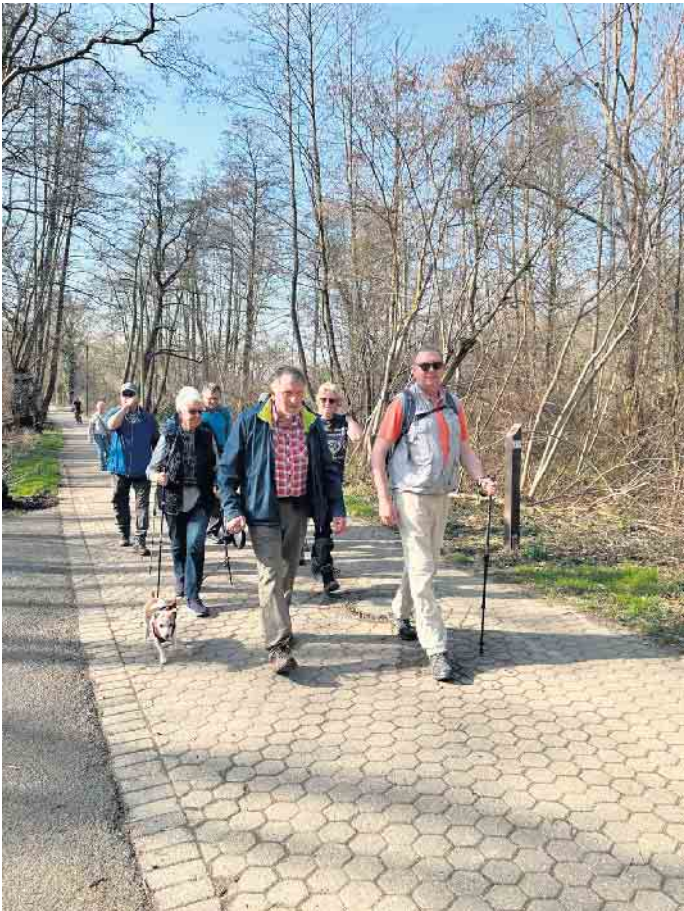
Wanderung durch das Broichbachtal am 9. März

Sonntag, 6. April, 10 Uhr, PKW, Tageswanderung zum Fichtelberg und ins Roßtal, (Eigenverpflegung), 15 km lbW, WF: Toni und Irmgard Koenen (02423-5103)