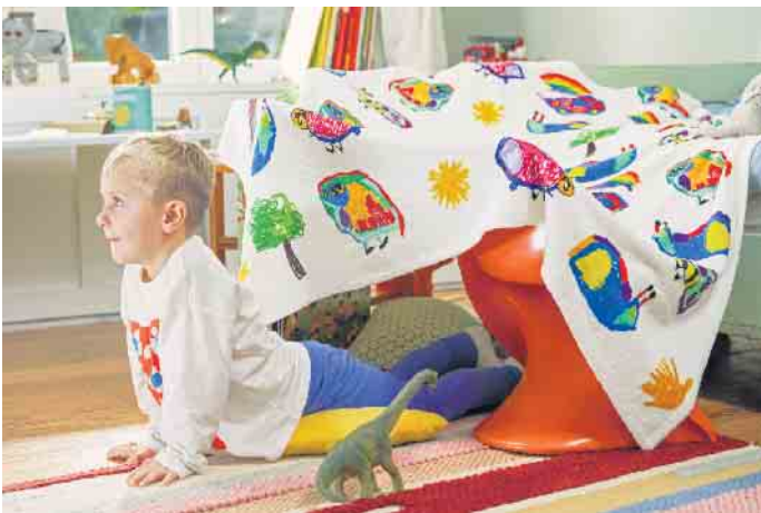
Diese Kuscheldecke gibt es nur einmal: Kinderzeichnungen sorgen für einen unverwechselbaren Look und machen aus dem Osterpräsent ein Unikat.

Puzzleteile sorgen für Spaß bereits bei Kindern ab drei Jahren.