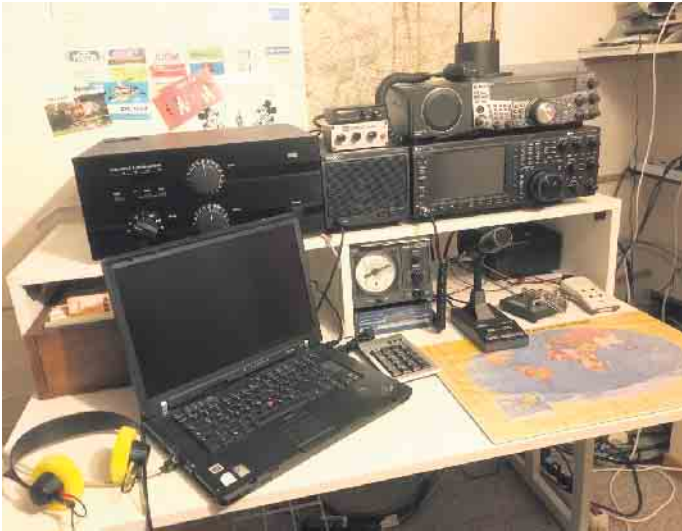
Amateurfunk ist ein Fenster zur Welt