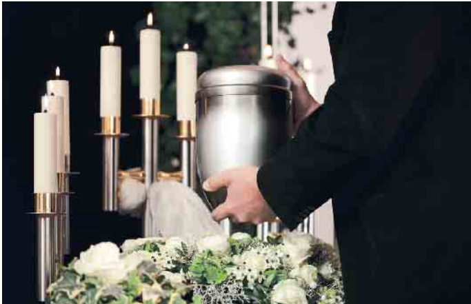
Das Markenzeichen der Bestatter ist eine eingetragene Kollektivmarke des Bundesverbandes Deutscher Bestatter e.V.

voller Erinnerungen sein und besonderen Trost spenden. Egal ob Hochzeit, Taufe, Jubiläum oder Trauerfeier - jedes Fest erfordert eine gewisse Vorbereitung, um als angemessen und gelungen empfunden zu werden. Bestatter mit dem Markenzeichen wissen, wie sie eine Trauerfeier zu einem würdevollen und persönlichen Ereignis machen können. Auch bei der Gestaltung und Umsetzung Ihrer eigenen Wünsche stehen Ihnen Bestatter mit dem Markenzeichen kompetent zur Seite. Sie bieten nicht nur eine sichere finanzielle Absicherung, sondern unterstützen Sie auch bei der Planung und dem Abschluss entsprechender Verträge. Sie sind vor, während und nach dem Sterbefall für ihre Kunden da und kümmern sich auch um Sonderwünsche und individuelle Ausstattungen von Trauerfeiern. Das Markenzeichen der Bestatter ist ein geprüftes Versprechen für Qualität. Es steht für Glaubwürdigkeit, Professionalität und Empathie. Wenn Sie sich auf Ihren Bestatter verlassen möchten, achten Sie auf das Markenzeichen. Es ist das sichtbare Zeichen für eine sichere und unabhängige Zertifizierung. Vertrauen Sie auf Qualität - vertrauen Sie auf Bestattungsunternehmen mit dem Markenzeichen der Bestatter. (akz-o)