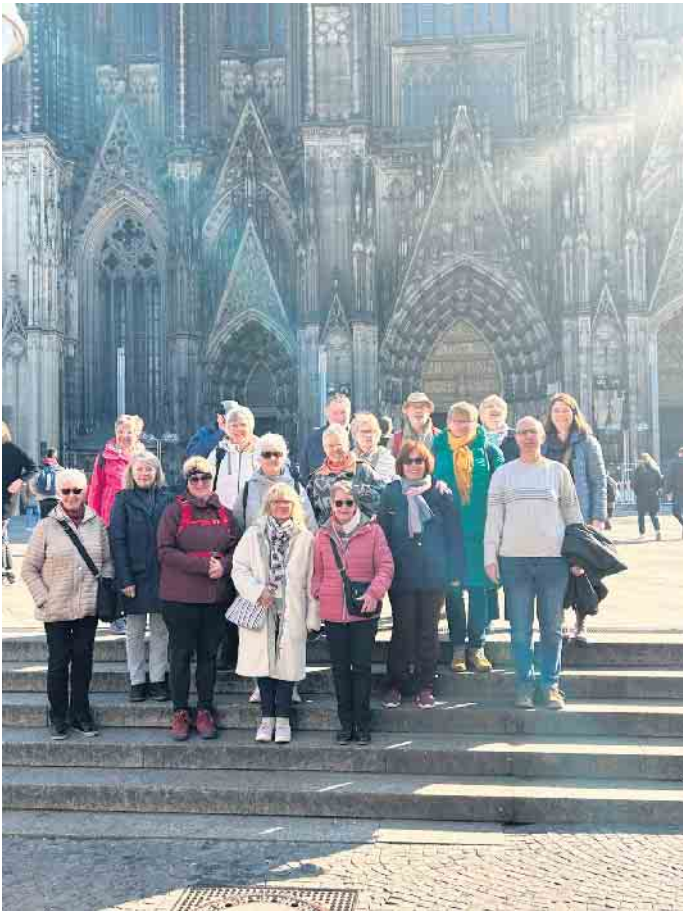
Besuch des Stadtmuseums in Köln am 16. März

Sonntag, 13. April., 10 Uhr, PKW, Tageswanderung Narzissenroute Monschau-Höfen (Eigenverpflegung), 15 km lbW, WF: Evi und Heinz-Peter Esser (02423-3860)