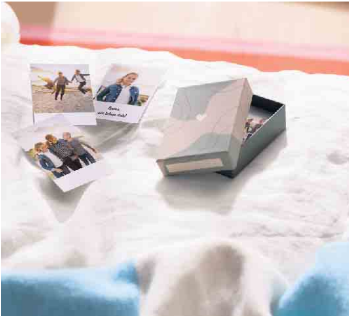
Sogenannte Little Prints halten besondere Momente im handlichen Format fest.