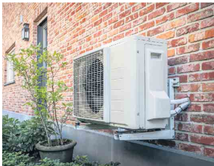
Moderne Wärmepumpen eignen sich auch für die Modernisierung und energieeffiziente Beheizung älterer Wohnhäuser.

Bauherren-Schutzbund e. V. Dennoch bestehen Mängelrisiken wegen hoher Anforderungen an die Planung, die Montage und den Betrieb. Grundvoraussetzung ist die richtige Auslegung der Heizleistung auf Basis einer Heizlastberechnung. Stange weist auf weitere wichtige Punkte hin, die zu beachten sind.