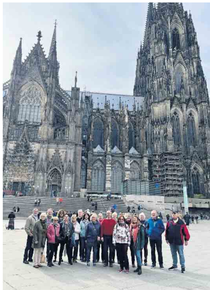
Rautenstrauch-Joest Museum in Köln

Eifelverein Ortsgruppe Schlich informiert