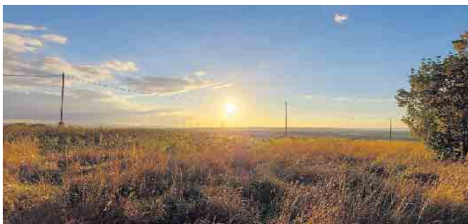
Sonnenuntergang während einer Abendwanderung

Weitere Infos unter: www.hamich-runners.de