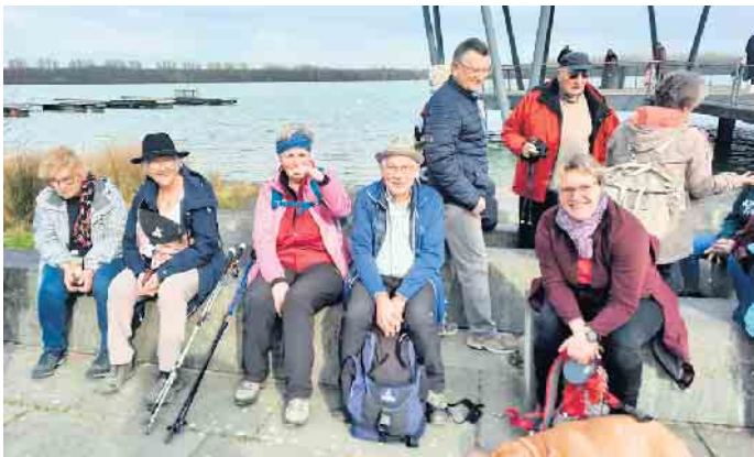
10. März um den Blausteinsee