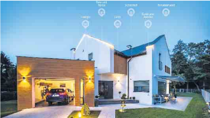
So gelingt der Einstieg: Beim Neubau oder der Sanierung gilt es, den Grundstein zu legen - danach kann das smarte Zuhause Stück für Stück erweitert werden.

tische und zeitgemäße Immobilie legt, die einem das Leben erleichtert und den Geldbeutel schont.“ (VFF/FS)