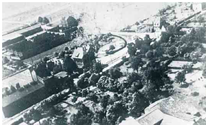
Lumpensortieranstalt A. Heymann in Pier um 1927.

Geschichtsverein der Gemeinde Inden e. V.