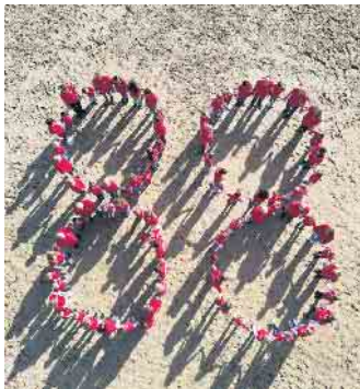
8x11 Jahre Ka-Ge-Hei e. V.

vorab beim Vorstand. 4. März: Gardetreck & Erbsensuppe - ab 10 Uhr Zum Abschluss ziehen die Aktiven durchs Dorf, bevor es ab 12 Uhr im Zelt das traditionelle Erbsensuppenessen mit den Auftritten der Kindergruppen gibt. Einlass ab 11 Uhr. Eintritt frei! Die Ka-Ge-Hei freut sich auf viele fröhliche Gäste, beste Stimmung und eine unvergessliche Jubiläumssession. Kostüm an, gute Laune mitbringen und einfach mitfeiern!