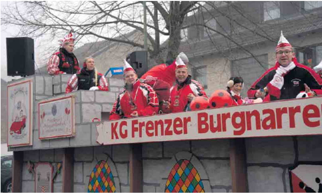
Tollitäten der Session 2024-2025

Am Sonntagmorgen, 19. Januar , dann wie jedes Jahr im Januar das große Prinzenbiwak mit dem Karnevalsumzug durch unser Dorf Frenz. Die Burgnarren mitgerech-