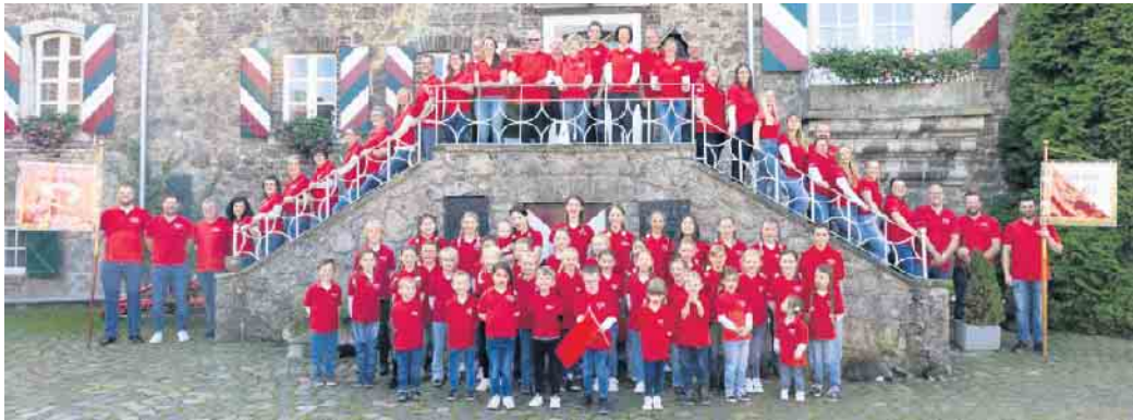
Karnevalsgesellschaft Ka-Ge-Hei e. V.

22. Februar: Kappensitzung - ab 19 Uhr Das Herzstück des Karnevals! Ein Abend voller Reden, Tänze und Musik - von urkomischen Büttenreden bis zu mitreißenden Showeinlagen. Eintritt: 18 Euro und wer noch kein Ticket hat, sollte sich beeilen! Einlass ab 18 Uhr. 23. Februar: Kindersitzung - ab 15Uhr Die Kleinen sind hier die Größten! Ein Nachmittag voller Spaß, Spiel und Überraschungen. Kinder haben freien Eintritt, Erwachsene zahlen 4 Euro. Einlass ab 14 Uhr.