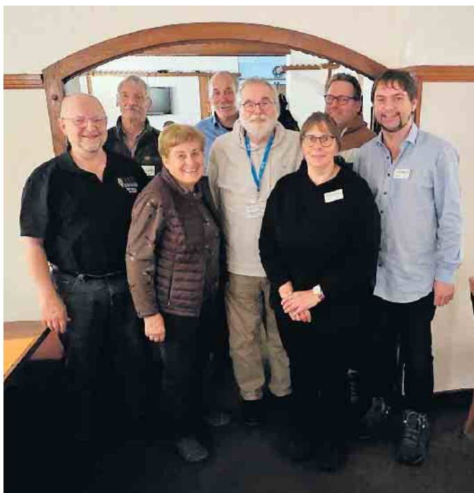
Der neue Vorstand des Ortsverbandes G26 Rureifel.

Der DARC-Ortsverband Rureifel bietet einen Lehrgang für die Vorbereitung auf die Einsteiger-Prüfung zur Klasse N an. Willkommen sind Interessentinnen und Interessenten aus allen Alters-