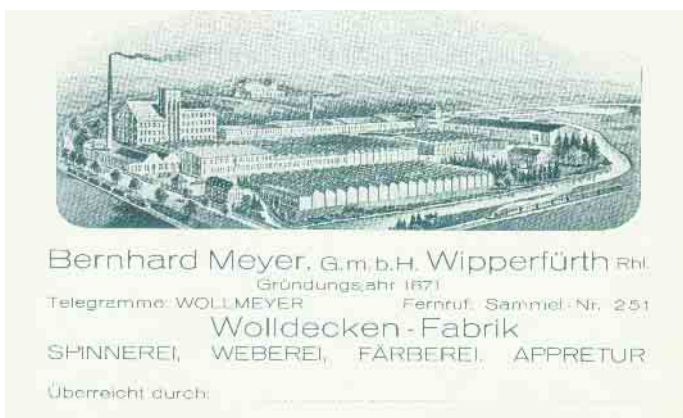
Vertreterkarte aus Nachlass Heymann.