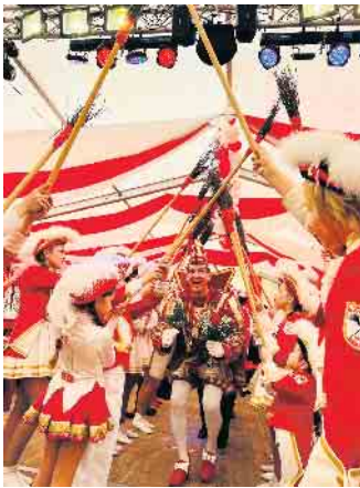
Prinz Bambi I.

bekannte Gesichter zum Feiern an. Am Karnevalssamstag: Kurz Sitzung, wurde ausgelassen mit vielen Gästen gefeiert wurde. Sonntags: der nächste Höhepunkt - nach dem Prinzenfrühschoppen fand bei trockenem Wetter ein grandioser Karnevalsumzug statt. Viele Gruppen haben sich dem Zug angeschlossen. Prinz Bambi strahlte überglücklich von seinem Wagen und alle jubelten ihm zu. Anschließend wurde im vollen Festzelt ausgiebig gefeiert. Beim Gardetreck und Erbsensuppenessen kam es zum schwersten Gang für Prinz Bambi I. und seiner Ka-Ge-Hei. Hier blieb kein Auge trocken. Uns fehlen immer noch die Worte und es wird auch noch einige Zeit dauern, bis wir diese Session verarbeitet haben. Die Gesellschaft bedankt sich bei allen Sponsoren, Gönnern, Freunden, Besuchern und vor allem bei ihrem Prinzen für eine unvergessliche, tolle Session. Und wenn sie nicht gestorben sind... Dann bereiten sie schon ihre Jubiläumssession 8x11 Jahre vor.