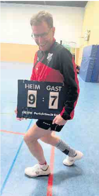
So sehen Sieger aus

Ein nervenaufreibendes Spiel. So kann man den Verlauf in der letzten Begegnung des VfL 63 Langerwehe gegen den Tabellenzweiten aus Kreuzau bezeichnen. In der 2. Bezirksliga liegt die erste Mannschaft nach einem schweren Rückrundenstart mit vielen Ersatzproblemen nur auf einen der unteren Tabellenplätze. Nach einer klaren 1:9 Niederlage im Hinspiel standen die Zeichen anfangs klar auf Sieg für Kreuzau. Doch Langerwehe lies nicht locker und kämpfte sich nach einer 5:7 Rücklage wieder heran. Das letzte Einzel brachte dann Langerwehe zum ersten Mal im Spiel nach vorne, Zwischenstand 8:7. Das Schlussdoppel Bartz / Geffers musste wieder ran und die Entscheidung bringen - mit einer spielerischen Glanzleistung schaffte Langerwehe den verdienten 9:7 Sieg! Im Einzel spielte Becker, Bartz, Kuckertz, Geffers, Böll jeweils 1:1, nur Storms machte mit zwei Siegen den Sieg perfekt. In den Doppeln war die Bilanz ausgeglichen mit 2:2. Auch die zweite Mann-