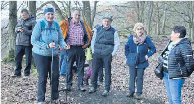
Um den Obermaubacher See am 28. Januar