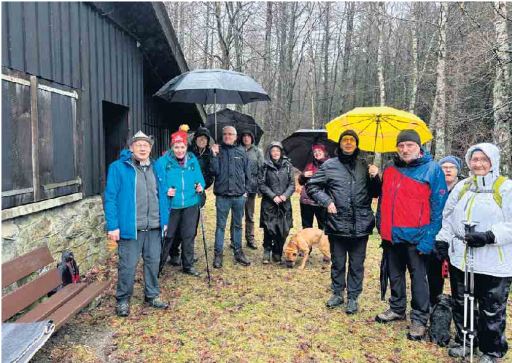
4. Februar: Fringshaus - Steinley Venn