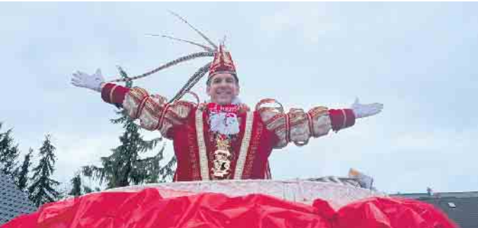
Karnevalsumzug Prinz Bambi I.

bekannte Gesichter zum Feiern an. Am Karnevalssamstag: Kurz Sitzung, wurde ausgelassen mit vielen Gästen gefeiert wurde. Sonntags: der nächste Höhepunkt - nach dem Prinzenfrühschoppen fand bei trockenem Wetter ein grandioser Karnevalsumzug statt. Viele Gruppen haben sich dem Zug angeschlossen. Prinz Bambi strahlte überglücklich von seinem Wagen und alle jubelten ihm zu. Anschließend wurde im vollen Festzelt ausgiebig gefeiert. Beim Gardetreck und Erbsensuppenessen kam es zum schwersten Gang für Prinz Bambi I. und seiner Ka-Ge-Hei. Hier blieb kein Auge trocken. Uns fehlen immer noch die Worte und es wird auch noch einige Zeit dauern, bis wir diese Session verarbeitet haben. Die Gesellschaft bedankt sich bei allen Sponsoren, Gönnern, Freunden, Besuchern und vor allem bei ihrem Prinzen für eine unvergessliche, tolle Session. Und wenn sie nicht gestorben sind... Dann bereiten sie schon ihre Jubiläumssession 8x11 Jahre vor.