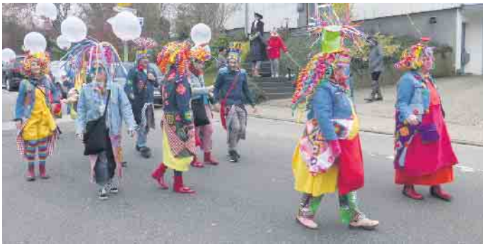
Kegelclub Keen 9