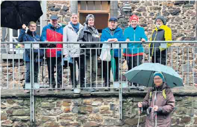
8. Februar: Weiberfastnacht auf der Laufenburg