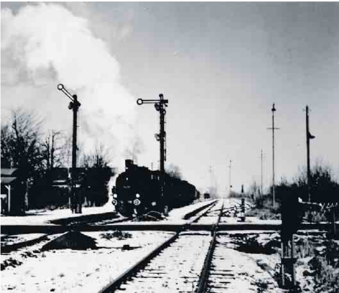
Bahnhof Inden zu Beginn der 1960er-Jahre.

„Drei Spurweiten rund um Inden - was machte die Eisenbahn hier so besonders?“