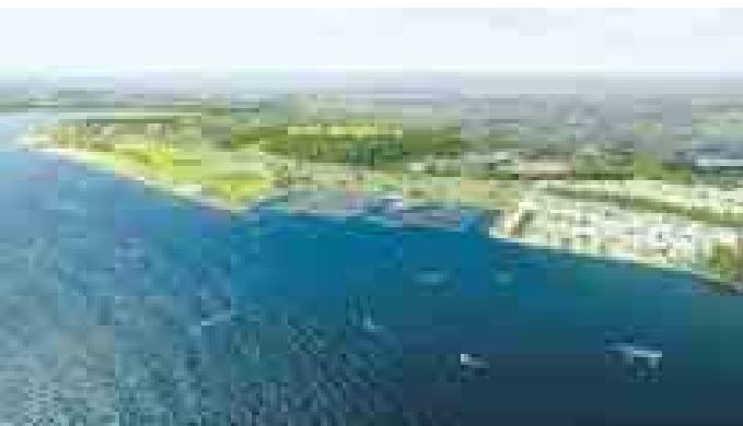
indeland GmbH / HHVISION

Die Zukunftsszenarien beschreiben, wie sich die Region bis zum Jahr 2060 entwickeln könnte. Gastland, Laborland, Wandelland und Ernteland - so heißen die vier Szenarien für das Jahr 2060, die im Auftrag der indeland GmbH erarbeitet wurden.