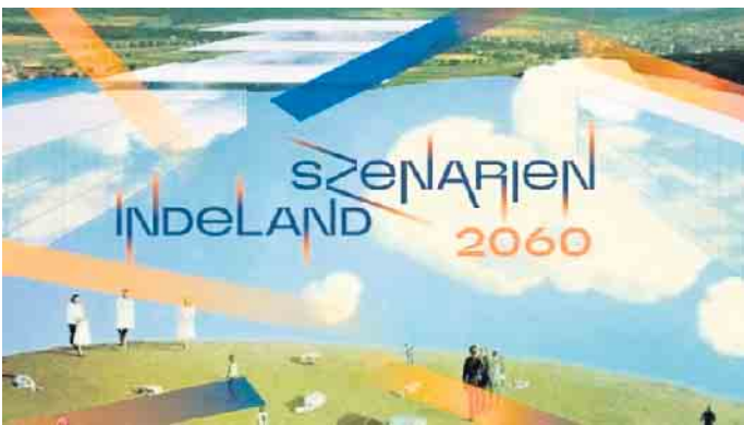
indeland GmbH / Ellery Studio

Am 19. und 20. Dezember 2024 fanden in der Europaschule Langerwehe Projekttag zum Thema Nachhaltigkeit statt. Die Jahrgangsstufe EF fokussierte sich an den beiden Tagen auf die nachhaltige Entwicklung von Städten und Gemeinden und befasste sich in diesem Rahmen mit dem Strukturwandel in der Region sowie der Entwicklung des Ortskerns Langerwehe.