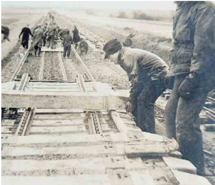
Bau der Grubenbahn Weisweiler-Lucherberg 1949 bis 1951.

Als vor nunmehr vier Jahrzehnten die Bahngleise zwischen Jülich und Frenz abgerissen wurden, verschwand das letzte und sichtbare Stück des Schienenverkehrs in der Gemeinde Inden. Dabei bestand hier nur ein Vierteljahrhundert zuvor noch ein wahres Eisenbahn-Eldorado mit einer rege frequentierten Bundesbahnstrecke, auf der Personenzüge durchgehend bis Aachen und Mönchengladbach verkehrten, einer Überland-Straßenbahn von Inden über Pier nach Düren sowie einem sich ständig wandelnden Netz aus Industriebahnen, das die Brikettfabrik Lucherberg mit Kohle zuerst aus Konzendorf, dann aus Weisweiler versorgte, und später Abraum aus dem Tagebau Inden bis in den heutigen Dürener Badesea brachte. Und alle drei Bahnsysteme fuhren auf unterschiedlichen Spurweiten. Was in dieser spannenden Eisenbahn-Ära zwischen