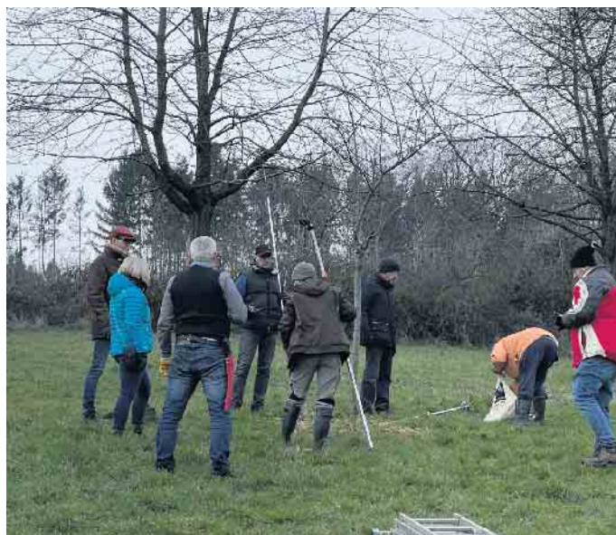
Baumschnitt will gelernt sein.

Anmeldung bitte bei: Kerstin Delahaye unter 0151 12519459 Sie können sich auch bei uns melden, wenn Sie den einen oder anderen Baum zur Verfügung stellen wollen. Wenn wir noch „Übungsbäume“ suchen, treffen wir uns dann einfach bei Ihnen. Lothar Kurth LUNA e. V. & BUND Ortsgruppe Langerwehe/Inden lokurth@gmail.com, 0176 5545 1770