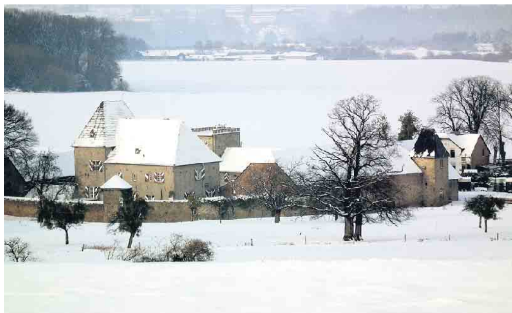
Winterepisode Burg Holzheim