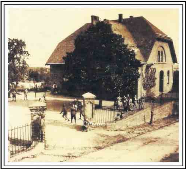
Bild der einklassigen Volksschule Leversbach von 1928