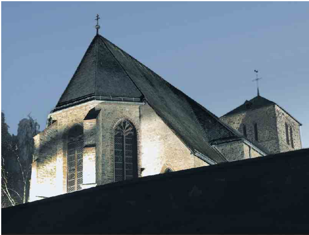
Alte Kirche in Langerwehe