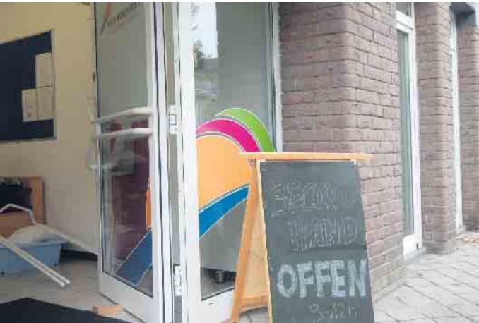
Begegnungsstätte AnziehBar. Herzlich Willkommen.