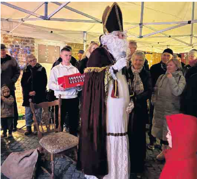
Weihnachtsblasen in Merode

Der Ortsvorsteher der Ortschaft Merode gibt bekannt!