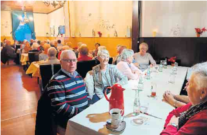
Weihnachtsfeier der AWO Merzenich

ne Abwechslung vom Alltag. Besuchen Sie uns auch im Internet: www.awo-merzenich.de