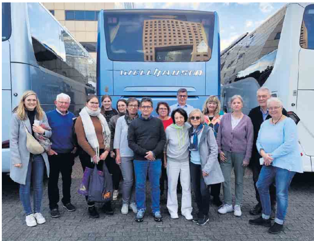
Ein Teil der Reisegruppe kurz vor der Rückreise aus Frankfurt.

Räumungen von Wohnungen, Häusern, Dachböden, Kellern etc.! Auch Kleinabriss von Garagen, Vordächern, Gartenhäusern, Demontage und Rückbauarbeiten. Fa. Borgis Verwertungen. Tel.: 05205-72553