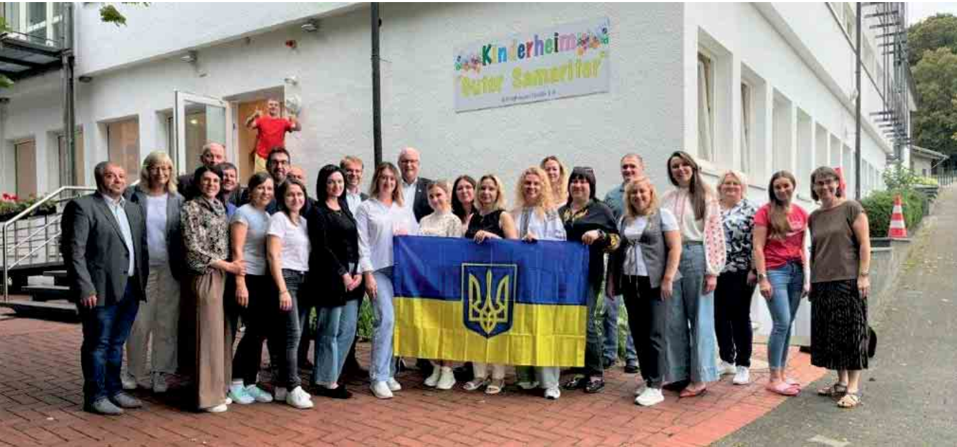
Pädagogische Fachkräfte aus der Ukraine, Mitarbeitende der Einrichtung, Vertreter des Christlichen Schulvereins Lippe sowie Mitarbeitende der Fachgruppe Jugend der Stadt Lage trafen sich im Haus Stapelage.

Großpflegestelle bietet Kindern aus Mariupol ein Zuhause