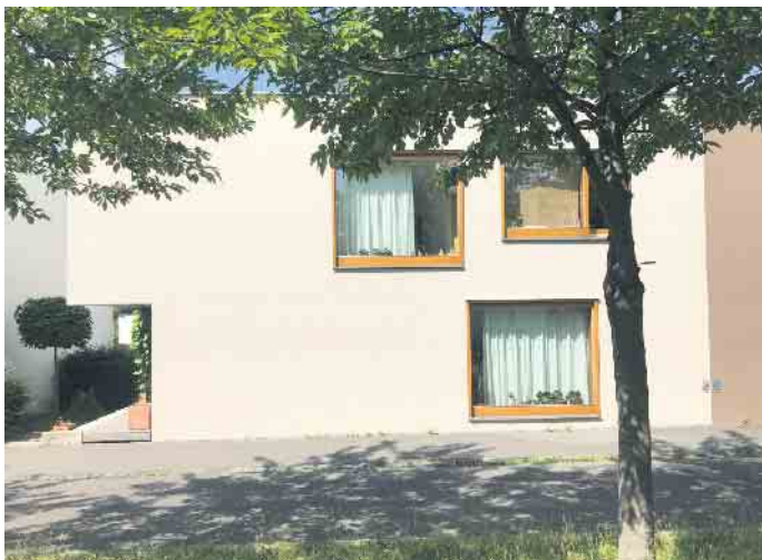
Frisch herausgeputzt: Mit zahlreichen Farben, Strukturen und Möglichkeiten der Oberflächengestaltung verleihen Putze jeder Fassade einen individuellen Look.

Mit Putz erhalten Fassaden eine individuelle und charaktervolle Optik