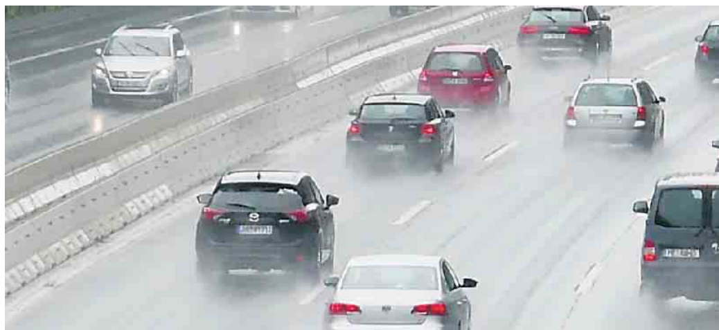
Starkregen kann zur echten Gefahr für Autofahrer werden.

Bei Sichtweiten von unter 50 Metern müssen Autofahrer auch bei Starkregen die Nebelschlussleuchte einschalten. Die maximale Höchstgeschwindigkeit beträgt auch auf Autobahnen dann nur noch 50 km/h. „Wir raten dazu, bei solch extremen Verhältnissen nicht mehr