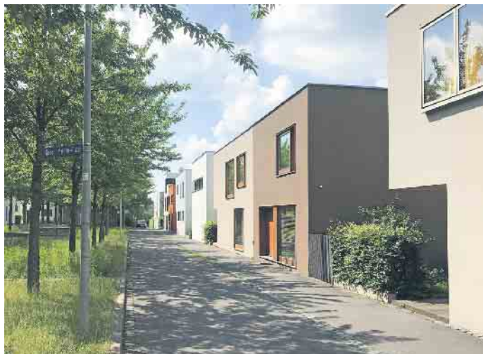
Die farbige Vielfalt von Putz bringt eine lebendige Atmosphäre in jede Wohnsiedlung.