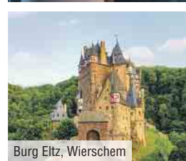
Burg Eltz, Wierschem