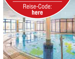
Bsp. DZ Komfort (gg. Aufpreis)