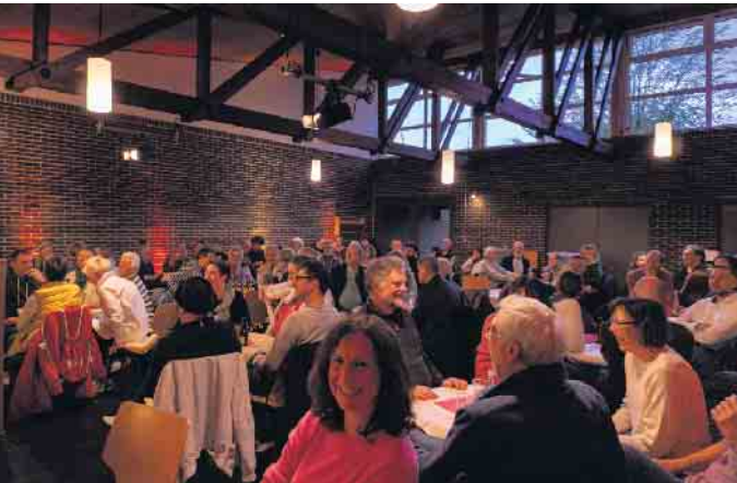
Impressionen vom Kneipenquiz (ohne Kneipe) im April

Nach dem großen Erfolg der vergangenen zwei Quiz-Veranstaltungen lädt der Waddenhauser Bürgertreff am 15. November, ab 19 Uhr, wieder zum großen Rate-Abend in die Halle an der Soorenheide (Soorenh