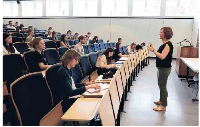
Nach einer erfolgreichen Ausbildung gibt es an verschiedenen Hochschulen die Möglichkeit, ein Studium im Bereich Augenoptik/Optomietrie zu absolvieren.

Gutes Sehen bestimmt unseren Alltag und beeinflusst unsere Lebensqualität. Wenn unsere Sehkraft nachlässt oder Probleme beim Sehen auftreten, sind Augenoptiker die richtigen Ansprechpartner.