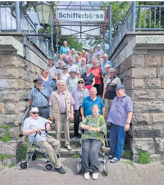
Die „Frohsinn“-Reisegruppe am Schiffsanleger im Duisburger Hafen