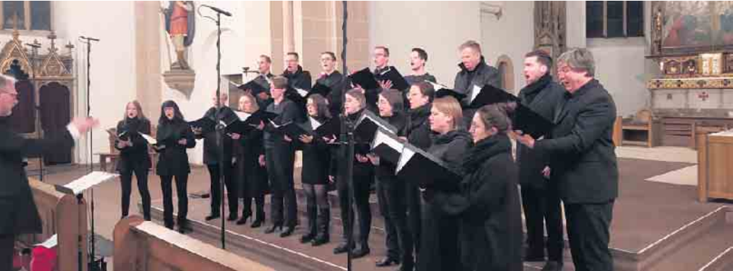
Kammerchor KONSONANTE AKTION im Dezember 2022

Kammerchor KONSONANTE AKTION bereitet sich auf ein Konzert in Marienmünster vor