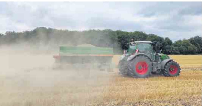
Ein Trecker fährt mit dem Kalkstreuer über den Stoppelacker.

Lippe / WLV (Me). Nach der Ernte streuen viele Landwirte Kalk auf ihre abgeernteten Felder. Das passiert regelmäßig alle paar Jahre, denn der Kalk verbessert viele Bodeneigenschaften. Der Zeitpunkt, in dem man überall Stoppelfelder sehen kann, ist genau der richtige, um mit dem Kalkstreuer über die