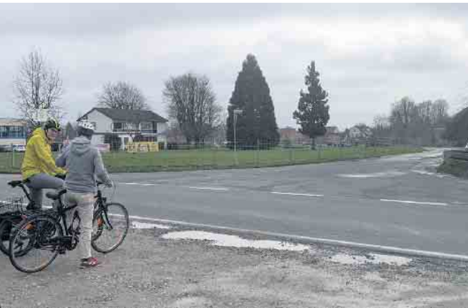
Waddenhauser Str. - Blick Richtung Kampweg

Aus der Arbeit der Parteien Bündnis90 / Die Grünen