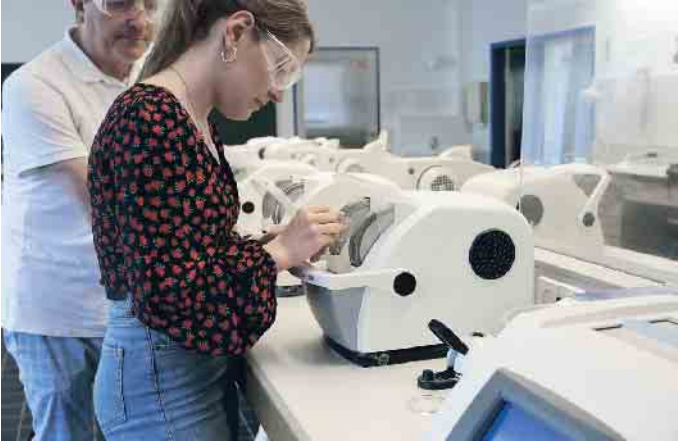
Brillenschliff, Reparatur und Anpassung - nur ein paar Dinge, die Augenoptiker-Auszubildene innerhalb von drei Jahren lernen