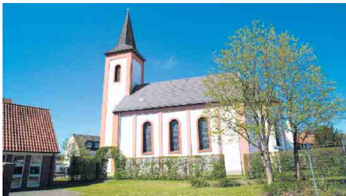
Ev.-ref. Kirche in Lipperode: Hier ist der Auftakt der Predigtreihe am 13. August.

Kreis Lippe. Mit dem Jubiläum 900 Jahre Lippe und 50 Jahre Kreis Lippe ist auch eine wechselvolle kirchliche Geschichte verbunden. Die Lippische Landeskirche lädt alle Interessierten ein, Lippe einmal aus diesem Aspekt heraus zu bereisen und kennenzulernen: „Eine Predigtreih(e) durch Lippe“ führt in Kirchengemeinden, die immer schon zu Lippe gehörten, mal gehörten oder neu im Kreis Lippe sind. Im Gepäck ist die Abrahamsgeschichte mit den Bildern, die Simon VI. (1554-1613) dazu hat malen lassen. Auftakt ist am Sonntag, 13. August, um 10 Uhr in der ev.-ref. Kirche Lipperode, Bismarckstr. 10, 59558 Lippstadt. Pfarrer Maik Fleck, Kulturbbeauftragter