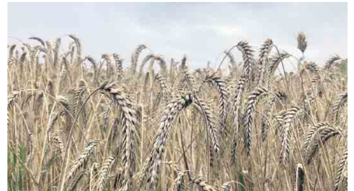
Der anhaltende Regen sorgt für eine Erntepause in Ostwestfalen Lippe

desto mehr leidet auch die Qualität besonders bei Weizen und Roggen. Wenn die hohen Qualitätskriterien nicht erfüllt werden können, kann das Getreide nicht mehr zu Mehl für Brot und Brötchen verarbeitet werden. Dann kann das Getreide aber noch als Tierfutter genutzt werden, jedoch zu einem geringeren Marktpreis. Die rein energetische Verwertung in Biogasanlagen wäre der extremste Schritt. Doch so weit ist es noch nicht: „Wir hoffen auf das angekündigte bessere Wetter in der kommenden Woche. Noch ist nicht alles verloren“, so Hagedorn. Der Landregen durchfeuchtet die Böden. Felder können den Regen zwar gut aufnehmen, die Äcker