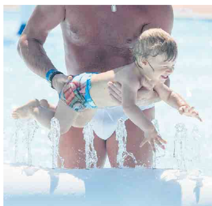
Je früher, desto besser - so lernen Kinder spielerisch den Kontakt zum Wasser und später leichter Schwimmen.

Schwimmhilfen, wie Schwimmflügel, Schwimmbretter, Schwimmkissen oder Schwimmscheiben können zwar die ersten Schwimmversuche erleichtern, ausreichende Sicherheit bieten sie aber nicht und eine wirkliche Hilfe zum Schwimmenlernen sind sie auch nicht. In jedem Fall sollten sie aber gemäß den Sicherheitsanforderungen der europäischen Norm EN 13138 geprüft und entsprechend gekennzeichnet sein. „Luftmatratzen, Reifen oder aufblasbare Wassertiere sind dagegen keine Schwimmhilfen“, warnt Peter Harzheim, Präsident des Bundesverbandes Deutscher Schwimmmeister. Sie seien Spielzeug, mit dem Kinder leicht abtreiben und in tiefes Wasser geraten können. (akz-o)