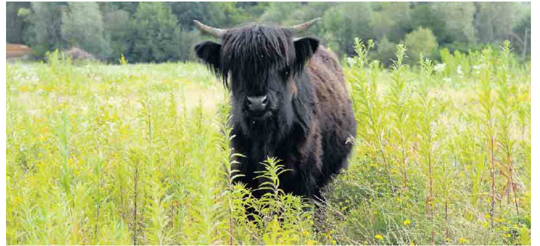
Seit kurzem steht die junge Kuh mit ihren Artgenossen und drei Wasserbüffeln zur Landschaftspflege in Müssen.

Grund ist auch der Naturschutz. Das Gelände ist von der Straße aber einsehbar. Es sind zudem Aussichtspunkte geplant.