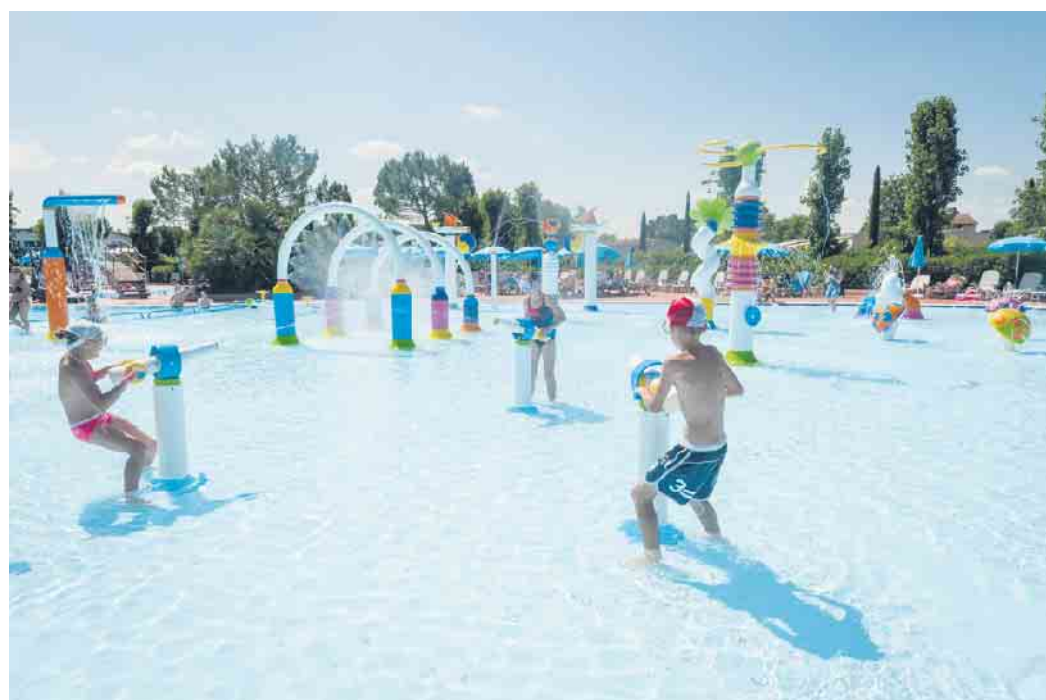
Die meisten Kinder lieben den Spaß mit und im Wasser. Jedes Kind sollte die Chance erhalten, Schwimmen zu lernen.

Neben Verkehrsunfällen zählt Ertrinken zur häufigsten Art tödlich verlaufender Unfälle im Kindesalter. Aber auch die hohe Zahl der „Beinahe-Ertrinkungsfälle“ führt nicht selten zu schwerwiegenden gesundheitlichen Folgen. „Früh schwimmen zu lernen, gehört damit zum wichtigsten Schutz vor Unfällen im Wasser“, erklärt Peter Harzheim vom Bundesverband Deutscher Schwimmmeister und empfiehlt, dass Kinder bereits im Vorschulalter damit beginnen sollten, schwimmen zu lernen. In vielen Schwimmbädern werden spezielle Kinderschwimmkurse angeboten. Mit dem „Seepferdchen“-Abzeichen erhalten Kinder dort einen ersten Anreiz, sich intensiver mit dem Schwimmen zu beschäftigen. Als sichere Schwimmer gelten sie damit allerdings noch nicht. Erst nach einer erfolgreich bestandenen Prüfung des Deutschen Schwimmabzeichens in Bronze, Silber oder sogar Gold, steht einem sicheren Vergnügen im Schwimmbad nichts mehr im Wege. Je höher die Stufe des Schwimmabzeichens ist, umso sicherer können auch die verantwortlichen Aufsichtspersonen bzw. auch die