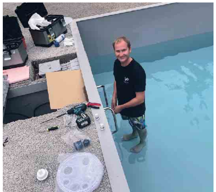
Mit den Füßen im Wasser: das ist Arbeiten in der Poolbranche.