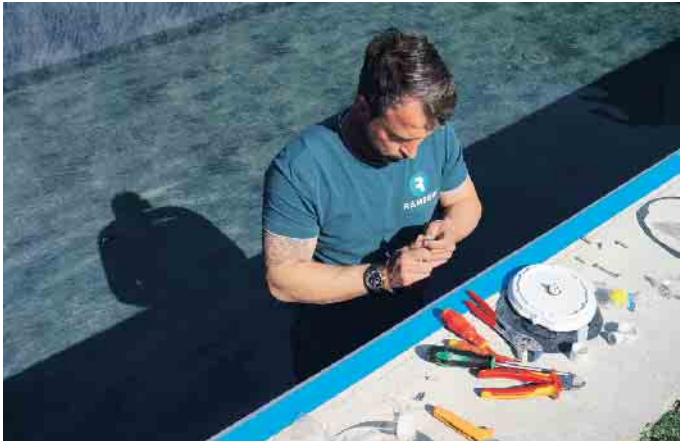
Ein Poolbau bei Sonnenschein.

Als Handwerker ist man derzeit in vielen Branchen gefragt - auch und ganz besonders in der Schwimmbadbranche. Hier gibt es nicht nur sichere Arbeitsplätze und faire Bezahlung, sondern etwas, das andere Wirtschaftszweige nicht bieten können: Arbeiten mit Urlaubsfeeling.