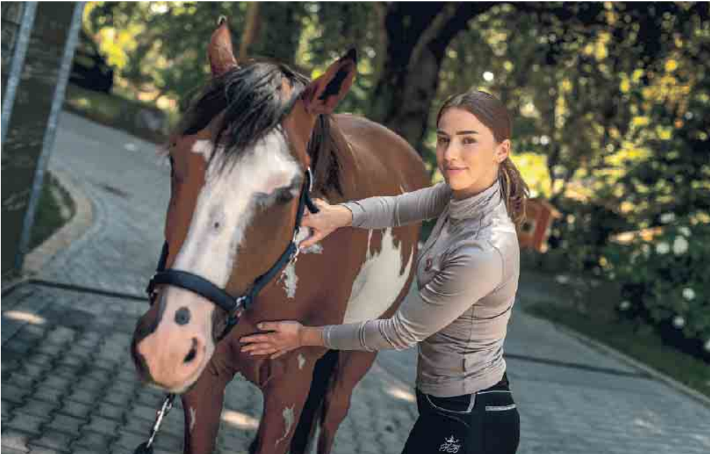
Mit der richtigen Weiterbildung zum Traumberuf.

Mit der richtigen Weiterbildung zum Traumberuf