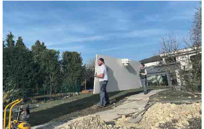
Teamwork ist gefragt.

Als Schwimmbadbauer hat man wesentlich mehr drauf, als ein Loch zu graben und Wasser einzufül-