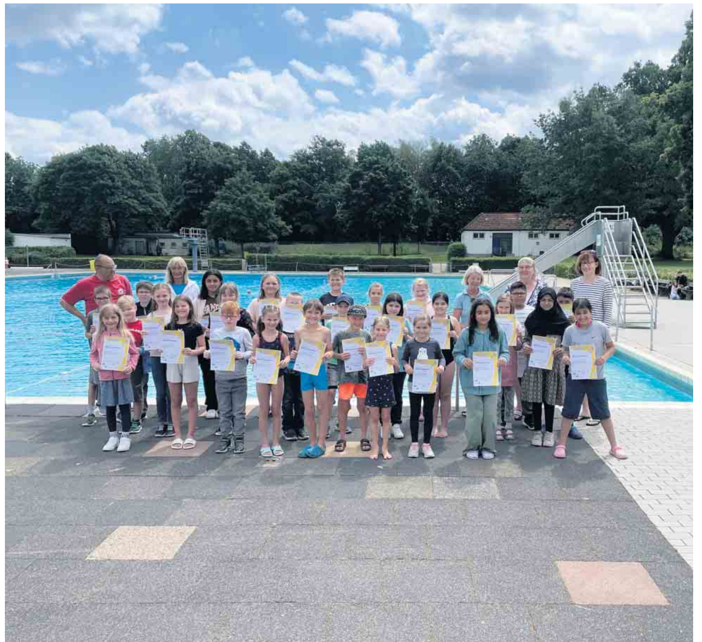
Stolz zeigen die meisten Kinder ihre Teilnehmerurkunden.

Schwimmen gehört zweifellos frei zum Kulturgut. Es zu erlernen ist nicht nur deswegen das Ziel der meisten Kinder. Es ist auch Grundlage für viele Aktivitäten im Leben und besonders in der Freizeit. 36 Kinder Lippischer Schulen, überwiegend aus Lage, nutzten die Möglichkeit, die der Förderverein in den ersten zwei Sommerferienwochen bot: Vier Anfängerschwimmkurse im Rahmen des Landesprogramms „NRW kann schwimmen“ für Schülerinnen und Schüler vom zweiten bis sechsten Schuljahr. Dieses Programm, das es seit mehr als zehn Jahren gibt, versucht die steigende Zahl von Kindern, die nicht schwimmen können,