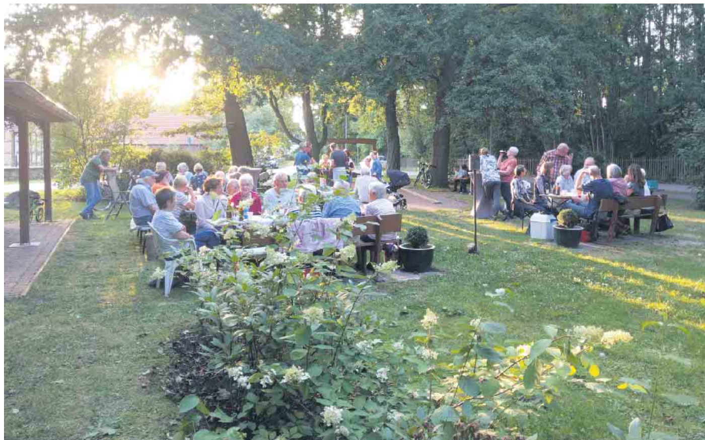
Impression aus dem Jahr 2022