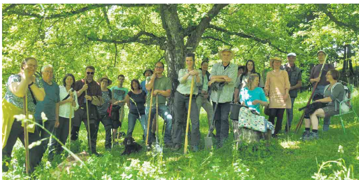
Großes Engagement. Hochmotiviert und mit Leidenschaft waren die 20 frisch gebackenen Obstwiesepfleger während der sechsmonatigen Fortbildung dabei. Sie verstärken jetzt das Netzwerk „Streuobstwiese“ in Lippe.

berge in Detmold ihren erfolgreichen Abschluss gefunden hat. Die Umweltstiftung Lippe förderte das Vorhaben mit 3.400 Euro. Seit Januar haben sich die ehrenamtlichen Obstwiesepflegerinnen und Obstwiesepfleger in sechs Modulen praxisorientiertes Wissen zu den Themen Streuobstwiesen allgemein, Sorten- und Schnittkunde, Veredelung, Streuobstpädagogik und Grünland angeeignet. „Mit ihrem Wissen und Engagement verstärken sie das Netzwerk ‚Streuobstwiese‘, das mit dem ersten Durchlauf im vergangenen Jahr entstanden ist“,