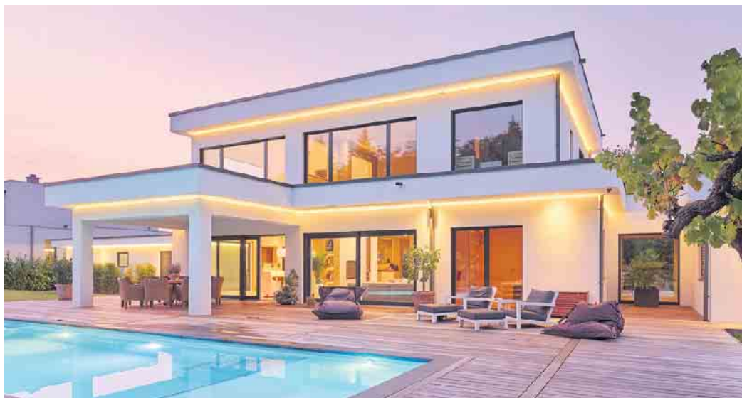
„Die Bauhausarchitektur ist Ausdruck von Individualität und Stilsicherheit.“

Für den Holz-Fertigbau waren die Ideen von Bauhaus-Gründer Walter Gropius nicht nur architektonisch prägend: schlichter Funktionalismus und Rationalität sowie die Kombination aus kunstvollen Gestaltungsideen und standardisierten Bauteilen aus seriellen Produktionsverfahren - eine Mischung, die sich die Fertighausbranche bis heute zunutze macht, um individuelle Häuser nach einem Setzkastenprinzip zu entwerfen. Dabei wird der Setzkasten immer größer und vielfältiger. „Die Bauhausarchitektur ist nur eine von vielen Planungsgrundlagen, auf der Fertighaus-Bauherren ihre persönlichen Wünsche und Vorstellungen vom Traumhaus heute in die Tat umsetzen können“, erklärt Fabian Tews, Sprecher des Bundesverbandes Deutscher Fertigbau (BDF). Aber warum ist gerade die Bauhausarchitektur bei Bauherren wieder so beliebt? „Weil sie zeitlos ist“, glaubt Tews. Zum einen könnten reduzierte kubische Gebäudeformen einen will-