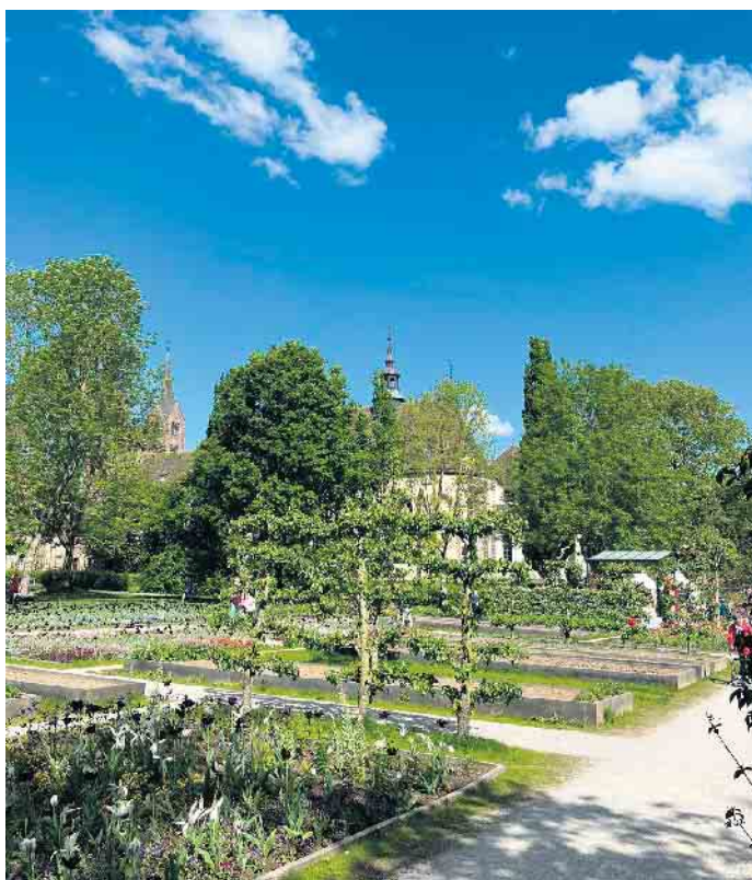
Impressionen von der Landesgartenschau