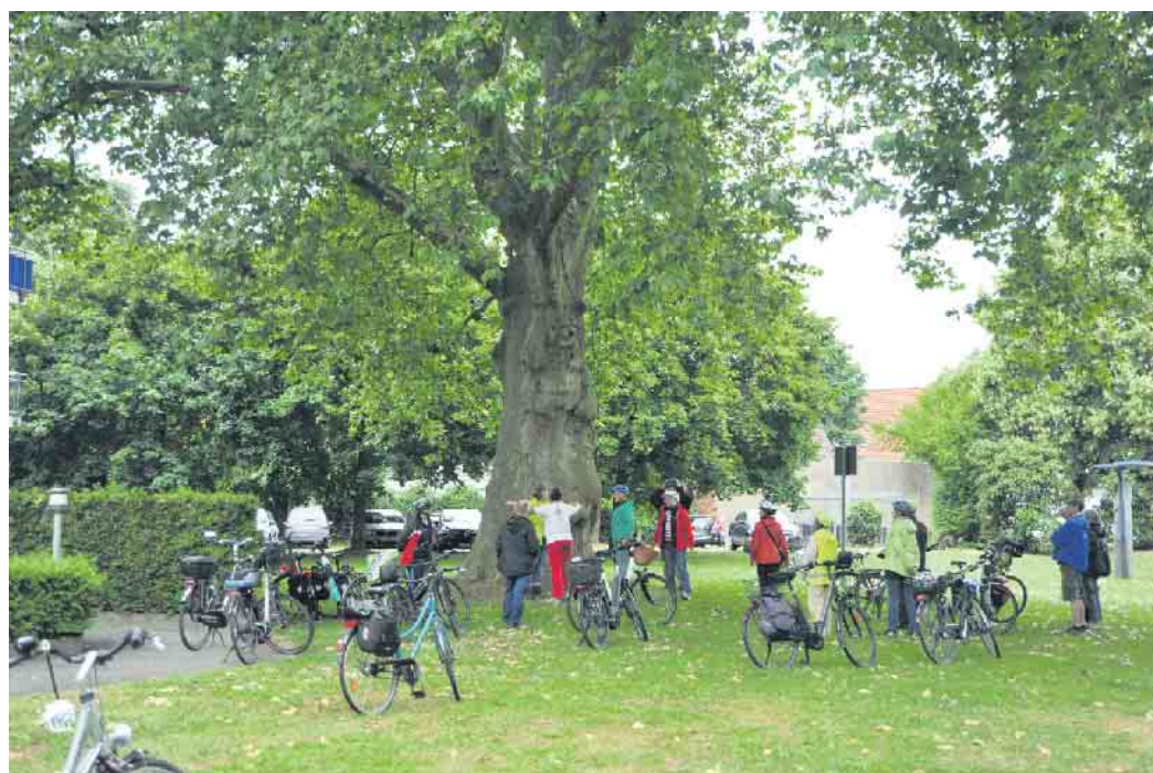
Platane hinter dem Technikum