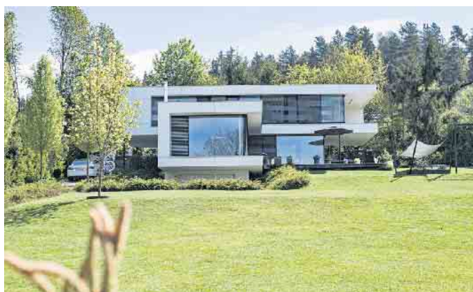
Flaches Dach, kubische Baukörper - das kommt bei vielen Bauherren gut an.

in der viele Familien zeitlich immer stärker eingespannt sind oder das Mehr an Komfort besonders schätzen. Mit einem schlüsselfertigen Holz-Fertighaus kommen sie entspannt und planungssicher in ihrem individuellen Traumhaus an“, schließt Tews. (BDF/FT)