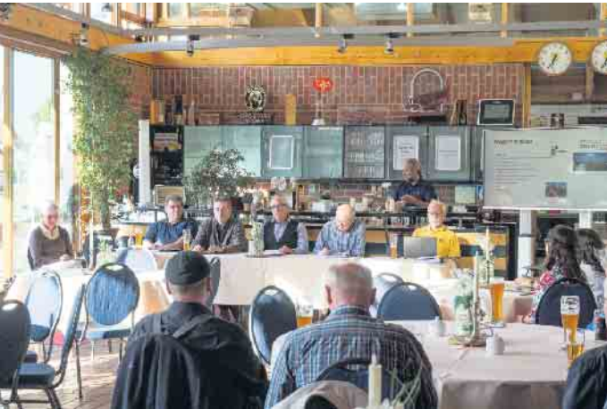
In die Tichlerstoben im Ziegeleimuseum hatte der Vorstand zur Mitgliederversammlung 2025 eingeladen.