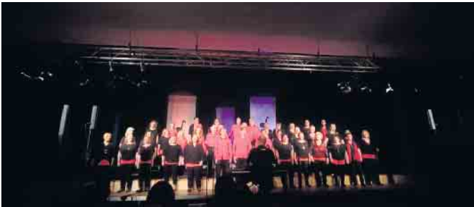
Text- und tonsicher präsentierte sich der Chor „LIPs in motion“ beim Jahreskonzert 2024 in der Aula am Werreanger.

Nach dem Konzert ist vor dem Konzert: Im Herbst folgt das inzwischen fest etablierte „Come together“ in der Kirche am Sedanplatz. Ein Chor aus Steinheim wird dieses Konzert mitgestalten. Doch schon jetzt hat LIPs in motion das Jubiläumskonzert zum 25-Jährigen im kommenden Jahr fest im Blick. Save the date: Muttertag 2025!