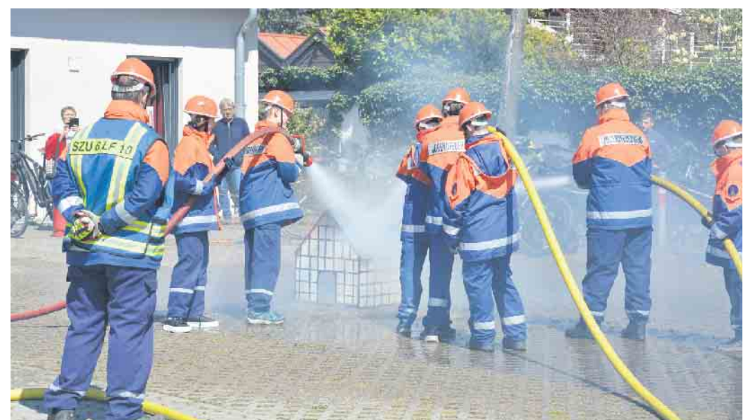
Der simulierte Brand wird kontrolliert gelöscht

mütlich gemacht und den Tag bis zum Abend hin genossen. JeP