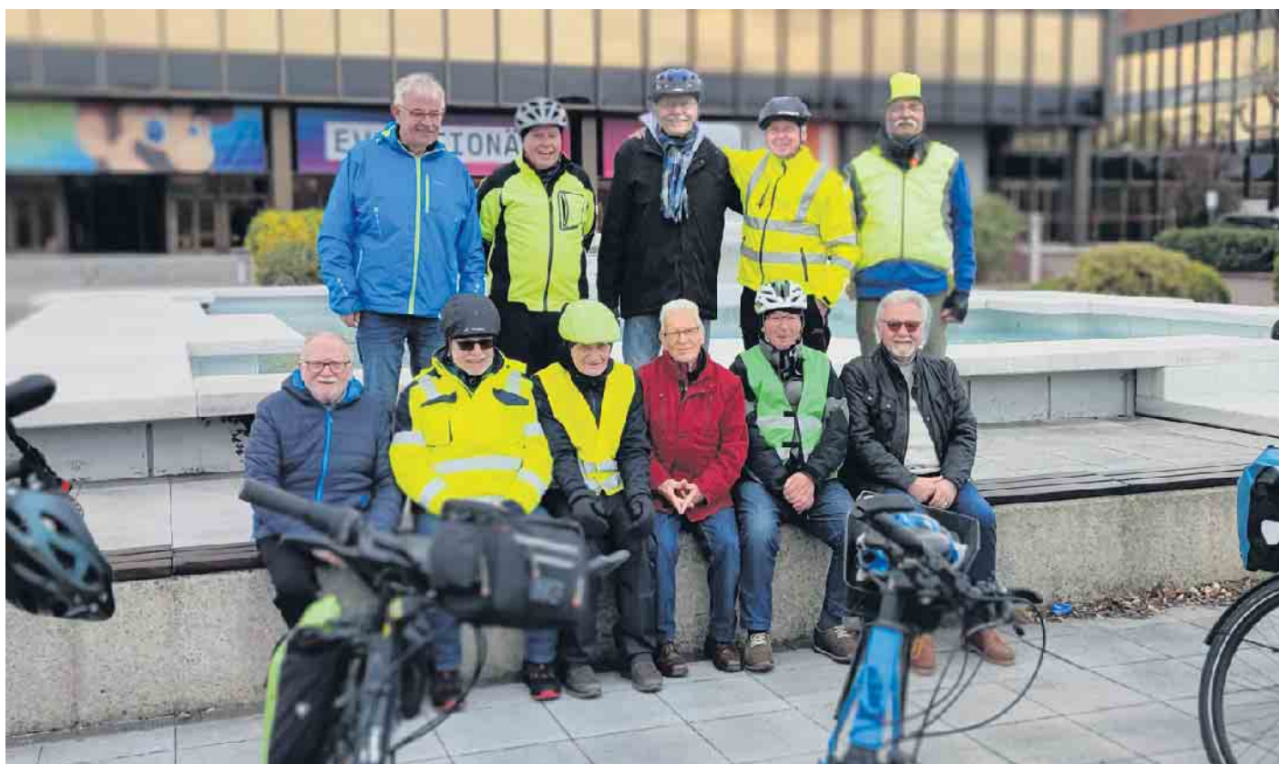
Die Radtruppe des TuS Müssen-Billinghausen in Paderborn.

Ein gutes Mittagessen mit zusätzlicher Tasse Kaffee brachte die Voraussetzung für eine gut vorbereitende Rückfahrt. Diese verlief sehr gut über die Panzer-Ring-Straße und die wenigen Tropfen Regen in Augustdorf konnte die Zufriedenheit der Truppe auch nicht stören.