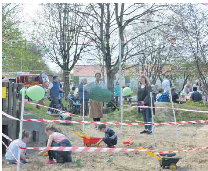
Die Kinder sind auf der Suche nach Schätzen versteckt im Sand