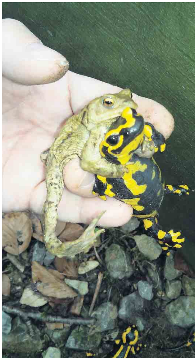
Amphibien werden vor dem Straßentod gerettet.

Eine dauerhafte Lösung sind beispielsweise Tunnel oder feste Zäune. Diese möchte der Kreis Lippe in Zukunft vermehrt einsetzen. Das ist ein Ergebnis der 2. Lippischen Artenschutzkonferenz, die Anfang März stattgefunden hat. „Im Freilichtmuseum Detmold gibt es schon dauerhafte Leiteinrichtungen“, sagt Jürgen Braunsdorf. Der Kreis Lippe möchte bald an der Lämershagener Straße die schon vorhandenen Tunnel dauerhaft anbinden und prüft weitere zehn Abschnitte im Kreisgebiet auf ihre Bau- und Finanzierungsfähigkeit.