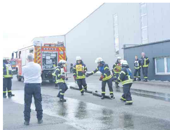
Leistungswettkampf auf dem Mw1 Gelände