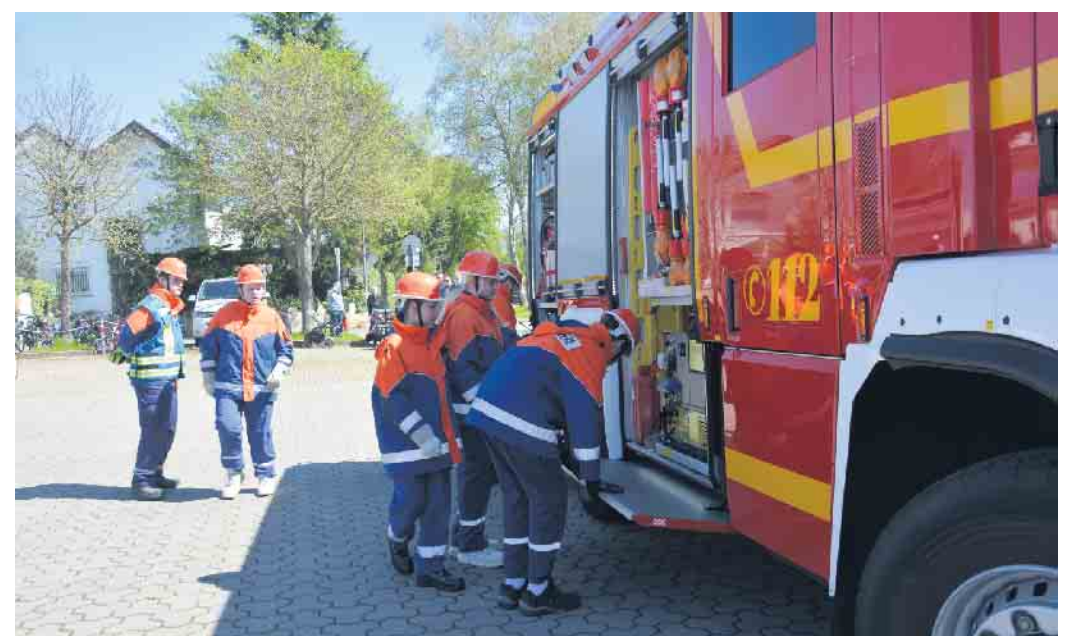
Kinder und Jugendfeuerwehr im Einsatz