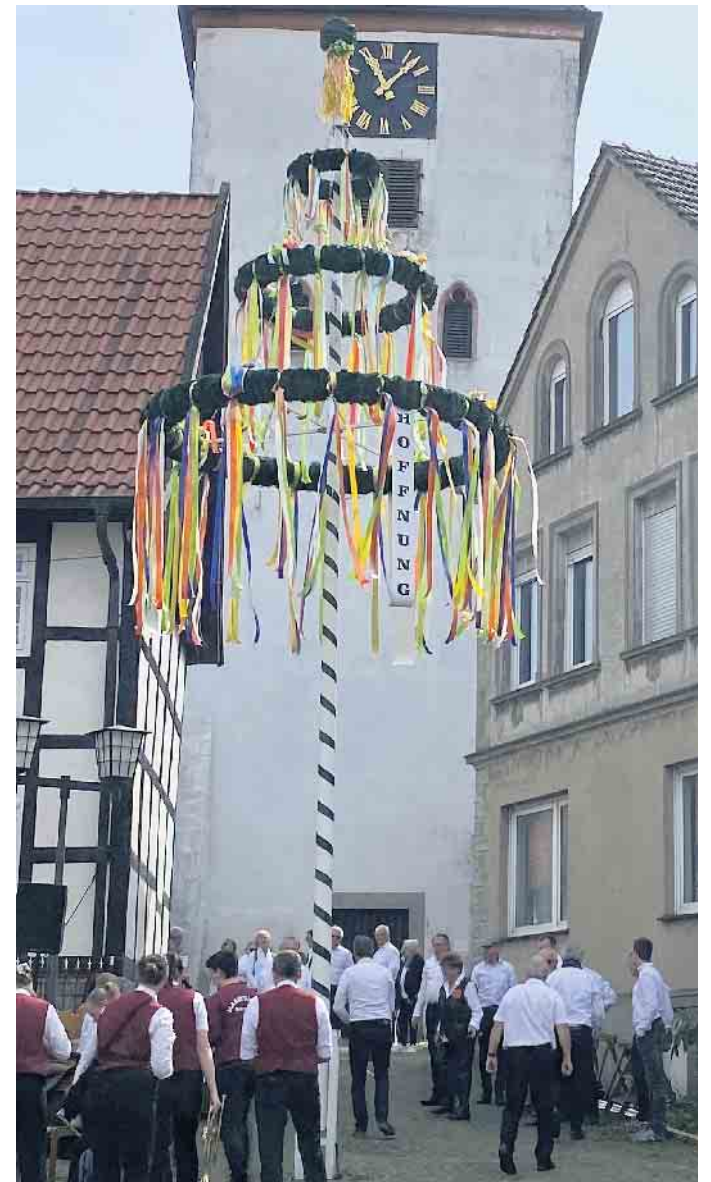
Der Maibaum vor der Kirche in Heiden

Etwa 300 Heidensche feierten am 1. Mai den Frühling. Zur Musik der Marpetaler richteten die Blumen- und Gartenfreunde den Maibaum auf dem Marktplatz in Heiden auf. Gemeinsam sangen sie „Der Mai ist gekommen“. Anschließend feierten sie weiter mit der Fest-