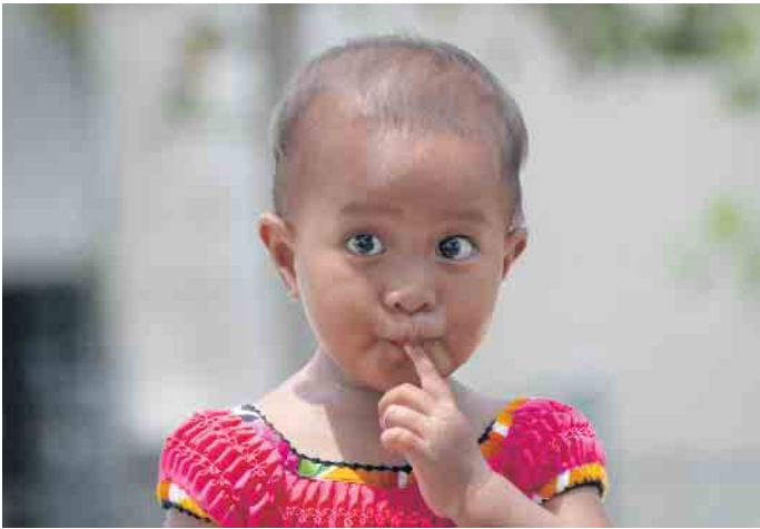
Kind auf Kiribati