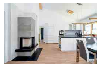
Viele Menschen wünschen sich, bis ins hohe Alter selbstbestimmt und komfortabel zu wohnen.

dass auch an eine Platzreserve zum Beispiel für eine pflegebedürftige Person oder eine Pflegekraft gedacht ist. Ein altersgerecht geplantes Eigenheim investiert in ein sorgenfreies Leben nicht erst in diesem Lebensabschnitt. Werden später trotzdem Umbauten oder Anpassungen für Barrierefreiheit notwendig, sind diese im Fertighaus leicht umsetzbar. Hausbesitzer können ihr Zuhause nach ihren Bedürfnissen gestalten und so länger eigenständig sowie komfortabel wohnen. Der Fertighausbau ermöglicht Änderungen wie das Versetzen von Wänden oder das Anfügen eines Schlafzimmers im Erdgeschoss. „Aufgrund des hohen Vorfertigungsgrades profitieren Bauherren auch bei Umbauten von der effizienten Bauweise“, erklärt BDF-Geschäftsführer Achim Hannott. (Bundesverband Deutscher Fertigbau e.V.)