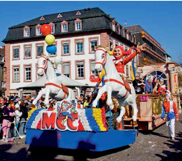
In der „fünften Jahreszeit“ sollten nicht nur die Fahrer der Karnevalswagen nüchtern bleiben, sondern auch alle anderen Jecken, die noch ein Fahrzeug führen wollen.