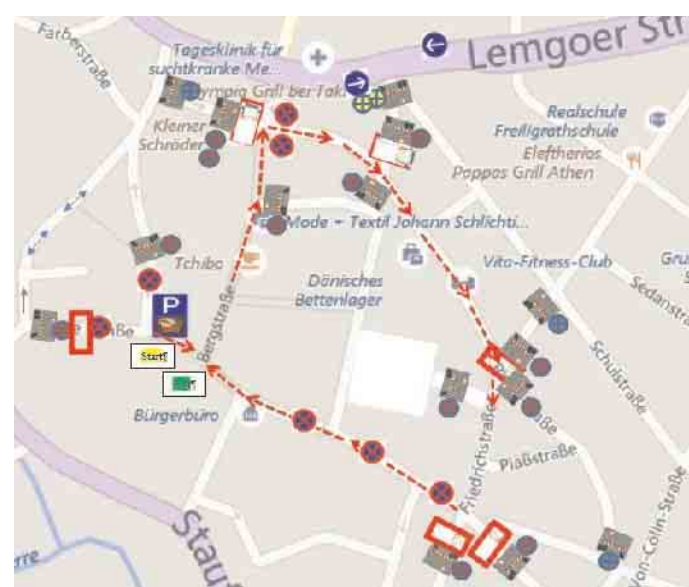
Streckenskizze des 6. Lagenser Rosenmontagsumzugs.