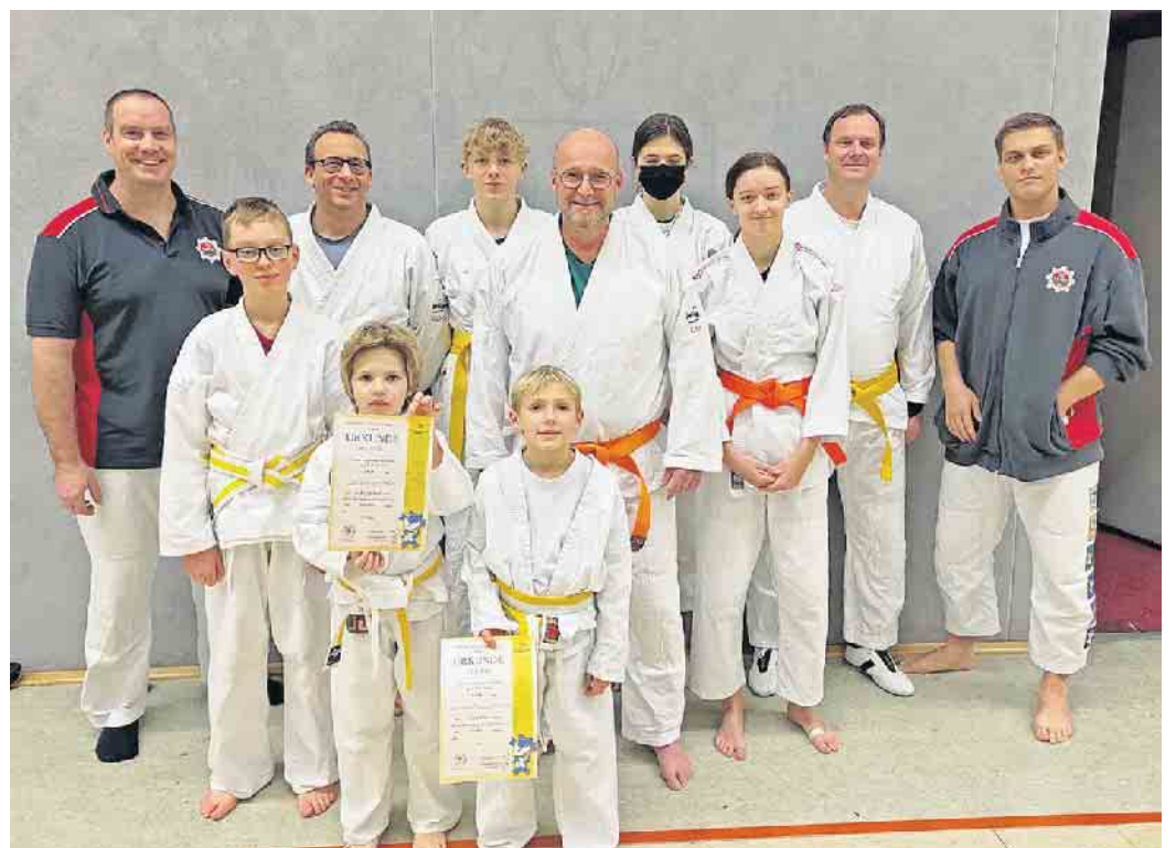
Am Ende des Tages nahmen alle Prüflinge ihre Gürtel entgegen, die sie im nächsten Training verdient tragen dürfen.

Die nächste Ausgabe erscheint am: Freitag, 03. März 2023 Annahmeschluss ist am: 27.02.2023 um 10 Uhr