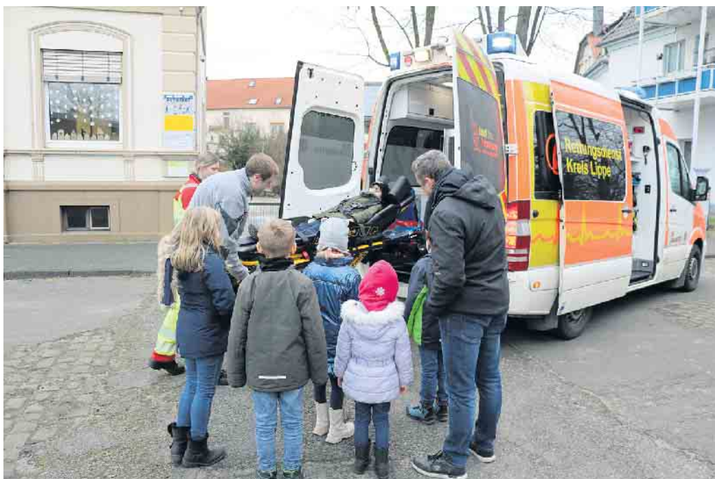
Die kleinen Ersthelfer erkunden den Johanniter-KTW und erleben hautnah, wie die Retter im Notfall handeln.

Koch begeistert. Denn von Pflasterkleben bis Herzdruckmassage haben seine kleinen Schützlinge viel gelernt und besitzen schon jetzt beste Voraussetzungen, um im Notfall helfen zu können. Das Trainingsangebot ist für Kitas und Schulen kostenlos. Mehr Infos zu Erste-Hilfe-Kursen in Kitas, Schulen und zu allen weiteren Kursen unter Tel. 05235 / 95908521. KHW