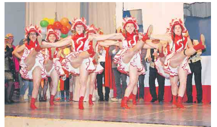
Die jungen Damen der Tanzgarde der TG Lage treten im „Lagenser Gürzenich“ an der Eichenallee mit zwei Tänzen auf.

ein Abenteuerspielplatz für Klein und Groß ein. Für das leibliche Wohl stehen Kuchen, Waffeln, Kaffee und Säfte bereit. Kinder zahlen 3,50 Euro und erhalten Frei- getränke.