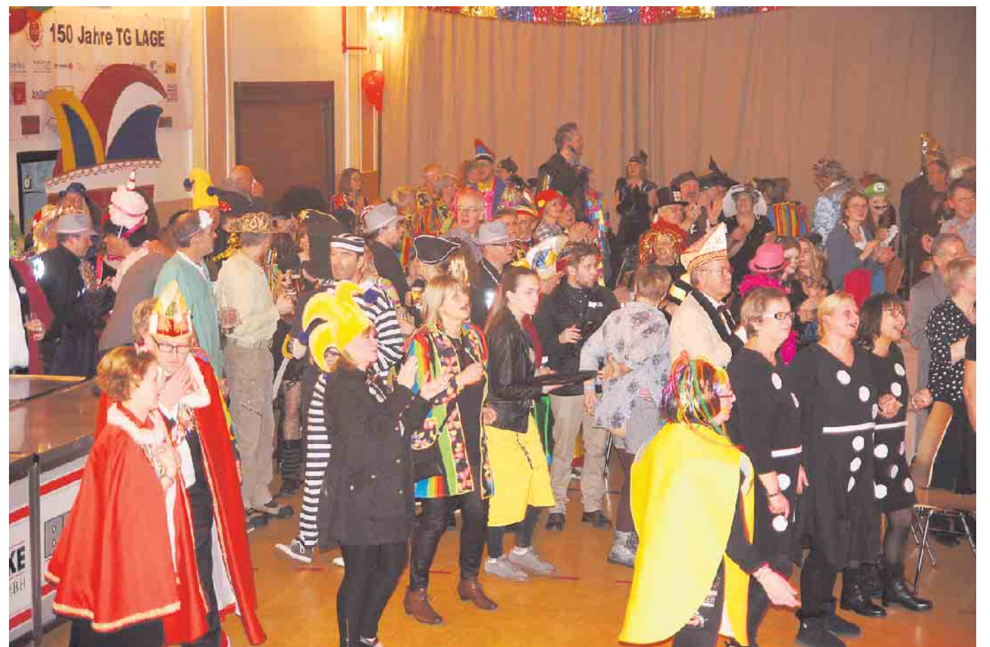
Ausgelassene Stimmung ist am Samstagabend garantiert.