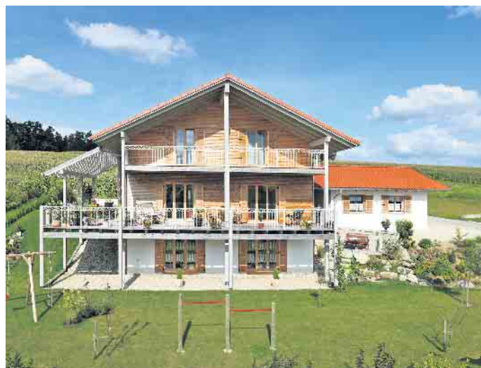
Dank individueller Hausplanung können sich alle Generationen dauerhaft unter einem Dach wohlfühlen. Foto: BDF/Sonnleitner Holzbauwerke

Neben den individuellen Anforderungen der Baufamilie sind bei der Planung eines Mehrgenerationenhauses mit gut und gerne 300 bis 500 Quadratmetern Wohnfläche auch etwaige Vorgaben auf dem Baugrundstück zu berücksichtigen. Kriterien eines Bebauungsplans können beispielsweise die maximale Anzahl der Vollgeschosse, die Grundflächenzahl und die Geschossflächenzahl sein. Beim Holz-Fertigbau achtet der Haushersteller mit darauf, dass diese und alle weiteren Vorgaben eingehalten werden. Weitere Vorteile eines Mehrgenerationen-Fertighauses sind die auf Wunsch schlüsselfertige Bauausführung und vor allem die hohe Energieeffizienz der industriell vorgefertigten Häuser. In Kombination mit besonders sparsamer Haus- und Heiztechnik verursachen sie nicht nur niedrige Energiekosten, sondern auch wenig bis keine CO 2 -Emissionen im Betrieb, wodurch sie sehr klimafreundlich und generationengerecht sind. BDF/FT