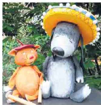
Die Figuren des Puppentheaters Hund Pedro und Katze Rosalie.

Alle in der Kita „Abenteuerland“ waren sich einig, dass die Vorstellung ein toller Erfolg war. Sie freuen sich schon heute auf die kommende Weihnachtszeit, denn das Figurentheater ist für Dezember erneut gebucht.