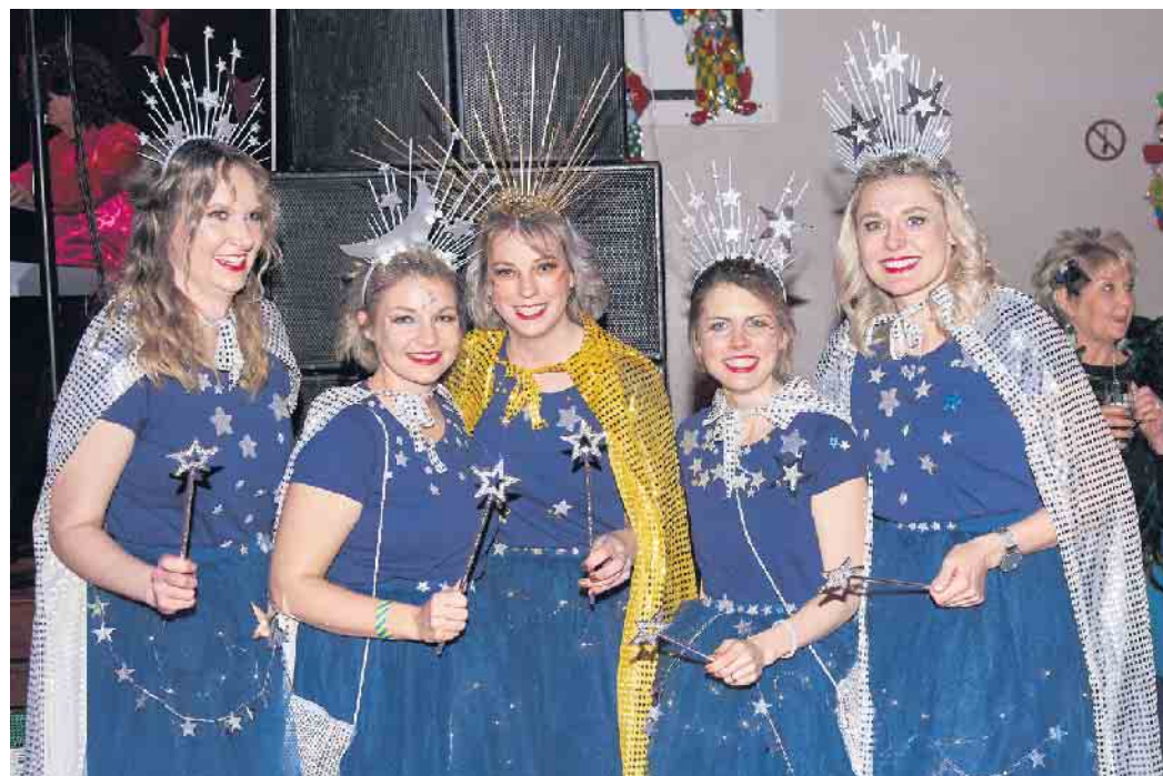
Sonne, Mond und Sterne gewannen den Kostümwettbewerb.