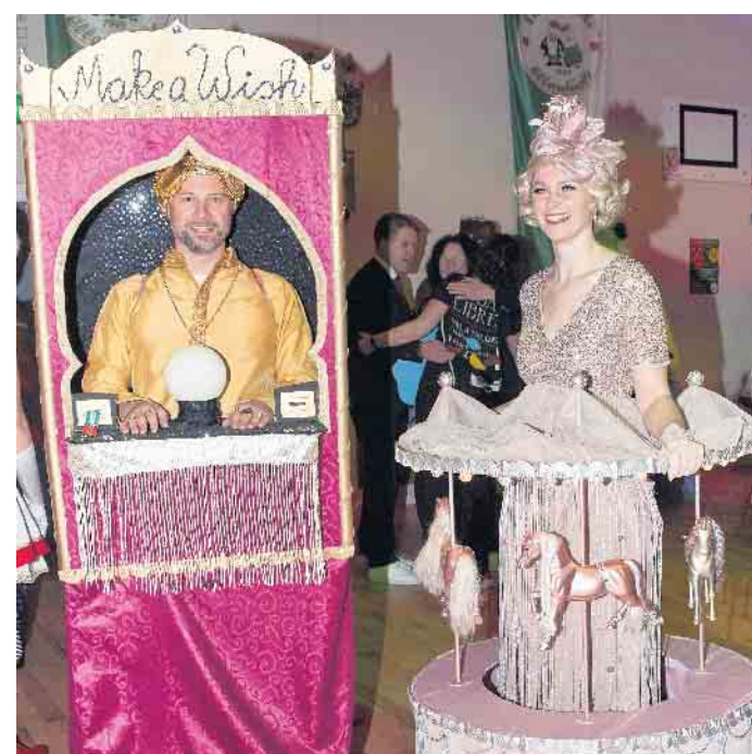
Karussell und Wahrsager belegten Platz 1 bei den Pärchen.

weiteren Platzierungen: 3) Ahoj, 7) Underberg, 8) Die Goldpokale, 4) Maleficent, 5) Die Schnecken, 6) Sunnerbieke Eistüten. KHW