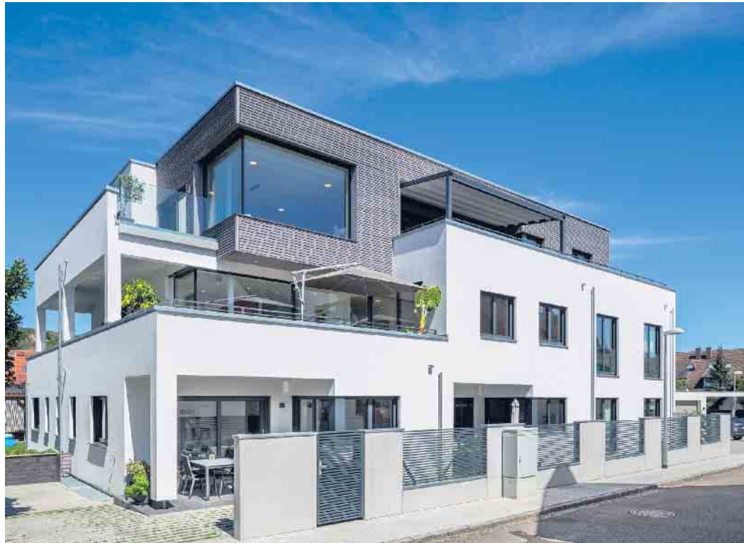
Mehrgenerationenhäuser in Holz-Fertigbauweise sind im Kommen.

Mehrgenerationenhäuser aus Holz sind ein zukunftsicheres Zuhause für die ganze Familie