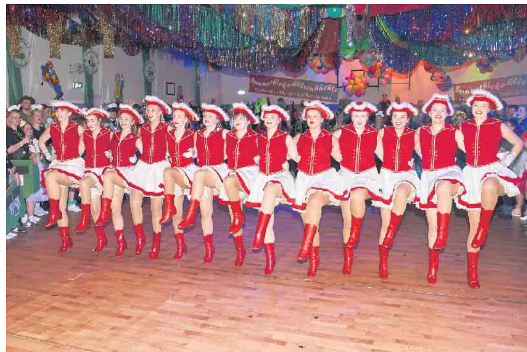
Das Sunnerbieke-Ballett - Lippes größte Tanzgarde.