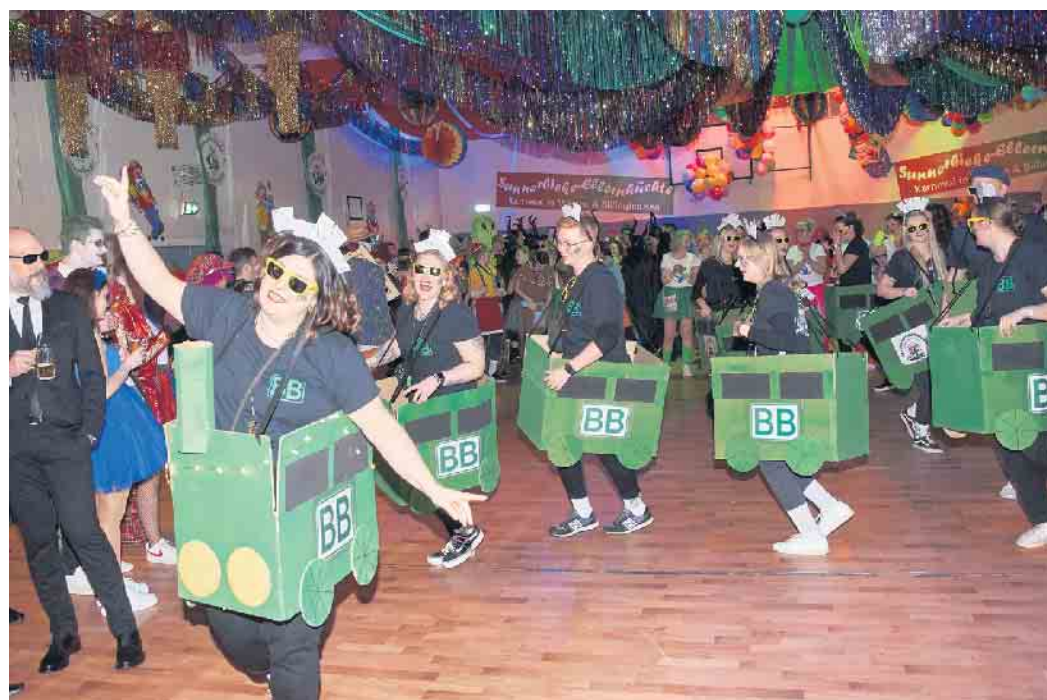
Platz 2: „Der Zug hat keine Bremsen“ und die Billinghauser Bahn auch nicht.