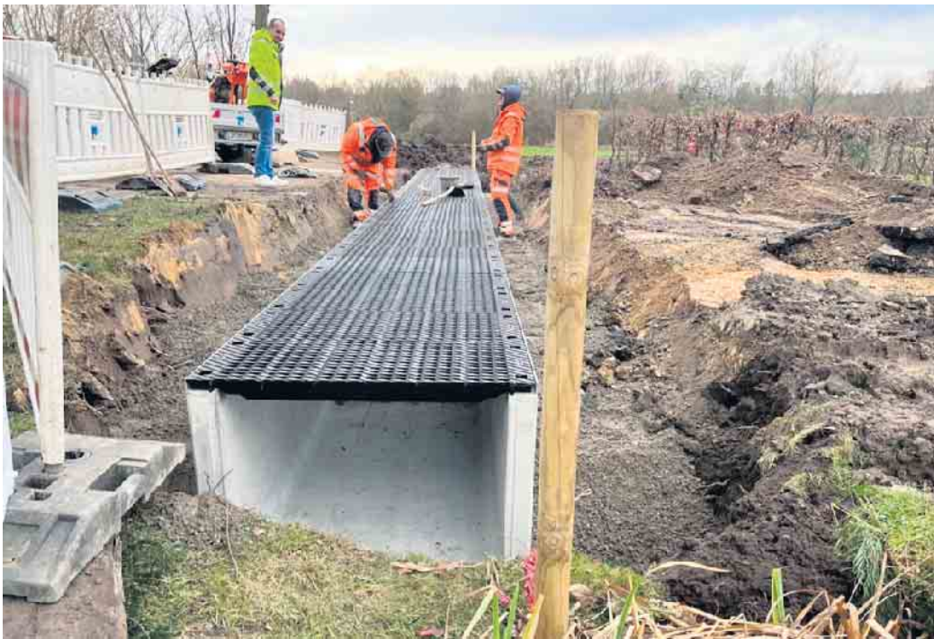
Sven Ranft (l.) vom Fachteam Stadtentwässerung, Wasserwirtschaft der Stadt Lage überwacht das Setzen eines neuen Durchlasses.

Zuerst wird das Gewässerbett vorbereitet und anschließend ein neuer Durchlass in der Heerstraße gebaut. Oberhalb der Heerstraße werden ebenfalls verrohrte Abschnitte aufgenommen und renaturiert. Der oberflächliche Zu-