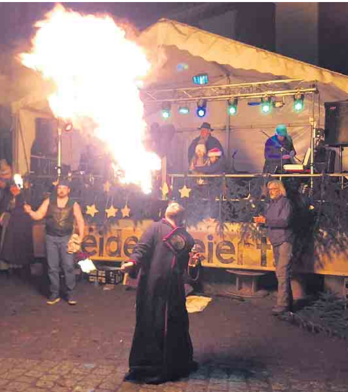
Pltazwette: Die Spendierfreude kann keine Grenzen

achtsmarkt mit den Klängen vom Balkon. Traditionelle Weihnachtslieder hallen dann noch einmal über den kleinen Marktplatz mit seinen vielen Lichtern und Sternen. Diese gemütlich weihnachtliche Stimmung in dem schönen Ambiente verdanken wir jedes Jahr aufs Neue den vielen Helfer*innen und Engagierten in den Vereinen - sie verdienen ein herzliches Dankeschön. Das Motto „vom Dorf fürs Dorf“ wurde eindrucksvoll in vielen Angeboten umgesetzt. Die Aktionsgemeinschaft freut sich nun darauf am 31. Dezember auf das vergangene Jahr 2024 anzustoßen und sich noch einmal für das Engagement zu bedanken. Für weitere Informationen besuchen Sie bitte unsere Webseite: www.lage-heiden.de