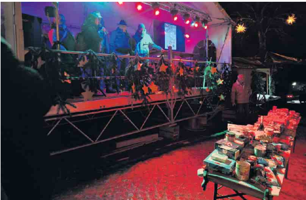
Besonders staunten die Kleinen ei der Feuershow des Heiden-Spektakel

Der 32. Weihnachtsmarkt in Heiden, organisiert von der Aktionsgemeinschaft Heiden e.V. in Zusammenarbeit mit zahlreichen Vereinen, hat am dritten Adventswochenende für eine zauberhafte und festliche Atmosphäre gesorgt. Der kleine, aber feine Marktplatz zog zahlreiche Besucher an und bot ein abwechslungsreiches Programm für Groß und Klein. Die Kinder standen im Mittelpunkt des Geschehens: Die Grundschul-kinder und der Kinderchor sorgten am Samstag mit ihren Weihnachtsliedern für besinnliche Stimmung. Am Sonntag hatten die Kinder aus dem Kindergarten ihren Auftritt und sangen mit dem Publikum einige Weihnachtslieder. Der Weihnachtsmann hatte an beiden Tagen seinen großen Auftritt und verteilte über 200 Schokoweihnachtsmänner an die kleinen Gäste. Weitere kreative Aktivitäten wie ein Lebkuchenhaus bauen, Kinderschminken, Dosenwerfen und die Ballonkünstlerin sorgten für strahlende Gesichter. Neben all diesen bunten Aktivi-