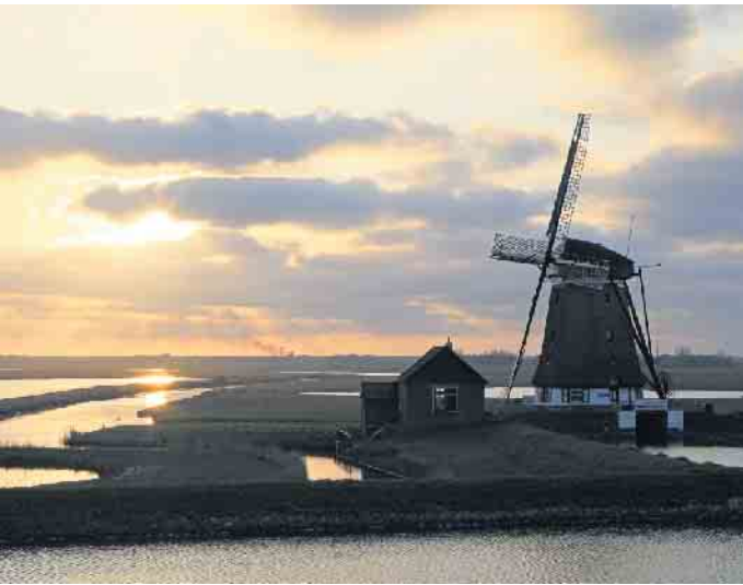
Mühle bei Oosterend.

sischen Inseln die Vielseitigste. Ein gut ausgebautes Radwegnetz sorgt dafür, dass Radler auf ihre Kosten kommen. Wanderer zieht es in die Bollekamer, an den Weststrand, in die Wälder um De Koog oder in die Dünenregionen. Dünenbuggy-Sportler genießen im Nordwesten die rasante Fahrt über den Strand, und Paraglider springen aus großer Höhe aus dem Flieger, um zielsicher auf dem kleinen Flugplatz von Texel wieder zu landen. Texel ist ein Eldorado für Naturliebhaber und -fotografen. Der Vortrag beginnt am Montag, 3. Februar, um 19.30 Uhr, in der Aula der Sekundarschule in Lage, Friedrichstraße 33. Der Eintritt ist wie immer frei.