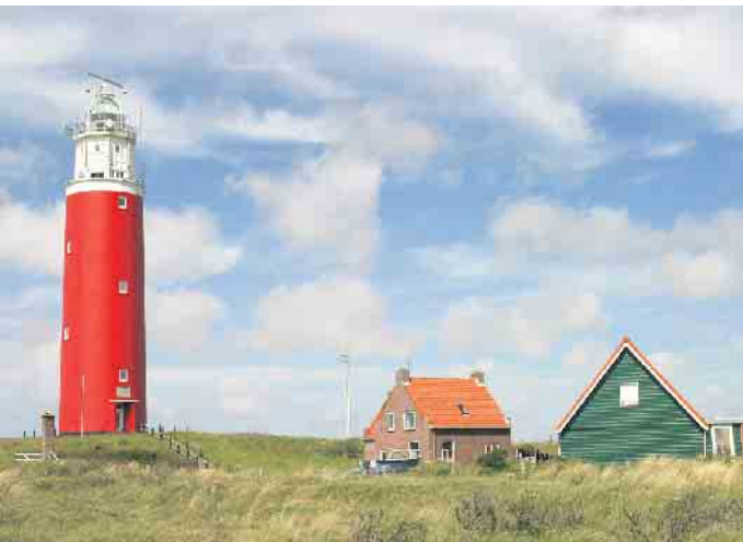
Leuchtturm De Cocksdorp

Die holländische Insel Texel ist die größte aller Westfriesischen Inseln. Die Landfläche der Insel beträgt knapp 170 Quadratkilometer und das bei einer Ausdehnung von etwa 25 Kilometer in Nord-Süd-Richtung bzw. 10 Kilometer in Ost-West-Richtung. Im Westen der Insel verläuft ein ca. 30 Kilometer langer Sandstrand. An der Ostseite blickt man auf das Wattenmeer. Texel ist von allen Frie-