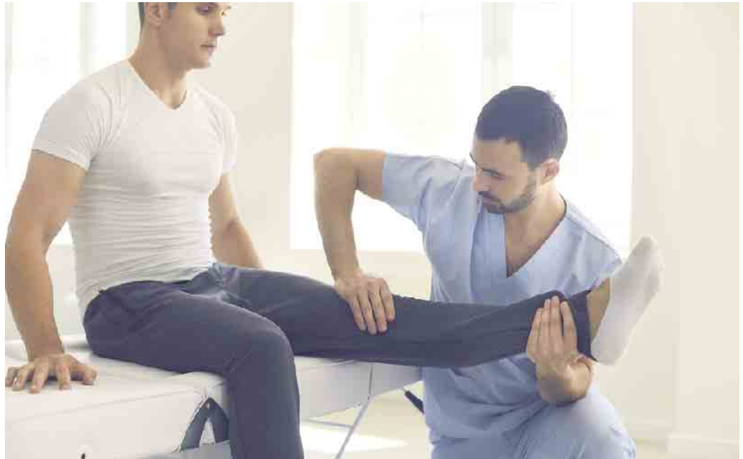
Rund 31.000 AOK-Versicherte im Kreis Lippe leiden an Arthrose im Knie- oder Hüftgelenk.

Im Jahr 2021 waren im Kreis Lippe wegen Coxarthrose 3.045 Frauen und 1.947 Männer in ärztlicher Behandlung. Bei der Gonarthrose waren es 14.989 Frauen und 11.042 Männer. In den meisten Fällen beginnt die Krankheit schleichend ab dem 50. Lebensjahr. Zu den charakteristischen Symptomen von Arthrose zählen Gelenkschmerzen bei Bewegungsbeginn. Häufig verstärken sich arthrosebedingte Anlaufschmerzen früher oder später, wenn die betroffenen Gelenke belastet werden. Geht der entstandene Belastungsschmerz in einen belastungsunabhängigen Schmerz über, so ist das ein eindeutiger Hinweis darauf, dass die Arthrose fortschreitet und sich der Gelenkknorpel abbaut. Warum sich der Gelenkknorpel bei manchen Menschen schneller abbaut als bei anderen, ist noch nicht zweifelsfrei geklärt. Hormonelle