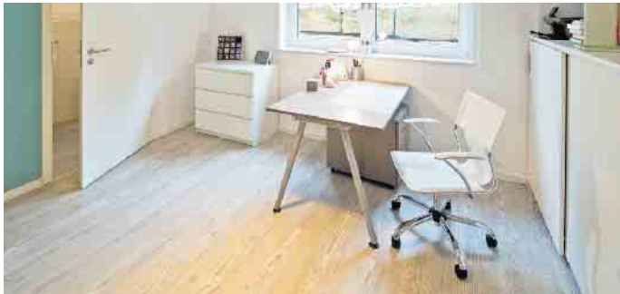
Kellerräume müssen täglich gelüftet werden - dabei gibt es manches zu beachten.

So bekommen Bauherren hohe Luftfeuchtigkeit im Keller gut in den Griff