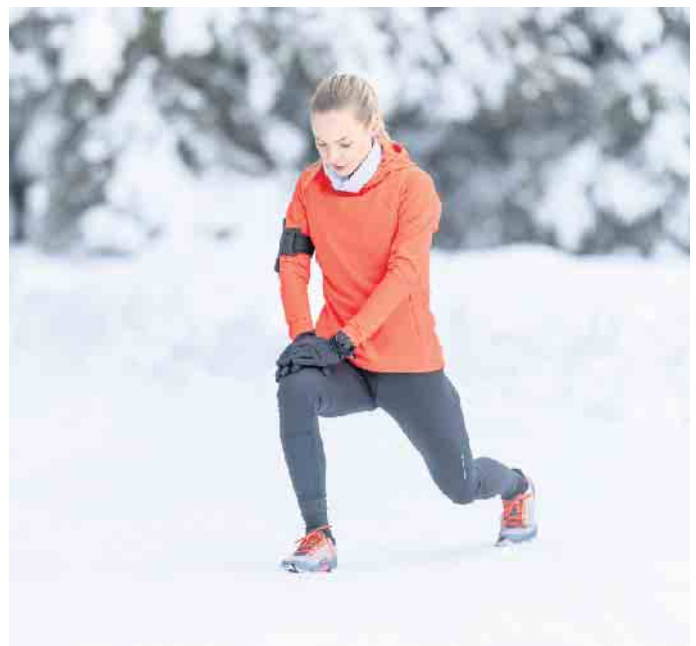
Regelmäßige Bewegung und ein gezielter Muskelaufbau helfen bei Arthrose gegen den Schmerz.

treffen können, bietet das Institut für Qualität und Wirtschaftlichkeit im Gesundheitswesen (IQWiG) eine Entscheidungshilfe für Patientinnen und Patienten mit Kniearthrose unter gesundheitsinformation.de .