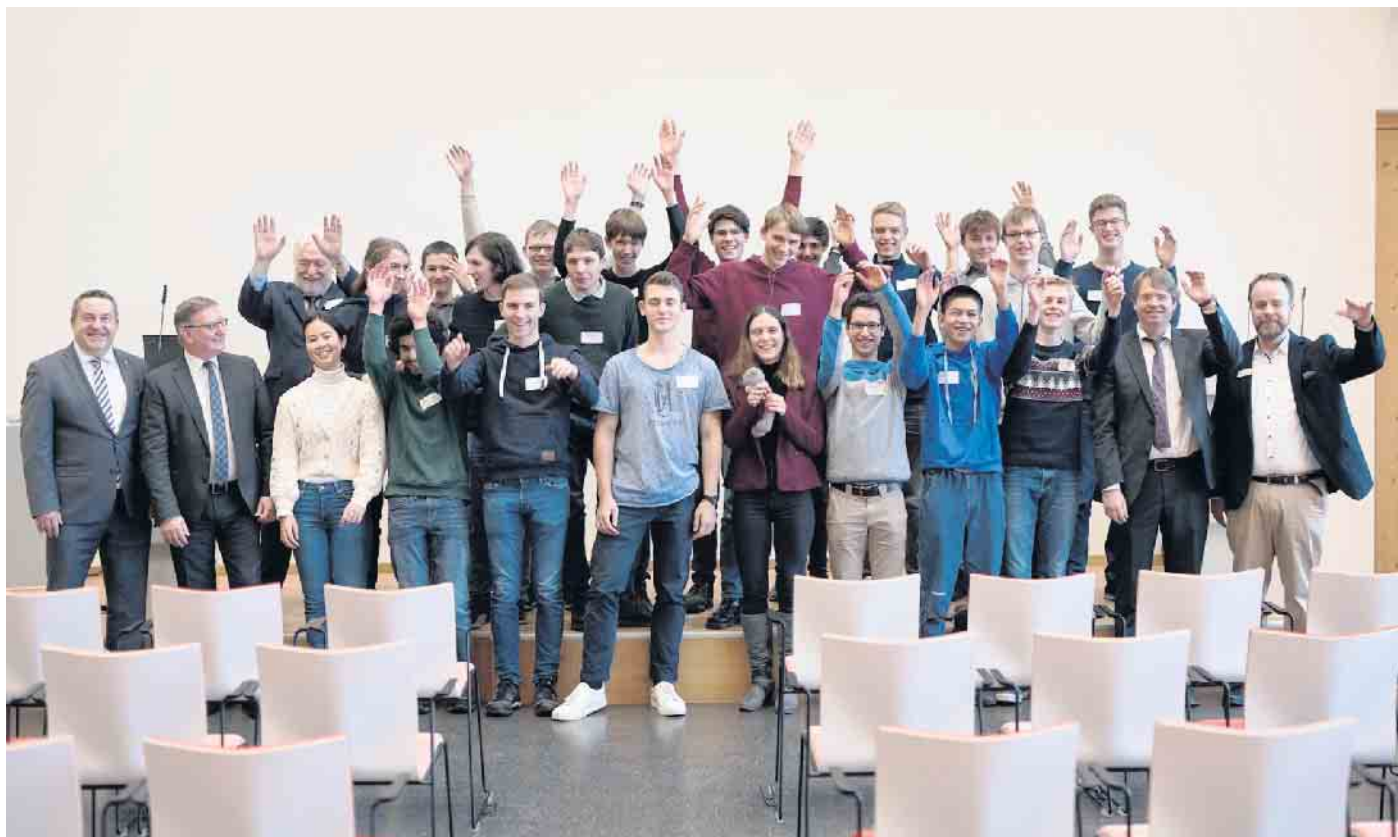
Freude in allen Gesichtern: Die PreisträgerInnen sowie Laudatoren und Betreuer des Bundeswettbewerbs Mathematik 2022 haben Spaß beim gemeinsamen Gruppenfoto im Rahmen der Preisverleihung