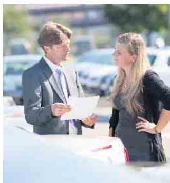
In vielen Kfz-Meisterbetrieben ist weiteres Informationsmaterial erhältlich - ein Flyer beantwortet die am häufigsten gestellten Fragen zum Thema E10.