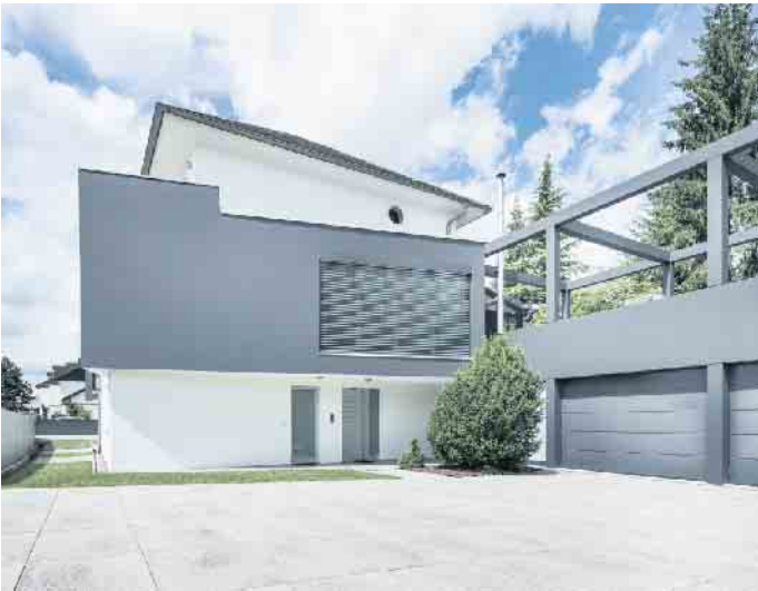
Die Fassade hat nicht nur eine schützende Funktion - sie bildet gleichzeitig das Gesicht des Eigenheims.