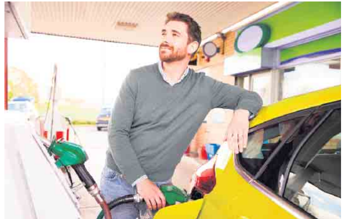
Fast alle Benzinmotoren vertragen den preiswerteren und umweltfreundlicheren E10-Kraftstoff.

E10 steht seit rund zehn Jahren an allen Tankstellen zur Verfügung und hat sich in langjährigem Einsatz bewährt. In der Regel können alle Benzinern mit Baujahr ab November 2010 problemlos damit betankt werden. Doch auch viele ältere Pkw vertragen den umweltfreundlicheren Treibstoff ohne Weiteres. Oft genügt schon ein Blick in die Tankklappe oder in die Betriebsanleitung, im Zweifelsfall kann man in der Kfz-Werkstatt nachfragen oder online unter www.dat.de/e10 nachschauen. Wichtige Informationen rund um den Einsatz des klimafreundlicheren Kraftstoffs liefert auch ein Flyer mit dem Titel „E10 für mein Auto (k)ein Problem“, den der ZDK gemeinsam mit weiteren Verbänden herausgibt. Den Flyer finden Verbraucher in vielen Kfz-Meisterwerkstätten in ganz Deutschland. Er beantwortet Fragen wie „Beeinflusst E10 Leistung, Verschleiß oder Ölwechsel?“, „Besteht die Gefahr von Beschädigungen?“, „Wie viel Geld kann ich wirklich sparen?“, „Und wie schützt E10 überhaupt das Klima?“. (djd)