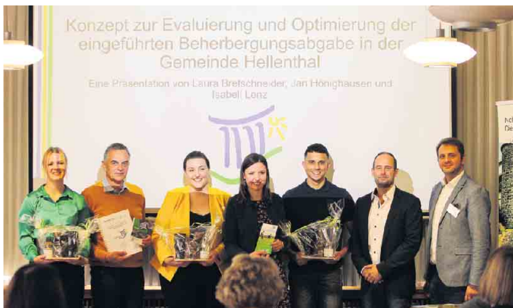
Die Wirtschaftsfachschule des Berufskollegs Eifel war zu Gast in Hellenthal.