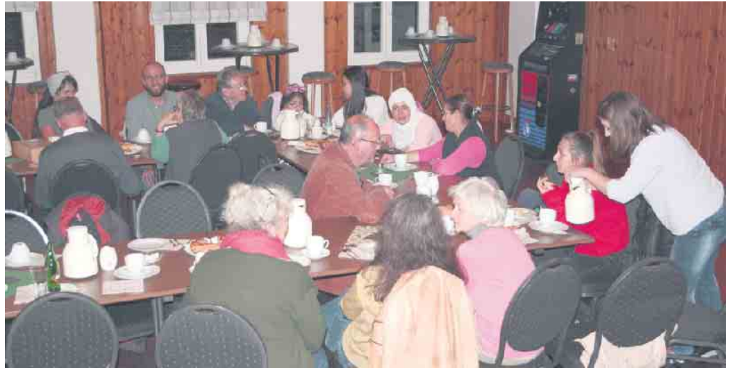
Das Begegnungscafé der Kaller Flüchtlingshilfe findet nun wieder jeden dritten Donnerstag im Monat statt.

Neu dabei sind seit einigen Monaten auch zwei junge Ukrainerrinnen, die mit ihren Kindern vor