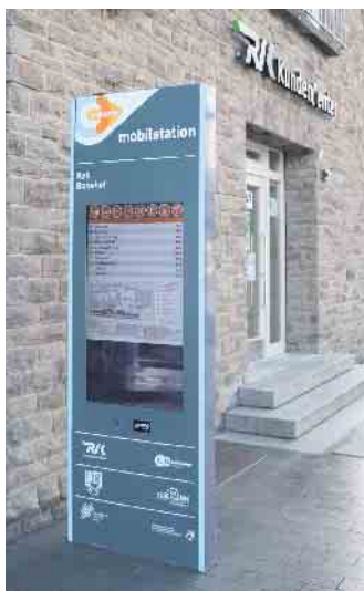
DFI Anzeige im Gewand der Mobilstation am Bahnhof Kall

Allgemeiner Vertreter des Bürgermeisters Kall, Markus Auel: „Die digitalen Infotafeln bedeuten insbesondere auch im Hinblick auf die Barrierefreiheit eine Aufwertung des Kaller Bahnhofs, der ja für viele Gäste auch das Tor zum Nationalpark und anderen touristischen Attraktionen in der Nordeifel ist.“