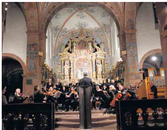
In der voll besetzten Basilika präsentierten Chor, Orchester und Solisten das vorweihnachtliche Vesperkonzert.

lungene Einstimmung auf den Advent. Zur Zugabe konnte das Publikum bei „Macht hoch die Tür“ in die Musik von Chor und Orchester mit einstimmen. (Stefan Hönig)