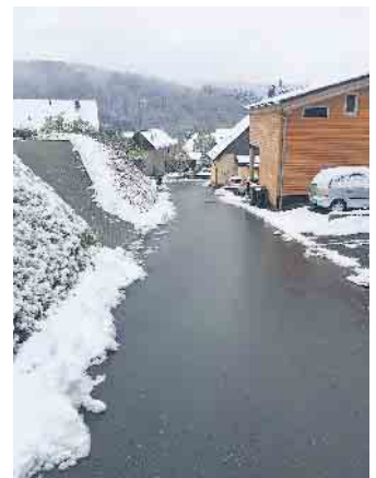
Für einen funktionierenden Winterdienst werden Anlieger gebeten, ihre Fahrzeuge außerhalb des Räumbereichs zu parken.

Und nicht nur die, wie er mit Bedauern feststellt: Schon bei einer Schneedecke von fünf Zentimetern häuften sich heute die Beschwerden - und nicht selten auch die Beleidigungen: „Früher fielen schon im Dezember 50 Zentimeter Schnee, und die Menschen wussten damit umzugehen. Heute hingegen ziehen einige Menschen erst bei Schneefall ihre Winterreifen auf.“ André Kaudel bittet um Achtsamkeit: „Fahren Sie entsprechend der Witterungslage