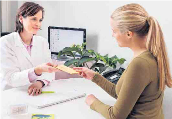
Beratung, Screening und Impfung zu Hepatitis B und /oder C sind bei Hausarzt möglich.

Gegen Hepatitis A und B gibt es gut verträgliche und wirksame Impfstoffe. In Deutschland gehört die Hepatitis-B-Impfung zu den von der STIKO (Ständige Impfkommission) empfohlenen Standardimpfungen für Säuglinge, Kinder und Jugendliche. Auch für Erwachsene ist sie sinnvoll. Bei Reisen sollte man zusätzlich gegen Hepatitis A geimpft sein, denn bereits im Mittelmeerraum und Osteuropa besteht ein erhöhtes Risiko. Die Übertragung erfolgt über kontaminiertes Wasser oder Lebensmittel, die damit gewaschen oder zubereitet wurden. Daher ist es empfehlenswert, sich rechtzeitig vor einer Reise gegen