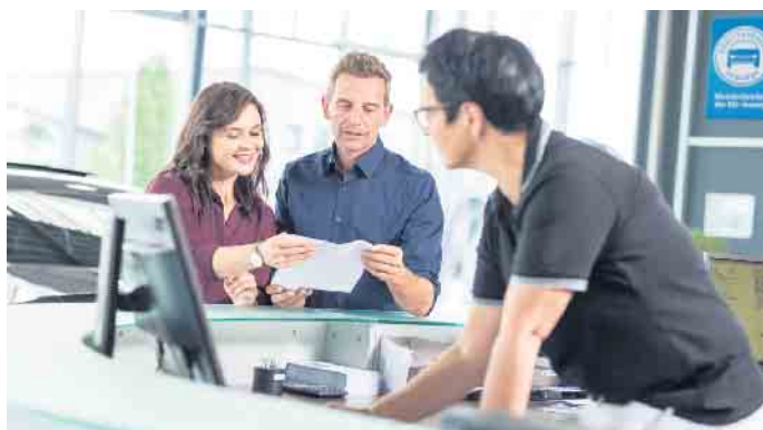
Wer sich unsicher ist, ob sein Benzinern E10 tanken kann, erhält Informationen im Kfz-Meisterbetrieb.

NOTARIUS Kfz-Technik Dahlem ☎ 02447-91 30 62