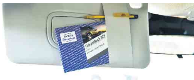
Steuern sparen leicht gemacht: das Fahrtenbuch als lukrativer Mitfahrer.

Wichtig ist in jedem Fall, dass das Fahrtenbuch ordnungsgemäß geführt wird. Weitere Tipps sowie einen kostenlosen Fahrtenbuch-