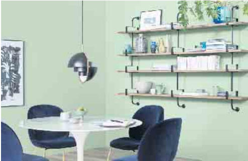
Mehr Mut zur Farbe: Das kreative Kombinieren von Wandfarben, Bödenbelägen und Möbeln verleiht dem eigenen Zuhause mehr Ambiente.

spannte Gelassenheit ins Zuhause bringt - eine gute Wahl beispielsweise für das Schlafzimmer. „Beige ist bei Interieur-Designern besonders angesagt“, weiß Inneneinrichtungsexpertin und Fernsehmoderatorin Eva Brenner: „Die Farbe bringt Wärme in den Raum, lässt ihn erstrahlen und wirkt gleichzeitig zurückhaltend.“