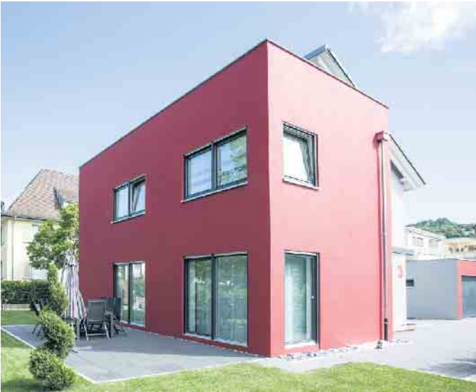
Fassadenfarben setzen markante Akzente und bieten oft weitere Funktionen, wie den Schutz vor dem Ausbleichen oder Aufheizen der Fassade durch die Sonne.

Regionen beispielsweise im Norden und Westen Deutschlands. Das klassische Material wird heute mit einer noch größeren Vielfalt an Farben und Formaten wiederentdeckt. Die moderne Klinkerfassade erlaubt besondere Gestaltungen, gerade im Rahmen der Fassadendämmung. Die Basis dafür bildet stets ein Naturmaterial: Lehm, der entweder zu Klinkern gepresst oder zu Ziegeln geformt und anschließend gebrannt wird. (djd)